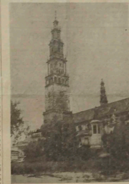
Katedra Jasnogrodzka w Częstochowie.