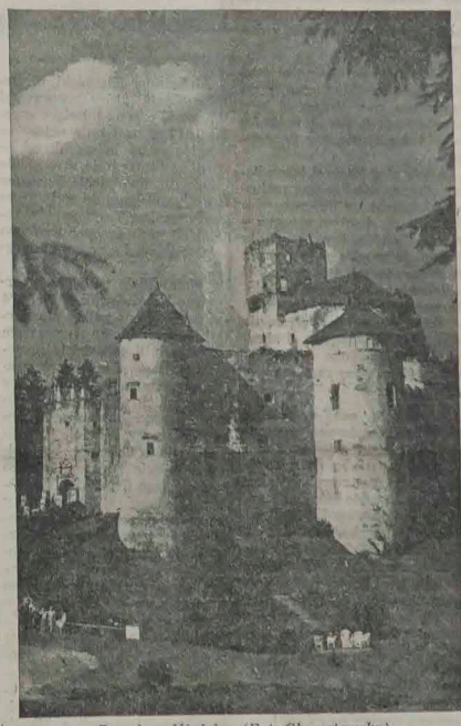
Zamek w Niedzicy (Pol. Chomętowska)

międzynarodowego w Europie, uwolnionej od zmyru komunistycznej. Co więcej, polityka taka katastrofalnie podcina moralne siły Zachodu, bez których nie może być prawdziwego zwycięstwa. (B. F.) (*) P. McCloy — dodaje od siebie korespondent „New York Herald Tribune” — nie wypowiedział się wyraźnie w tym kierunku, że sprzyjałby zwyciężąc zachodni są z powrotem do