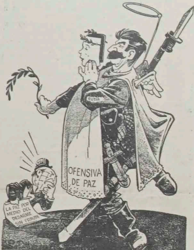
DEL DIARIO "THE GINGINATI ENQUIRER", GINGINATI, E. U. A.