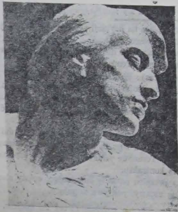
Głowa Chopina. Pomnik w Warszawie.

Zamówienia z prowincji prosimy wysyłać listownie, załączając „giro postal”.