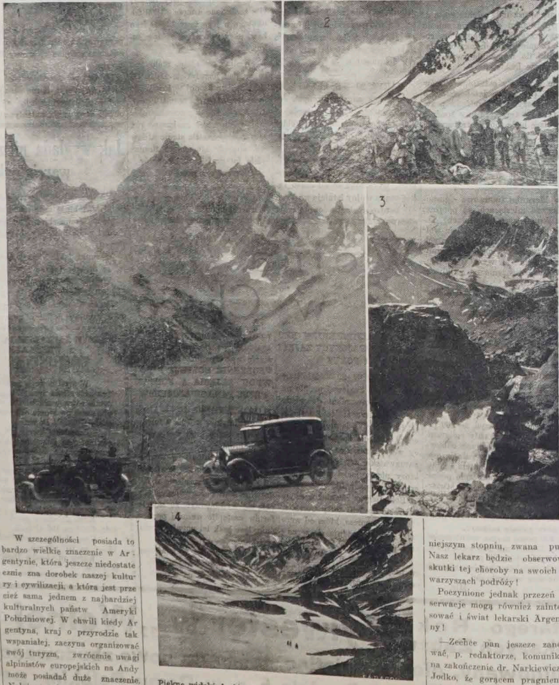
Piękne widoki Andów, które niezadługo zdobywane będą przez naszych Rodaków.