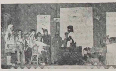
Sklepoduszki w sidlepie (scena z „Wyprawy po szczęście”)