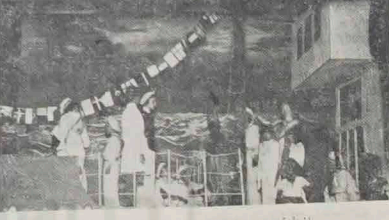
Jedna ze scen „Wyprawy po szczęście”.