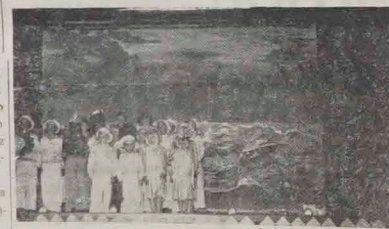
Grupa dzieci podczas śpiewu „Hymnu Morza”.