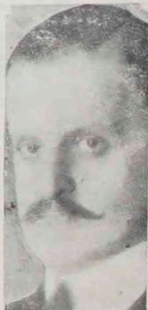
P. SAAVEDRA LAMAS Minister Spraw Zagranic.