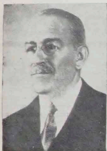
GEN. A. JUSTO PREZYDENT ARGENTYNY

Telegram gen. Justo do wiceprezydenta Roca: