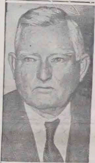
Mr. John Garner, z Texas, wybrany wiceprezydentem Stanów Zjednoczonych.

W roku 1921 Roosevelt dostał atak paralizacji, który go przykuwał do łóżka. Udaje się następnie do miejsc kąpielowych, gdzie walczył z chorobą — stan jego poprawił się znacznie i może się orbić bez wózka.