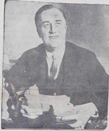
FRANKLIN D. ROOSEVELT NOWY PREZYDENT U. S. A.

W popołudniu finansowym ostatniej wtorek, setki kas pancernych zostały wynajęte w bankach przez publiczność, celem przechowania drogiego kruszcu. Ze strony bankowej zapewniają, że publiczność nie przesłała kupować złoto, za znaczącym tym samym swoje zaufanie do nowego rządu.