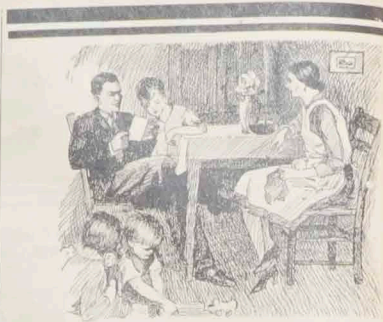
Spokój domowego ogniska za pewni Panu Książeczka Oszczędnościowa

Sytuacja robotników polskich w Belgji, skutkiem długotrwałego strajku w kopalniach, jest nadal niezwykle ciężka. W południowej Belgji około 10.000 górników polskich znajduje się poprosu w między. Akeja pomocy prowadzona jest przez belgijski centralny komitet pomocy bezrobotnym, konsulatu polski w Brukseli, oraz delegatury Polskiego Czerwonego Krzyża na Belgje. P. C. K. u dzielił dotychczas pomocy wielu rodzinom górniczym, otażając zwłaszcza opieką dzieci. Mimo szerokiego rozmiarów, akcja pomocy nie może całkowicie przeciwdziałać strasznej sytuacji, w jakiej znajdują się górnicy polscy.