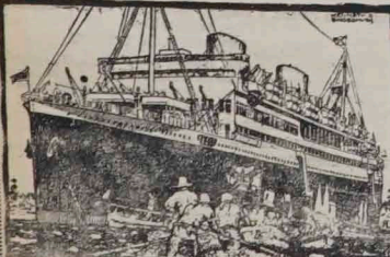
THE ROYAL MAIL LINE

Koncesjonowana przez rząd Polaki Emigranci mogą skierować swoją korespondencję na stały adres: