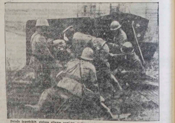
Dziła japońskie, zbijące silnym ogniem podczas ostrzeliwania wioski chińskiej Wusung.