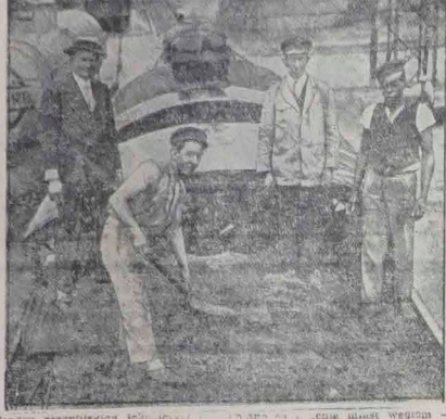
Tenary starzyjszacia iol... kawa, którą opala się piodo.

(szej ekonomicznej) republiki, by rząd, miał płacić długie zagranicę, zapłacić swe zobowiązania wewnętrzne, jak pensje pracownikom?