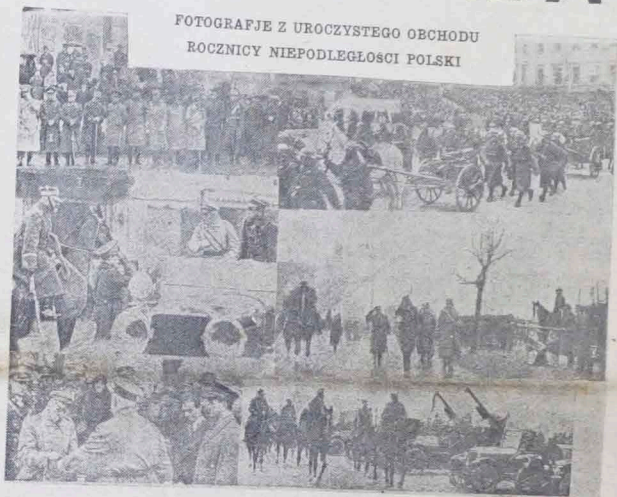
FOTOGRAFJE Z UROCZYSTEGO OBCHODU ROCZNICY NIEPODLEGŁOŚCI POLSKI

Dwanaście lat upływa ód czasu powrotu do kraju więźnia magde- burskiego i ostryżnicę go... 11-ty Listopad to po wsze czasy najuroczystsze święto Polaków, to