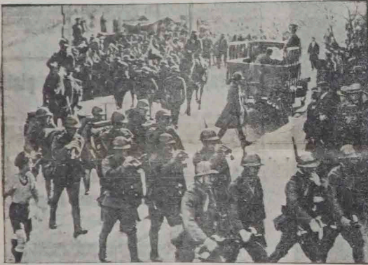
Niemie musi rozbrzmieć dzwiek trąbki japońskiej piechoty, dla ucha mandzurskiego przechołdnia.