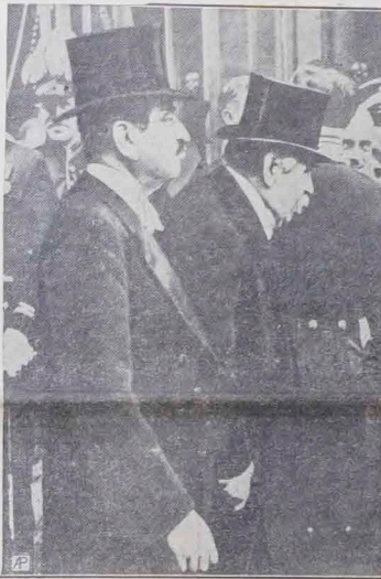
Przy zmianie na stanowisku ministraspraw zagranicznych w Francji, obarczony wiekiem Briand (na prawo) oddaje swój urząd ministrowi Laval, stojącemu w pełni swych sił.