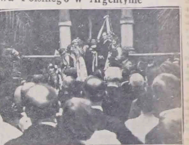
Moment otwarcia Domu Polskiego