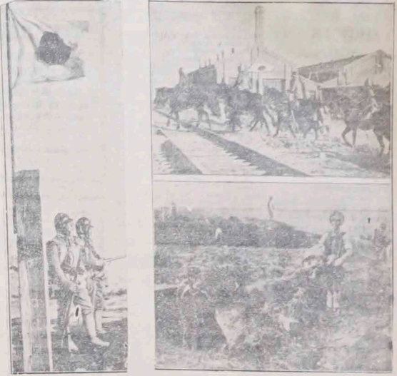
Ze strony lewej: Posterunki japońskie przy linii kolejowej w pobliżu miasta Cielihar. U góry z prawej: Wjazd kawalerji japoń- skiej do miasta. U dołu z prawej: Chińskie okopy w odcinku bojowym Anganchi