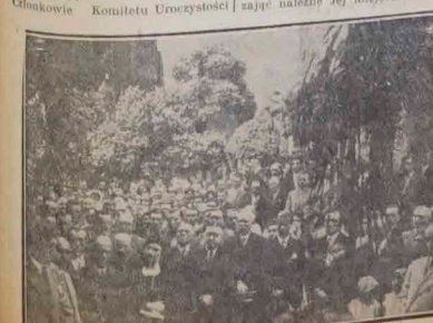
Publiczność zebrana podczas Hymnów.