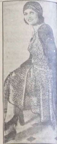
Ułubiona polska artystka filmowa, Pola Negri, przeżyła ostatnio w Santa Maria (Kalifornii) bardzo ciężką chorobę.