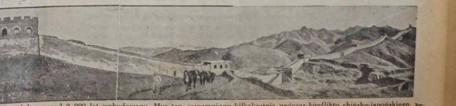
Mur Chiński, szerokości 3.65 m. i wysokości 7.60 m., został podobno przed 2.000 lat wybudowany. Mur ten, wspomniany kilkakrotnie podczas konfliktu chińsko-japońskiego, oparty jest w liczne wieże obserwacyjne i prowadzi przez góry i doliny około 2.000 kilometrów w głąb kraju.