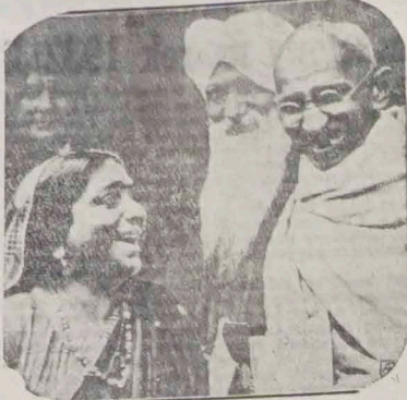
Ghandi w rozmowie ze sławną poetką indyjską Sarojini Naidu, która prawdopodobnie w razie ustąpienia lub śmierci Ghandiego stanie na czele ruchu niepodległościowego.