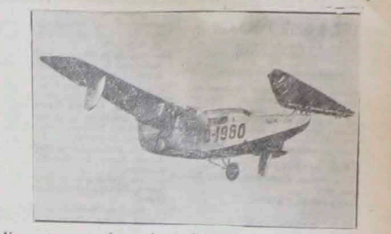
Nowy typ aeroplanu niemieckiego, który jest w stanie latać w tył...