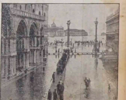
W Wenecji, z powodu ostatnich długotrwałych deszczów, nastąpił wylew. Poziom wody w Kanałach weneckich podniósł się do tego stopnia, że nawet wysoko położony plac św. Marka znajduje się pod wodą a dla ruchu ulicznego musiano ułożyć prowizoryczne drzewniane kładki.