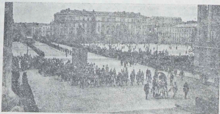
SKŁADANIE WIEŃCA NA GROBIE NIEZNANEGO ŻOŁNIERZĄ W WARSZAWIE.

Szanghai, Chiny. — W zwią- zku z powstaniem jeszcze jednego rządu chińskiego — rządu katoń- skiego Wang, prasa pekińska podkreśla, iż w Chinach jest obec- nie dziewięć rządów, a więc w Pekinie, z marszałkiem Czang Tso Linem na czele, trzy rządy