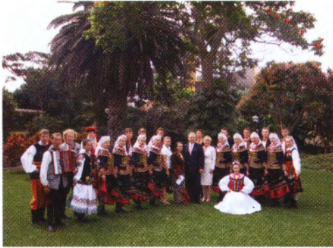
Grupo Folklórico de Hrubieszów