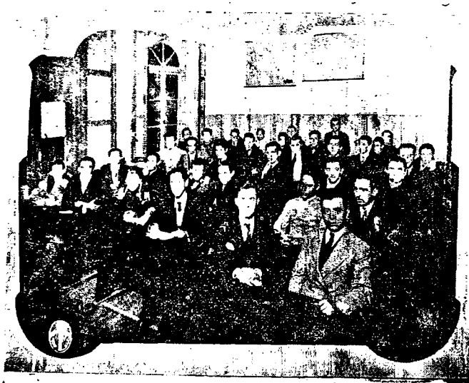
Uczniowie podczas wykładów.