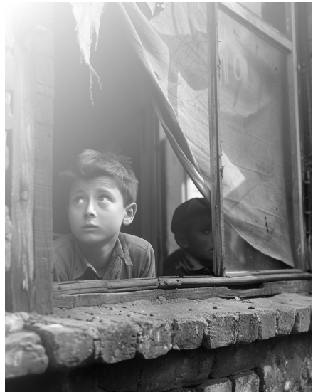
Ilustracje: Midjurney by Daria Wilkinson

Chłopiec, choć młody, pragnął pomóc. Zrozumiał, że każdy, nawet dziecko, może mieć swój udział w walce o lepsze jutro. Zamiast biernie obserwować, Franek zdecydował się dołączyć do innych dzieci, które wspierały powstańców. Razem zbierali żywność, wodę i materiały potrzebne na front.