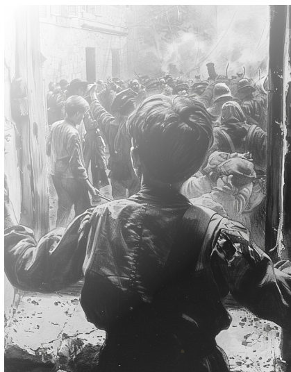
Ilustracje: Midjourney by Daria Wilkinson

Dni stawały się coraz dłuższe, a walki intensywniejsze. Janek, pomagając najlepiej jak potrafił, z dnia na dzień stawał się coraz bardziej świadomy tego, co działo się wokół niego. Widział odwagę, poświęcenie, ale też cierpienie i straty. Mimo młodego wieku, jego serce nappełniło się mieszanką bólu i dumy. Widział też, jak wszyscy wokół niego, młodzi i starzy, pracowali razem, by chronić swoje domy i ulice przed wrogami.