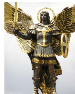
XI Паломництво Медичних Працівників

Сердечно запрошую Вас взяти участь у паломництві медичних працівників до Всеукраїнського Санктуарію Непорочного Зачаття Пресвятої Діви Марії в м. Бердичеві яке відбудеться 19 жовтня 2024 року.