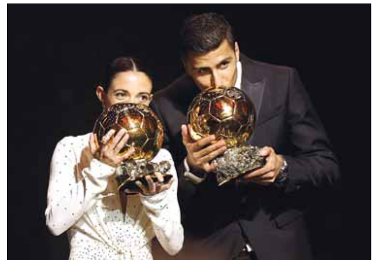
Tegoroczna gala plebiscytu Złota Piłka – to wielki sukces Hiszpanów: za najlepszą piłkarkę na świecie uznano 26-letnią Bonmati, a piłkarzem – 28-letni Rodri

Za najlepszy męski zespół uznano triumfatora Ligi Mistrzów i hiszpańskiej ekstraklasy Real Madryt, a za najlepszy kobiecy – Barcelonę, która zdobyła potrójną koronę. Trofeum Gerda Muellera dla najlepszego strzelca przyznano Anglikowi Harry'emu Kane'owi i Francuzowi Kylianowi Mbappe – obaj zdobyli po 52 bramki. W przeszłości w tej kategorii dwukrotnie zwyciężył Lewandowski.