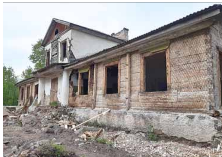
Dworek w Mazuryszkach przed rozpoczęciem prac renowacyjnych

Przy okazji wypadu podziękować wszystkim pracownikom Samorządu Rejonu Wileńskiego, którzy przyczynili się do zruszenia z martwego punktu prac nad zachowaniem oryginalnego pałacyku, gmachu byłej szkoły w Mazuryszkach i przygotowali jego renowację.