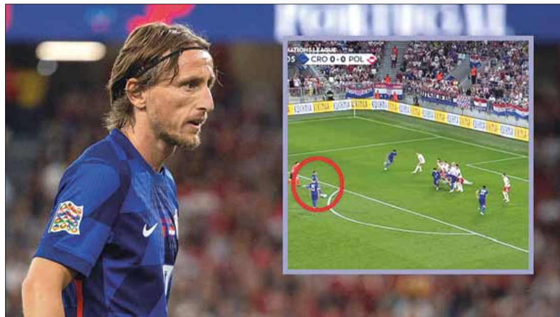
Przepięknym strzałem w okienko bramki z rzutu wolnego kapitan Chorwatów 39-letni Luka Modric pogroził reprezentację Polski

W grupie C1 po sześć punktów mają Szwecja i Słowacja. Skandynawowie pokonali u siebie Estonię 3:0, a Słowacy, także na własnym obiekcie, wygrali z prowadzonym przez Fernando Santosa Azerbejdżanem 2:0.