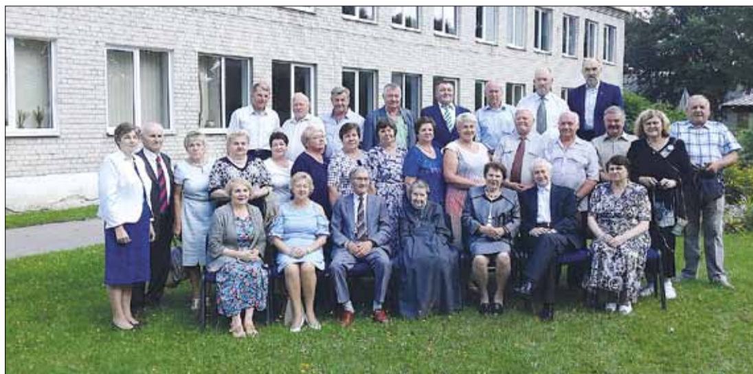
Spotkanie absolwentów w Ciechanowiszkach po 50 latach od ukończenia szkoły

Opracował Michał Treszczyński