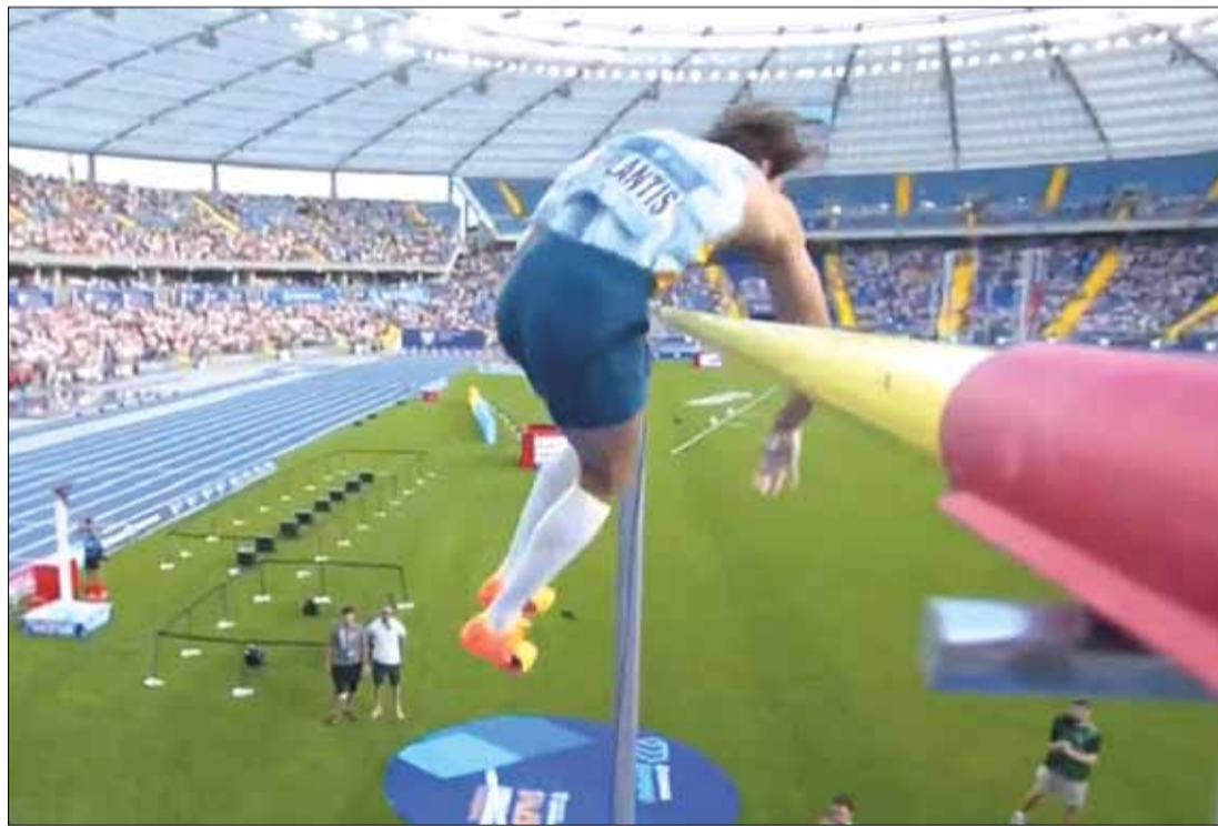
Armand Duplantis już po raz 10. poprawił rekord świata w skoku o tyczce

Kolejny mityng Diamentowej Ligi odbędzie się w piątek na Stadio Olimpico w Rzymie, gdzie w czerwcu lekkoatleci rywalizowali podczas mistrzostw Europy.