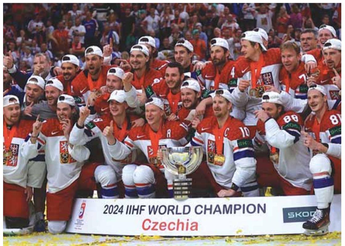
Czesi powrócili na hokejowy tron po 14 latach i po raz 7. wywalczyli tytuł mistrzów świata

Do praskiej hali O2, gdzie rozgrywano finałowe spotkanie, weszło prawie 17 i pół tysiąca kibiców. Kolejne 15 tys. oglądało mecz na wielkich telebimach na Rynku Starego Miasta w Pradze. Strefa kibica w