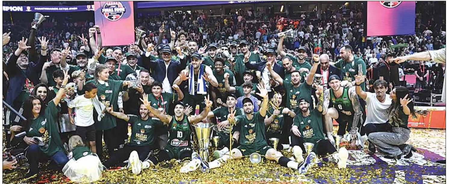
Real Madryt, najbardziej utytułowana drużyna Euroligi, tym razem musiał uznać wyższość klubu z Aten