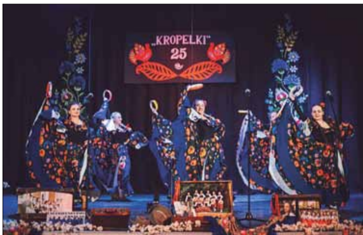
FOT. CENTRUM KULTURY W RUDOMINIE