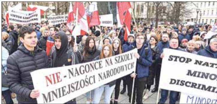
Wiec protestu przeciwko dyskryminacji szkół polskich w rejonie trockim przed gmachem rządu RL w marcu 2022 roku

Rada Samorządu Rejonu Trockiego zignorowała prośby rodziców uczniów Szkoły Podstawowej im. Andrzeja Stelmachowskiego w Starych Trokach i podjęła decyzję o reorganizacji polskojęzycznej placówki edukacyjnej. Jest to zaiste dziwna decyzja jeszcze bardziej potęgująca napięcie w społecznościach mniejszości narodowych, które zostały zbulwersowane nagonką, jaka ostatnia została rozpętana wobec szkół z rosyjskim i polskim językiem nauczania.