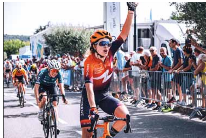
Polka osiągnęła duży sukces i udowodniła dobrą dyspozycję na początku sezonu

Polka sukcesy odnosi także na torze. Na koncie ma brązowy medal mistrzostw świata w olimpijskim omnium w 2020 roku oraz zdobyła sześć krążków mistrzostw Europy w różnych konkurencjach.