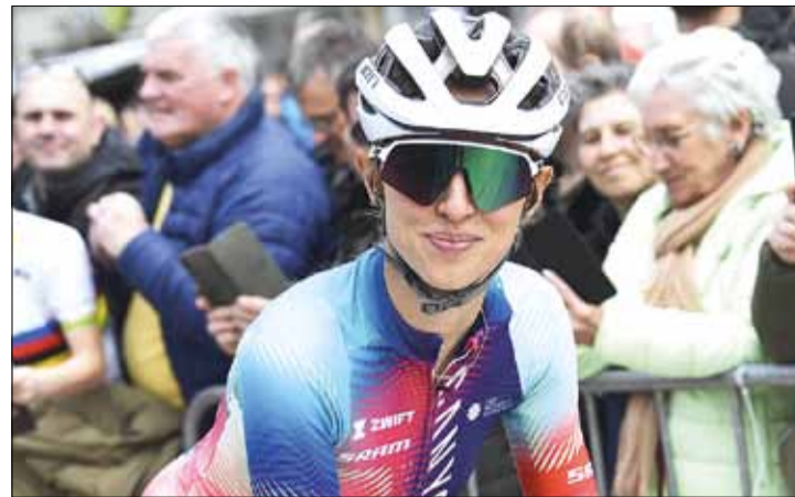
Niewiadoma odniosła największy sukces w historii występów Polek w tym wyścigu

Kilkadziesiąt minut wcześniej w tej samej miejscowości zakończył się