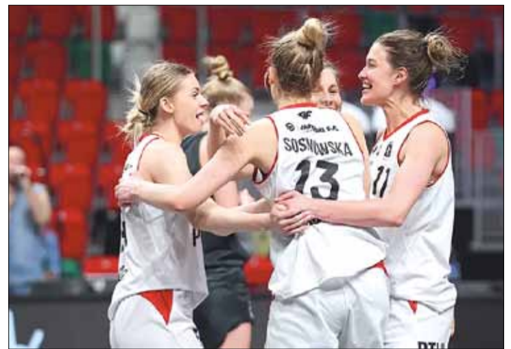
Polskie koszykarki po raz pierwszy zagrały w finale EWBL i za pierwszym podejściem wywalczyły wymarzony puchar

Polonia drugi rok z rzędu była gospodarzem turnieju finałowego. Przed rokiem, gdy impreza była rozgrywana w formule Final Four, zajęła trzecie miejsce, pokonując w meczu o brąz finałowego rywala BK Frankiwnsk 100:53. Trofeum zdobyły zawodniczki czeskiego BK Levharti