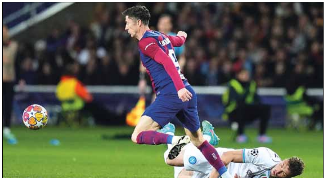
Lewandowski w meczu z Napoli strzelił 94 bramkę w Lidze Mistrzów, a więcej goli w tych rozgrywkach strzelili tylko Ronaldo i Messi

Później długo spotkanie było wyrównane i swoje okazje miały obie strony, ale w 83. minucie to „Duma Katalonii” zadała decydujący cios. Wówczas składną akcję po asyście