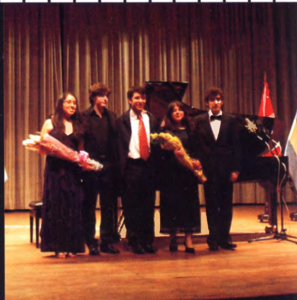
Concierto de Laureados