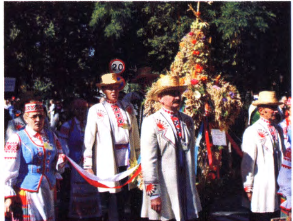
Desfile del año 2010