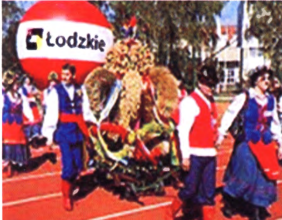
Desfile en el estadio de Spała del año 2009

También la fiesta de la cosecha tiene la parte oficial presidida por el mismo Presidente de Polonia y se realiza en un pueblo llamado Spała. Allí por primera vez en el año 1927 el Presidente Ignacy Mościcki estableció el patrocinio presidencial sobre la fiesta de la cosecha y se realizó allí en Spała, donde se encontraba entonces la sede veraniega de los presidentes. Así continuó todos los años hasta la II Guerra Mundial. Desde entonces recién en el año 2000 el Presidente Aleksander Kwaśniewski ha reactivado esta tradición.