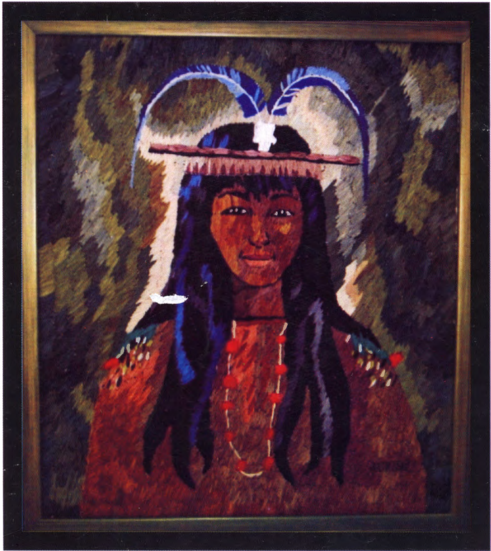
ASHÁNINKA (Bordado con seda natural)