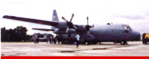
01-08-2011 Godzina W - Lot Pamięci nad Warszawą.

Powstanie Warszawskie wybuchło 1 sierpnia 1944 roku o godzinie 17.00, na rozkaz dowódcy Armii Krajowej gen. Tadeusza Bora-Komorowskiego. W dniu wybuchu powstania SS-Reichsführer Heinrich Himmler, powołując się na dyspozycję Hitlera, wydał rozkaz zniszczenia miasta i wyniszczenia ludności cywilnej Warszawy. Trwało 63 dni.