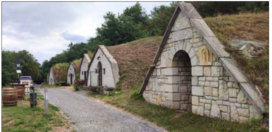
■ Winne piwniczki

Założone w roku 1531. Było jednym z najważniejszych instytucji oświatowych Węgier. Uczył tam przez cztery lata czeski pedagog o postępowym sposobie myślenia Comenius, którego pomnik stanowi wystawa prezentowana w kolegium. Instytucję oświatową nauczającą przez długie stulecia wartości moralne oraz prezentującą wysoki poziom nauczania, zlikwidowano w czasach komunizmu. Po upadku systemu socjalistycznego w roku 1990 wznowiono tam nauczanie w gimnazjum kal-