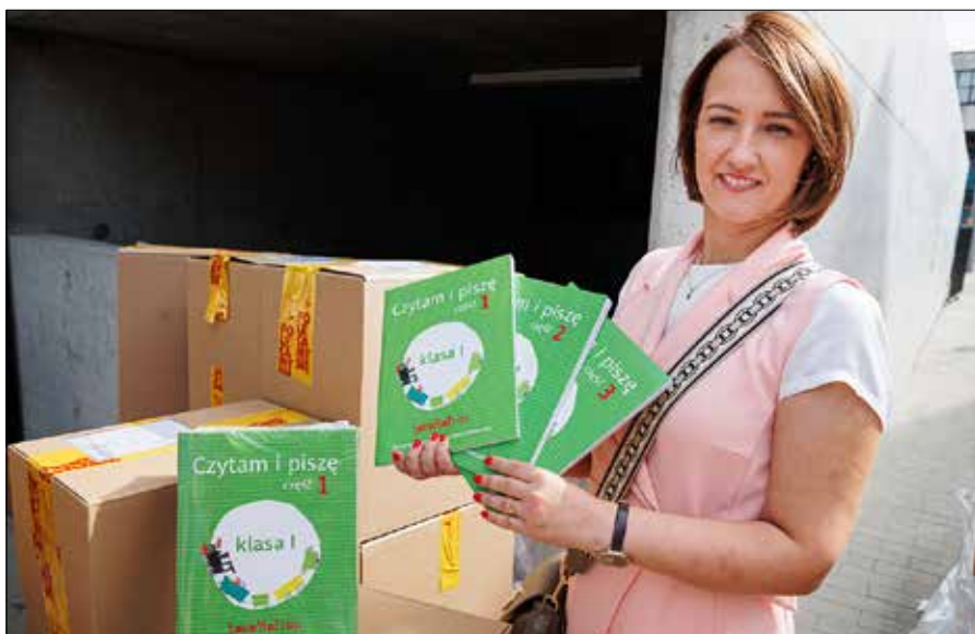
■ We wtorek po południu do DKP w Wilnie dotarły również nowe podręczniki z języka polskiego i literatury oraz zeszyty ćwiczeń

Dzięki wsparciu państwa polskiego oraz zaangażowaniu licznych instytucji, coraz więcej uczniów może liczyć na solidne przygotowanie do