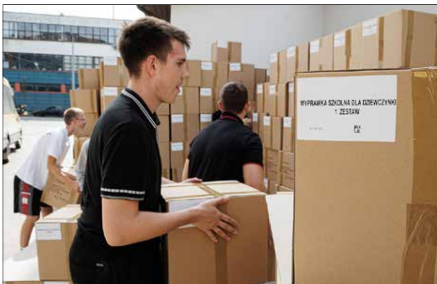
■ Ponad 1 500 pierwszoklasistów z 84 polskich szkół na Litwie, Łotwie, Ukrainie oraz w Czechach otrzyma wyprawki szkolne od państwa polskiego

nowego roku szkolnego w polskich placówkach za granicą. Fundacja „Pomoc Polakom na Wschodzie” od lat angażuje się w działalność wspierającą polską edukację i kulturę na Wschodzie, zapewniając młodemu pokoleniu odpowiednie warunki do nauki.