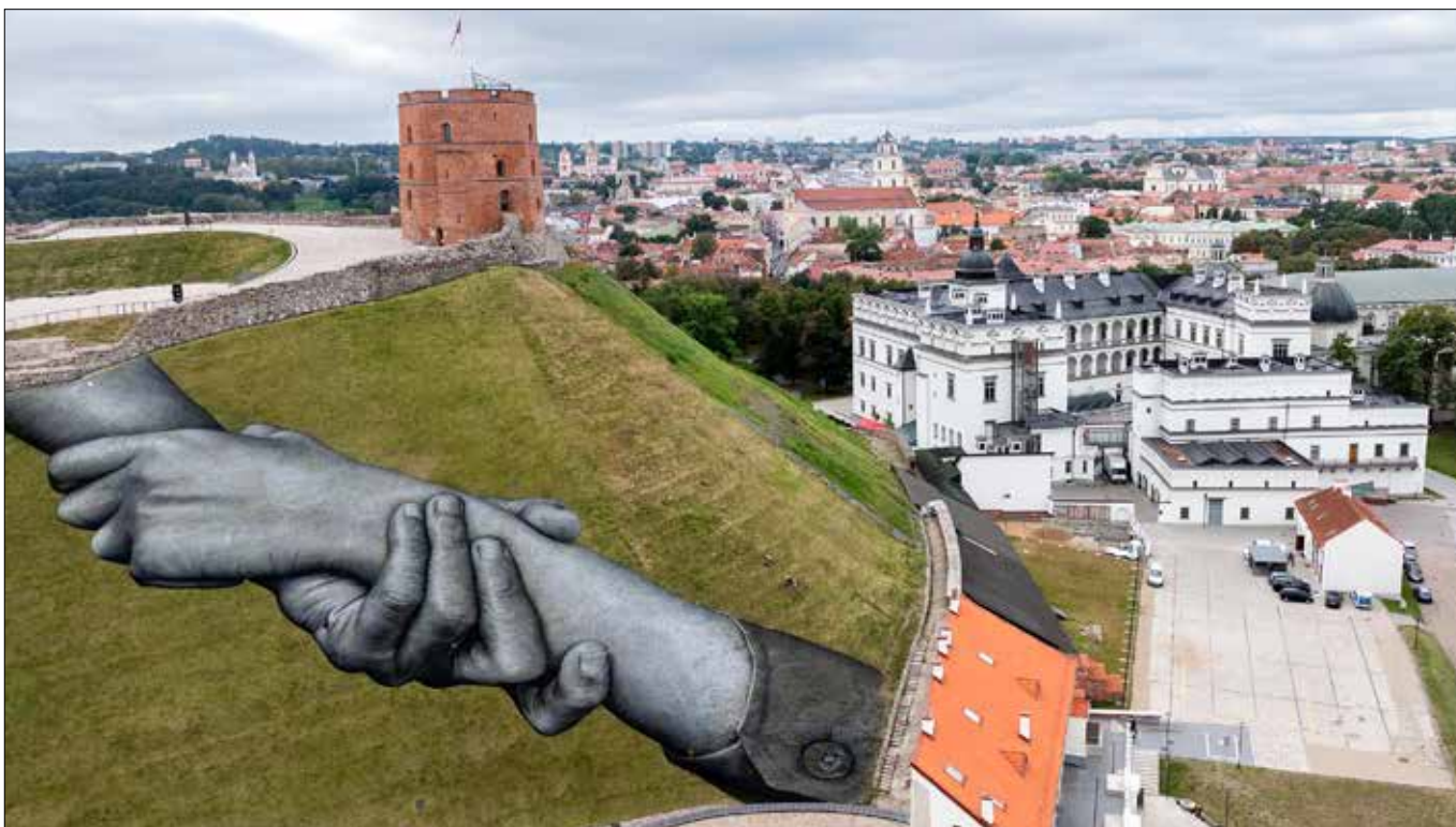
■ Gigantyczny fresk wpływowego francuskiego artysty SAYPE na zboczu Góry Giedymina