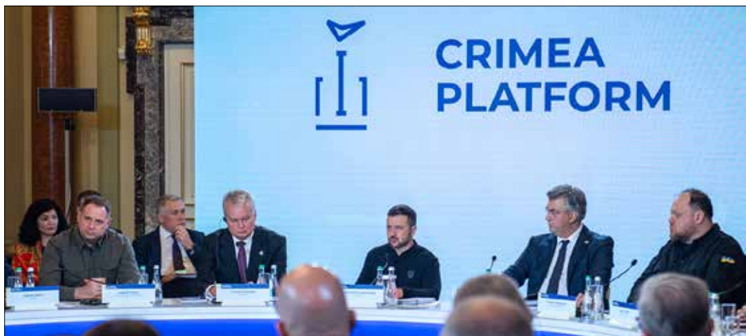
W środę Gitanas Nausėda uczestniczył też w szczycie Międzynarodowej Platformy Krymskiej