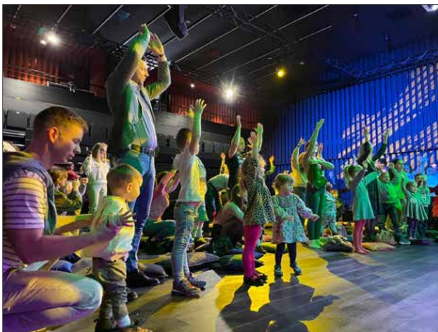
Smykofonia to dla maluchów (0–6 lat) i całych rodzin wyjątkowe koncerty dostarczające niezapomnianych chwil muzycznej rozrywki

Nie przegap tej wyjątkowej okazji, by zanurzyć się w kulturze Dalekiego Wschodu – wesołe, rytmiczne melodie czekają na Was już 15 września w Domu Kultury Polskiej w Wilnie (sala teatralna). Koncert dla melomaluszków od 0 do 6 lat! Bilety w cenie 5 euro do nabycia kakava.lt