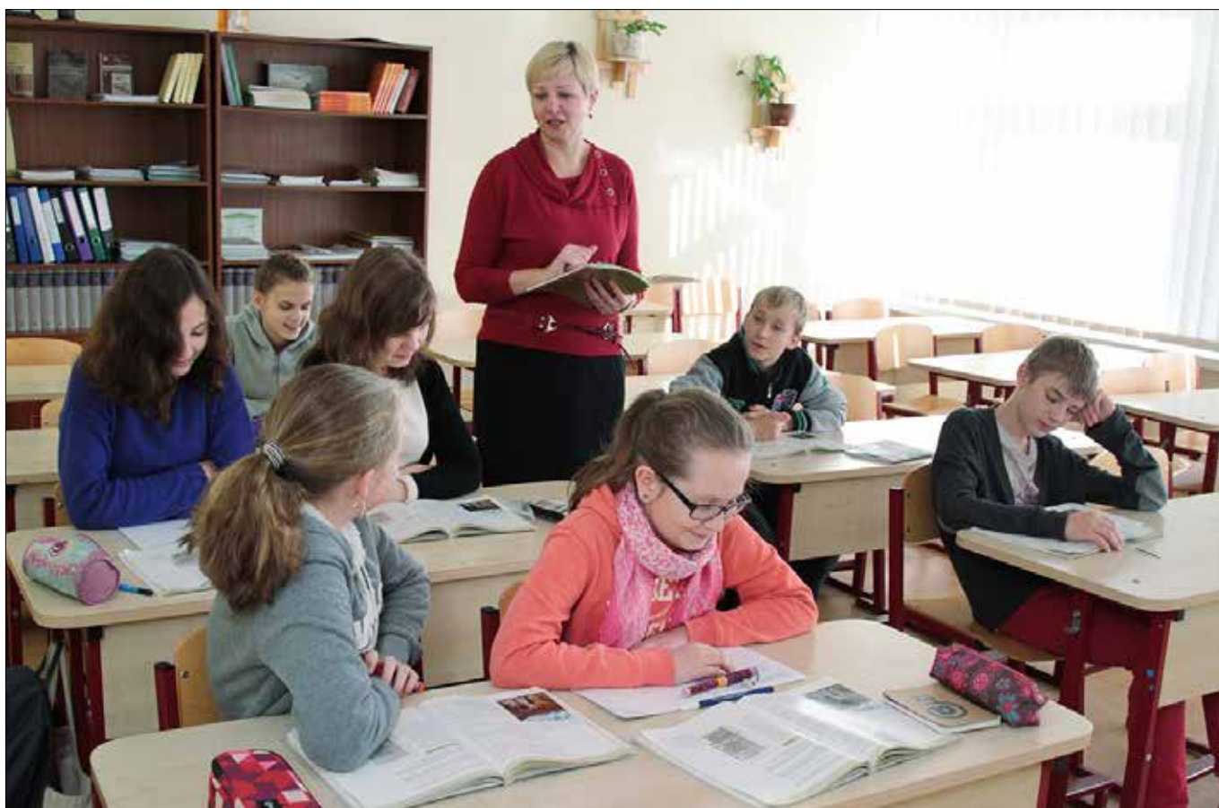
■ Drugi język obcy uczniowie wybierają w klasie szóstej