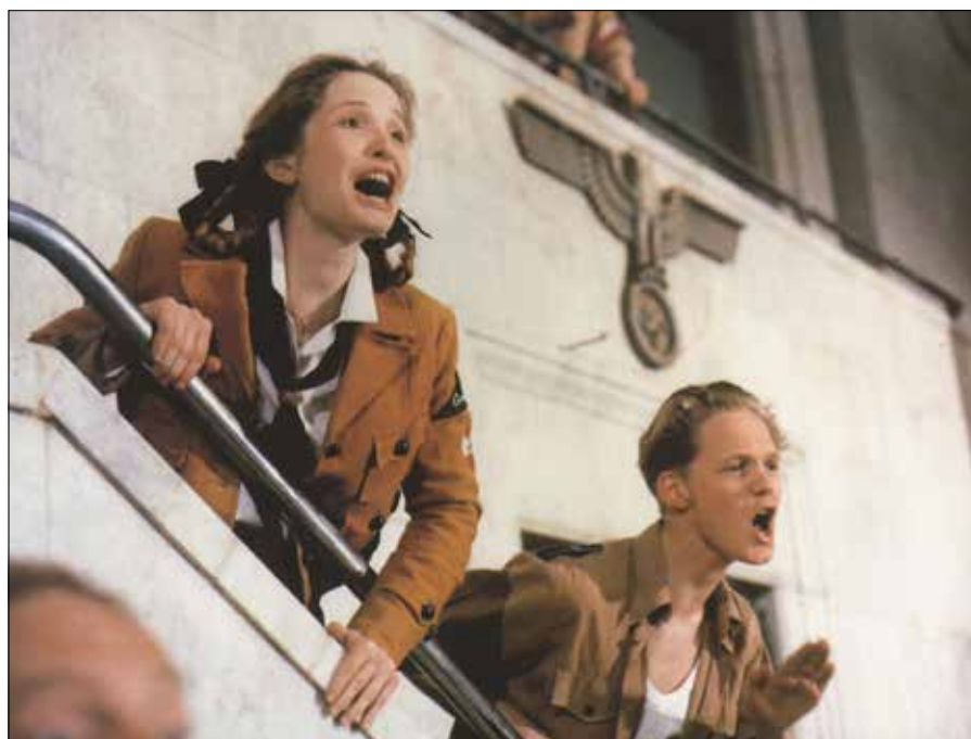
Film Agnieszki Holland „Europa, Europa” zdobył Złoty Glob dla najlepszego filmu zagranicznego