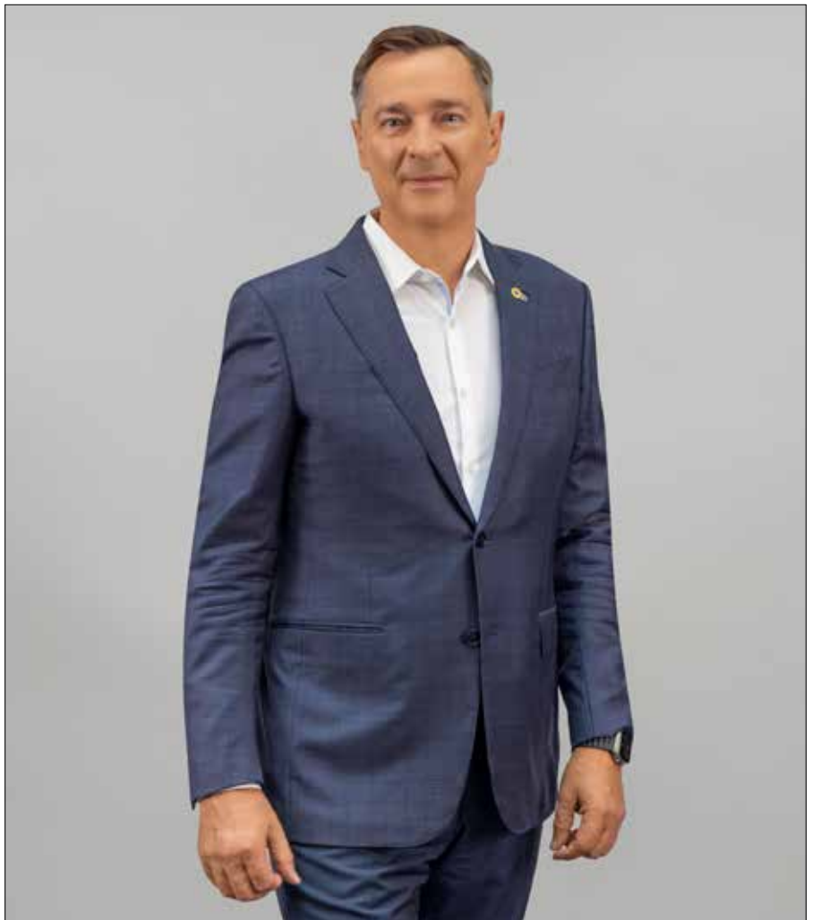
Artūras Zuokas

A.Z. Bardzo się cieszę, że w tak dużej dzielnicy mieszkaniowej powstał nowy kościół. Mam wiel-