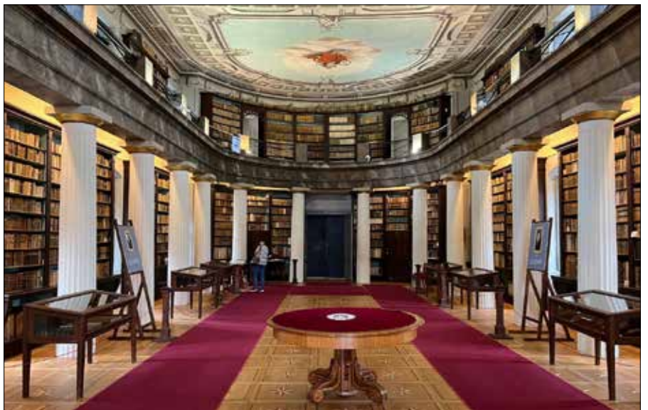
■ Biblioteka Kolegium Kalwińskiego