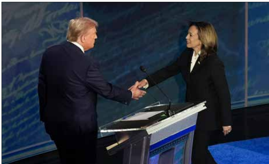
Debata rozpoczęła się od uścisku dłoni, ale później doszło do ostrej wymiany zdań

Omawiając kwestie polityki zagranicznej kandydaci poruszyli temat wojny w Ukrainie. Harris oświadczyła, że gdyby Trump nadal piastował urząd prezydenta, to Putin byłby w Kijowie. „Zrozumcie, dlaczego europejscy sojusznicy i nasi sojusznicy z NATO są tak wdzięczni, że nie jesteś już prezydentem i że my rozumiemy znaczenie największego sojuszu wojskowego, jaki świat kiedykolwiek znał, jakim jest NATO” — mówiła kandydatka. Oświadczyła, że kontrkandydat nie tylko oddałby Ukrainę Rosji, ale również Polskę. Tu nieoczekiwanie wyskoczył temat Polonii amerykańskiej. „Dlaczego nie powiesz 800 tys. Amerykanom polskiego pochodzenia tu w Pensylwanii, jak szybko byś oddał Polskę za przysługę i za to, co myślisz, że jest przyjaźnią z dyktatorem, który zjadłby cię na obiad” — zarzuciła Harris.