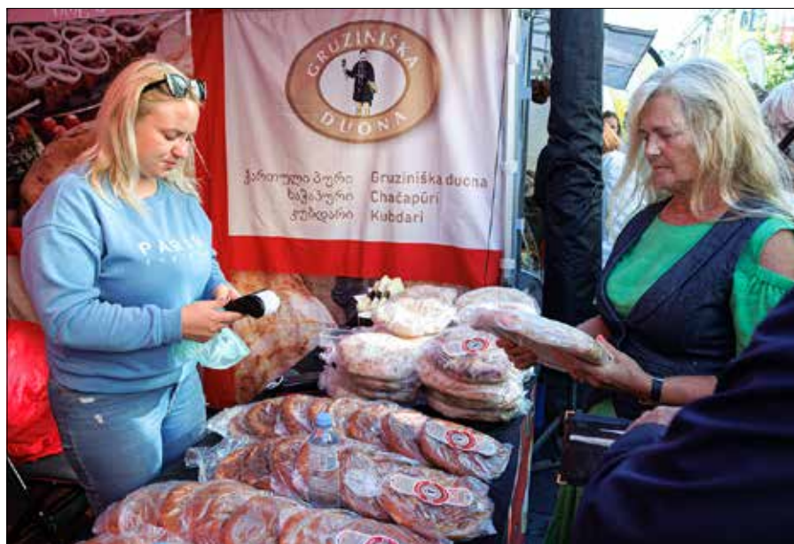
Jarmark Narodów co roku przyciąga około 250 tys. wilan i odwiedzających miasto turystów

Jarmark Narodów jest świetną okazją do zapoznania się przede wszystkim z kulturami wspólnot narodowych. W imprezie tradycyjnie uczestniczą rzemieślnicy ludowi, mistrzowie kuchni, tańca i śpiewu.