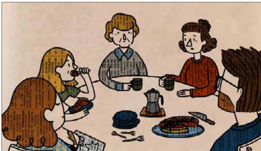
■ Kadr z krótkiego filmu animowanego Heleny Stańczyk

„Brak” — reżyseria: Paweł Prewencki. Głęboko poruszający film, opowiadający o emocjonalnej walce rodziców po stracie dziecka. „Brak” jest intymnym obrazem żalu, samotności i trudnej drogi do uzdrowienia, ukazującym