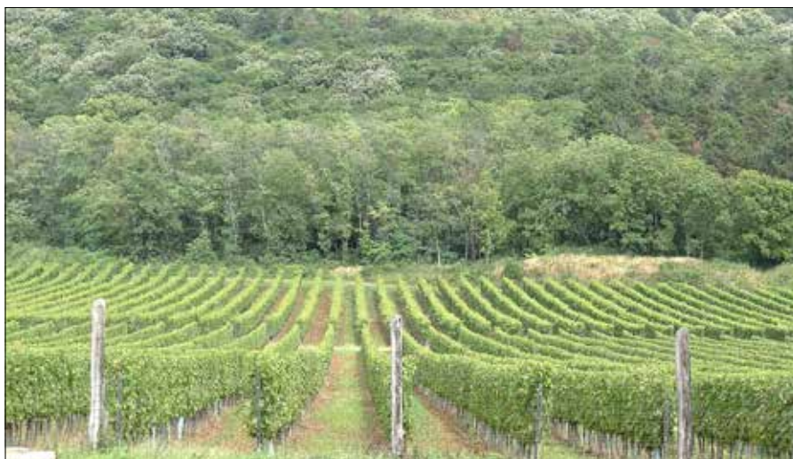
Ten najbardziej na południe Węgier wysunięty region winiarski jest ojczyzną najlepszych czerwonych win węgierskich

Villány to pasmo niskich gór i region obfitujący w liczne winnice. Ten najbardziej na południe Węgier wysunięty region winiarski jest ojczyzną najlepszych czerwonych win węgierskich.