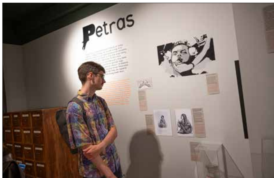
Dyskusja na temat problemów zdrowia psychicznego odbędzie się w przestrzeni, w której czynna jest wystawa „Nepatogus Vilnius”

Spotkanie w Muzeum Wilna (ul. Vokiečių 6) odbędzie się już dziś, 10 września, o godz. 17.00. Uczestnicy będą mieli okazję obejrzeć wystawę „Nepatogus Vilnius” oraz podyskutować z ambasadorami zdrowia psychicznego. Będą oni w koszulkach z napisem „Žvelk giliau”. ■