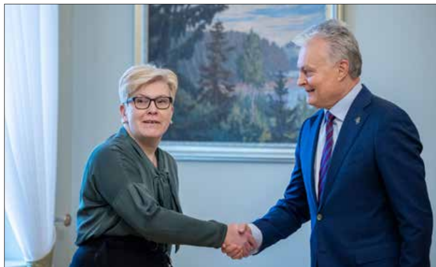
Na czele rankingu stanęli prezydent Gitanas Nausėda oraz premier Ingrida Šimonytė.

das Adamkus znalazł się na miejscu trzecim. Widzimy, że zarówno na liście eksperckiej oraz mieszkańców Adamkus i Landsbergis znajdują się w czołówce najbardziej wpływowych polityków państwa.