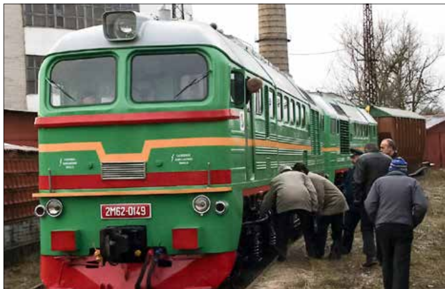
„Lokomotywa wyborcza” już zaraz buchnie parą i popędzi w stronę stacji Seimo rinkimai 2024

Demokraci — „Vardan Lietuvos” prowadzeni przez Sauliusa Skvernelisa, mają 220 271,63 euro. Tu jest odwrotnie — partia przeznaczyła tylko 39 010 euro, od osób