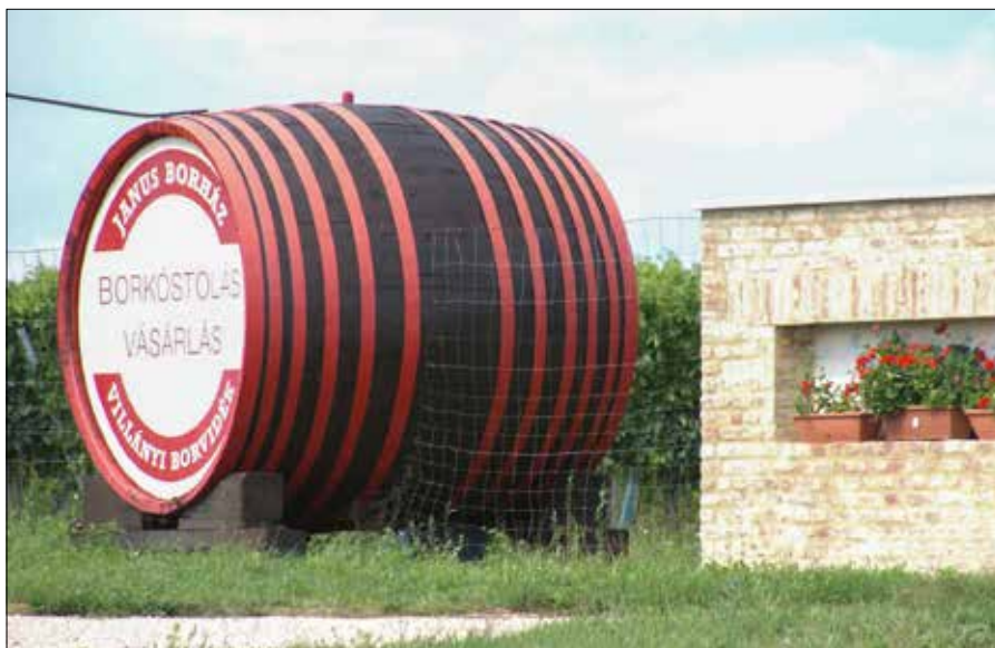
Jedna z tamtejszych winnic

więc nie dziwą często tam spotykane nazwiska takie jak: Bock, Gere, Mayer, Neuperger czy Wunderlich.