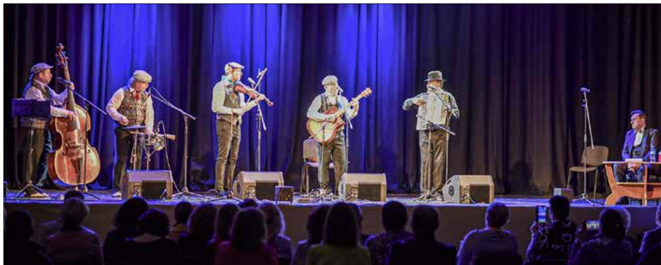
Oprócz prezentacji twórczości, wystąpi też Kapela Wileńska