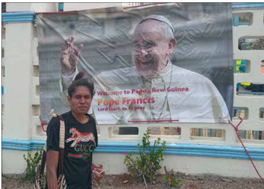
Port Moresby, stolica Papui-Nowej Gwinei, czeka na papieża Franciszka