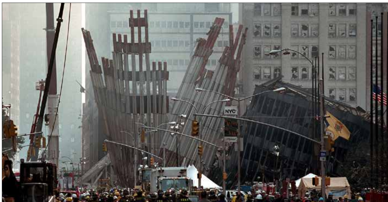
■ Atak na WTC z 11 września 2001 r. był szokiem dla świata