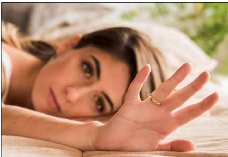
■ Złota biżuteria może być cenna, ale nie jest inwestycją

Dzisiejszy skok cen złota związany jest przede wszystkim ze wzrostem zagrożeń geopolitycznych oraz pogarszającą się sytuacją na dwóch frontach — zarówno na Ukrainie, jak i w Izraelu. Napięcia rosną także w regionie Chin, gdzie Bank Ludowy Chin kupuje fizyczne złoto już 16 miesięcy z rzędu. Od początku 2024 r. rezerwy złota Chin wzrosły o 12 ton, Kazachstanu i Indii — po 6 ton, a Singapuru, Czech i Kataru — po 2 tony. Rezerwy złota Litewskiego Banku wynoszą 6 ton, które kraj otrzymał po odzyskaniu niepodległości.