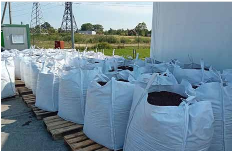
Wysokiej jakości kompost z odpadów zielonych jest dostępny w punktach zbiórki odpadów zielonych

Kompostowanie to najwygodniejszy i najbardziej praktyczny sposób pozbywania się odpadów zielonych. Kompostowanie jest możliwe nie tylko w ogrodzie, ale także w mieście lub w mieszkaniu,