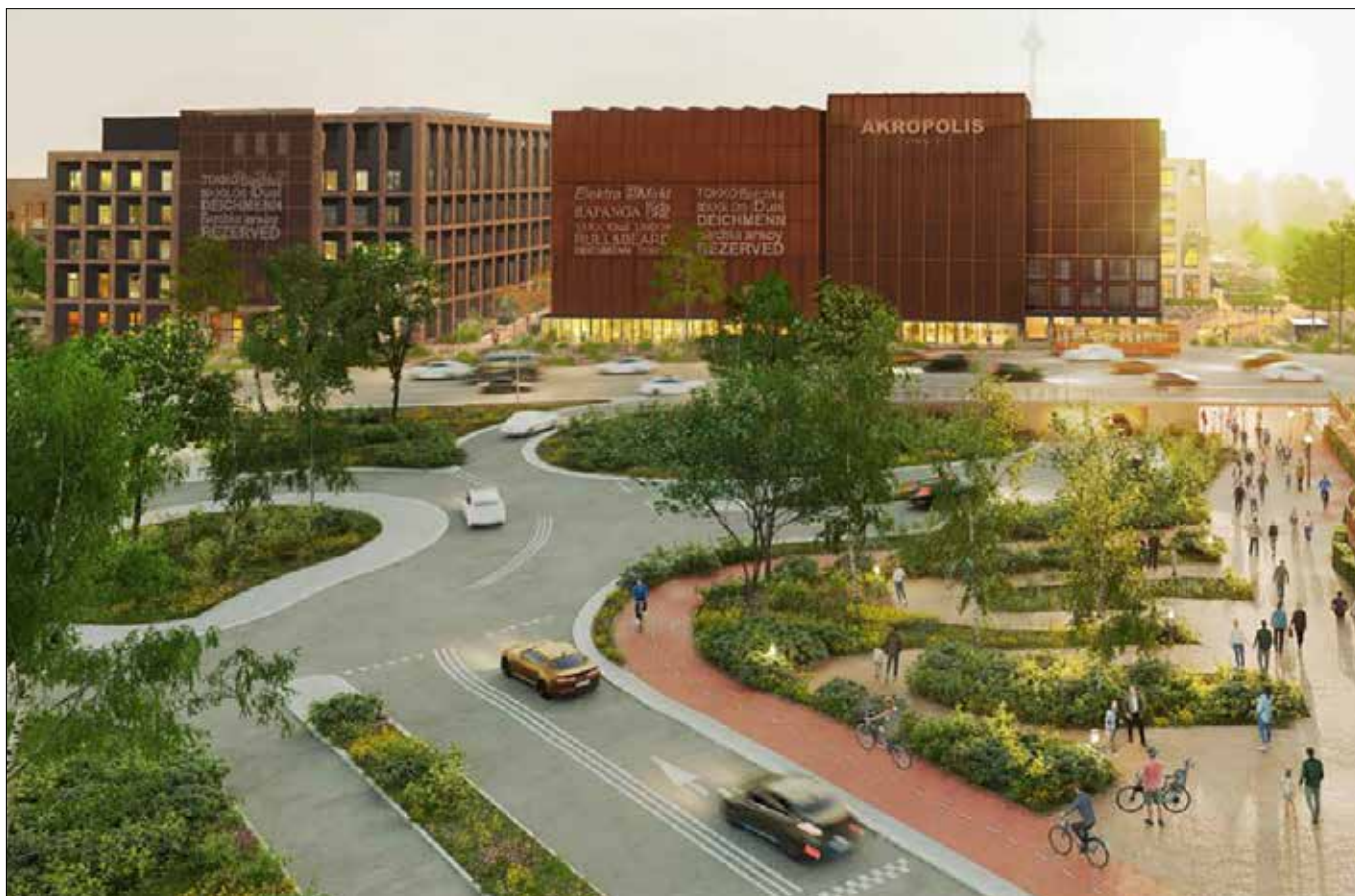
Projekt Akropolis Vingis przewiduje wybudowanie nowoczesnej dzielnicy z wewnętrznymi ulicami