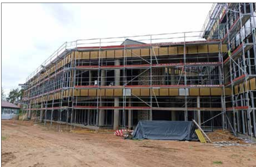
Prace budowlane w Gimnazjum im. Konstantego Parczewskiego w Niemenczynie