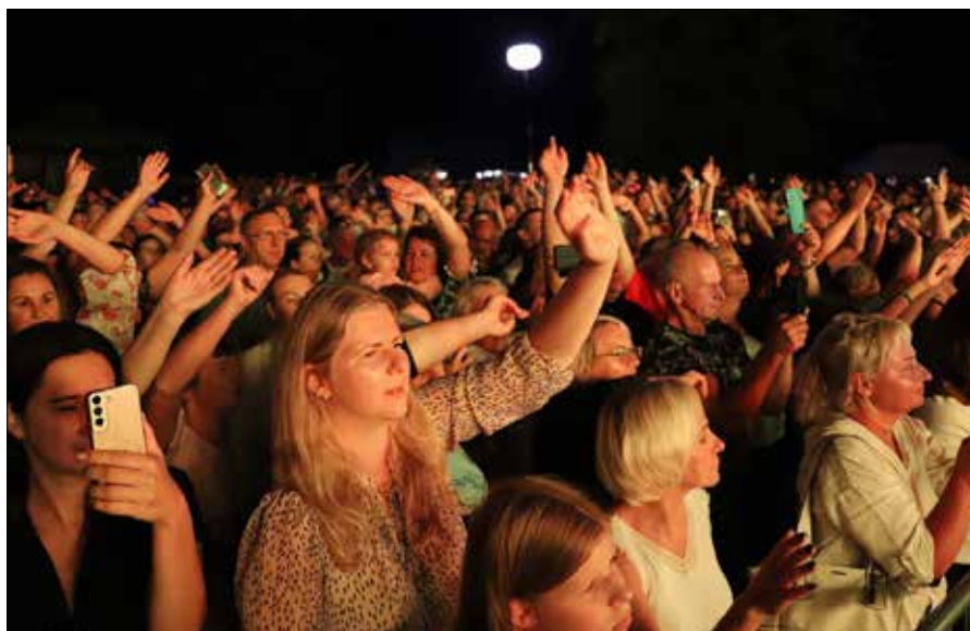
O tym, że wydarzenie było udane, świadczą najlepiej tłumy gości, którzy bawili się do późnych godzin nocnych