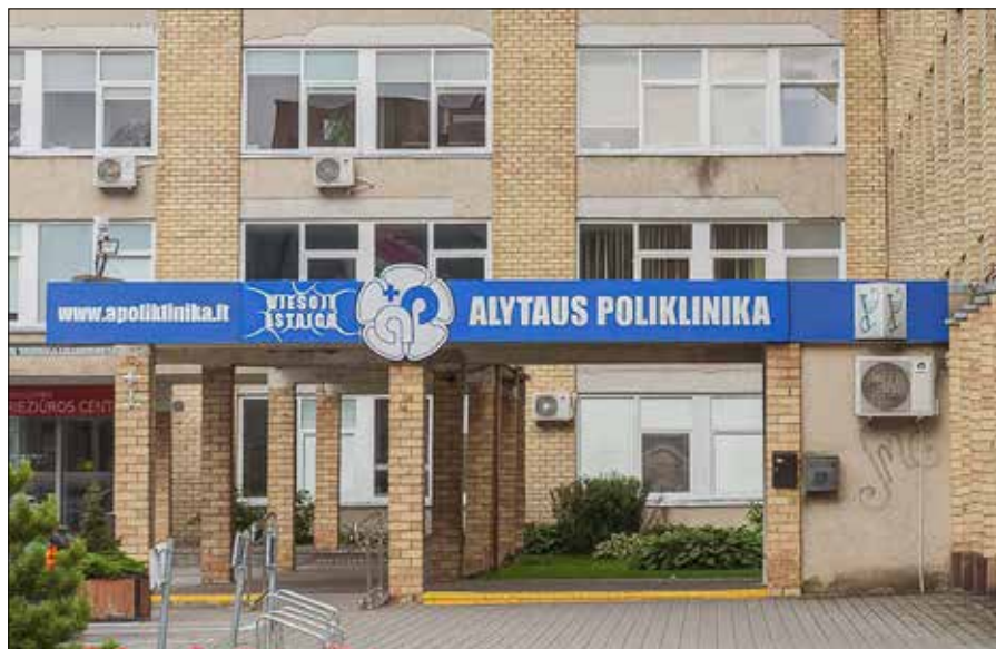
Lekarze otrzymają 30 tys. euro wsparcia, jeśli podpiszą umowę na 4 lata

Roczna dotacja, która odpowiada rocznemu kosztowi rezydentury ustalonemu przez uniwersytety, może być przyznana przez samorząd miasta Olity niezależ-