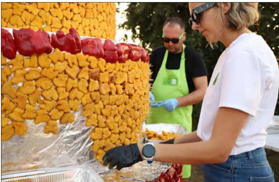
Ważna jest nie tylko zabawa, ale też dobrze przekąski!

Centrum Kultury w Rudominie ma już bardzo duże doświadczenie w organizowaniu imprez masowych. Lokalna infrastruktura nie jest co prawda pod tym względem idealna, ale zainteresowanie odbiorców pokazuje, że trzeba w tym kierunku pracować.