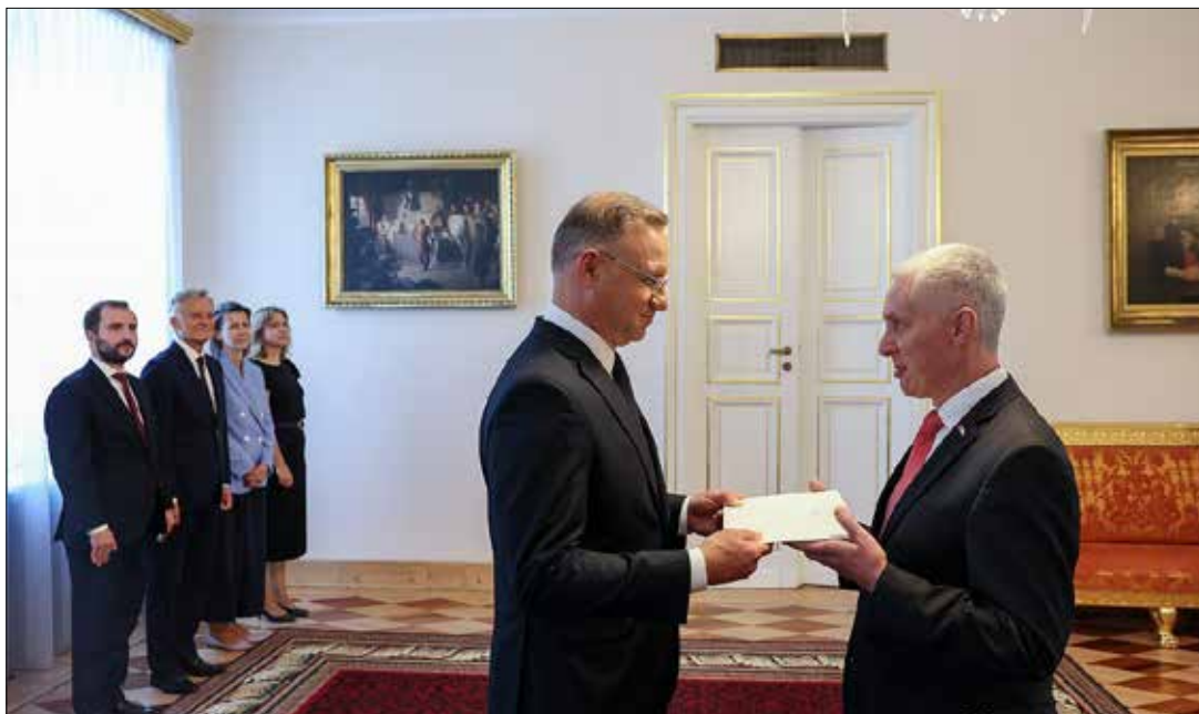
Nowy ambasador rozpoczyna misję w Warszawie. W Belwederze Prezydent RP Andrzej Duda przyjął listy uwierzytelniające od Ambasadora RL Valdemarasa Sarapinas