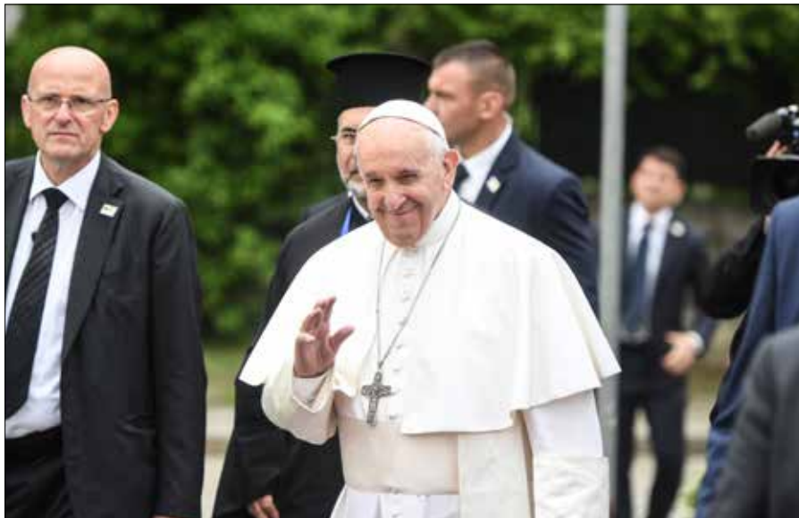
Od 2013 r. Franciszek jak dotychczas odwiedził w sumie 60 krajów na całym świecie

Prawie połowa wyjazdów zagranicznych miała miejsce w Europie. Celem nie były jednak takie kraje jak Niemcy, Francja czy Hiszpania. W 2016 r. Franciszek odwiedził Polskę, złożył też wizyty w Strasburgu w Alzacji, gdzie wygłosił dwa przemówienia: do Parlamentu Europejskiego i Rady Europy oraz odwiedził francuską metropolię śródziemnomorską — Marsylię. Natomiast europejskie drogi prowadziły Franciszka do mniejszych