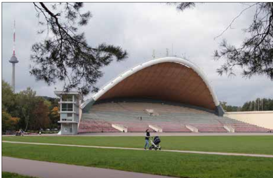
■ Nowa dzielnica powstanie w pobliżu parku Zakret

Nowa dzielnica powstanie w pobliżu parku Zakret, na terenie dawnej dzielnicy przemysłowej Wilcza Łąpa (Vilkpėdė). Położo-