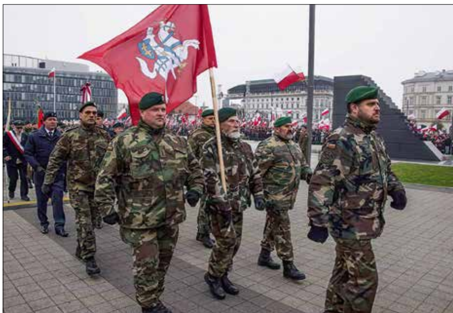
„Razem uczestniczymy w obchodach świąt pod Grunwaldem czy w rocznicach powstania styczniowego” — dzieli się nasz rozmówca