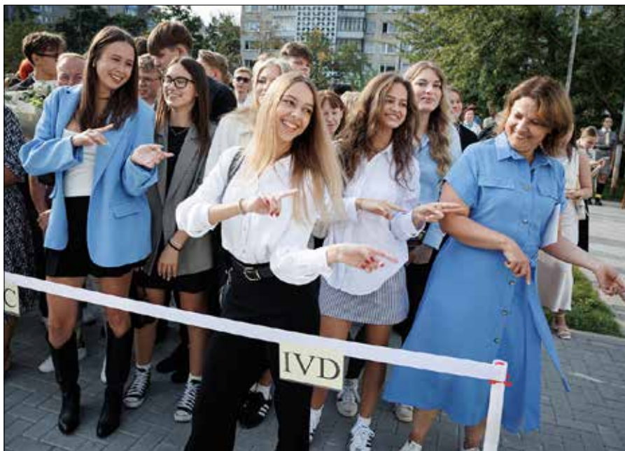
112 – tylu maturzystów w tym roku rozpoczęło swój ostatni rok nauki w gimnazjum

— Będziemy próbowali naukę pogodzić z tym, co teraz ta dziewczyna ma wytrzymać, ponieważ ma bardzo dużo zawodów. Teraz