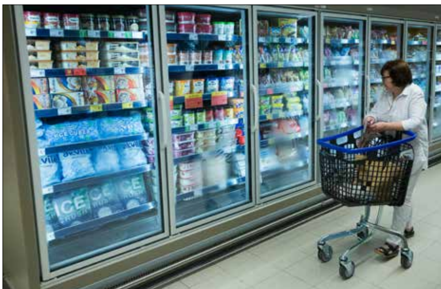
W porównaniu z sierpniem 2021 r. koszyczek towarów popularnych i znanych marek w minionym miesiącu zdrożał o 17,67 euro

tańsze (o ponad 10 proc.): najtańsza herbata czarna sypana, najtańsza polędwica wędzona na gorąco, olej słonecznikowy, najtańszy jogurt, najtańsza wódka, cukier Panevėžio Plus, najtańsza kawa palona mielona, makaron Pasaka, najtańszy ser fermentowany, najtańsza śmietana 30 proc., mielona wieprzowina. ■