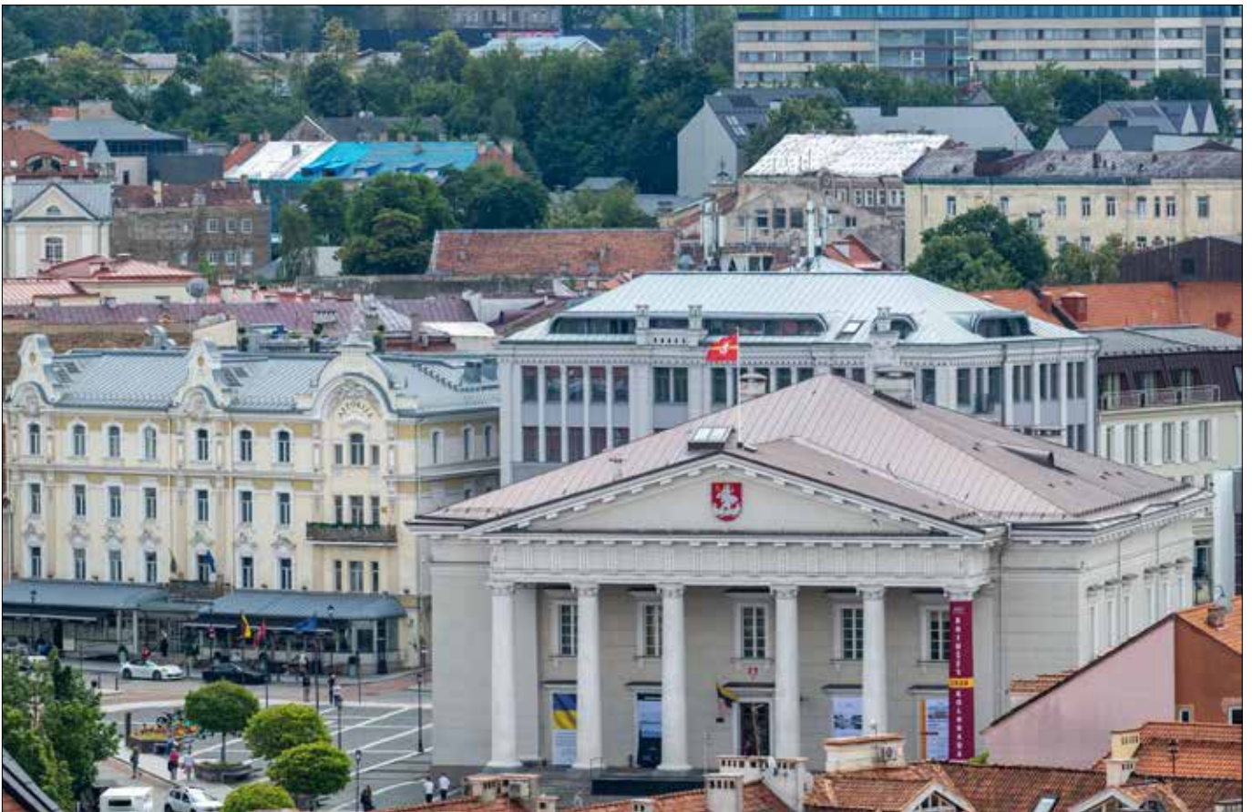
W 2025 r. ruszy remont klasycystycznej budowli