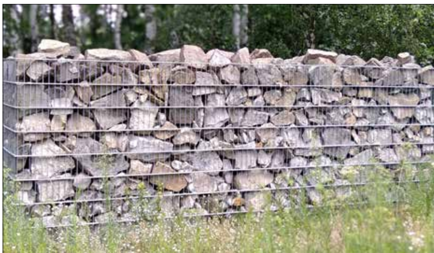
■ Aktualnie na cmentarzu znajduje się ponad 40 tys. kamieni nagrobkowych