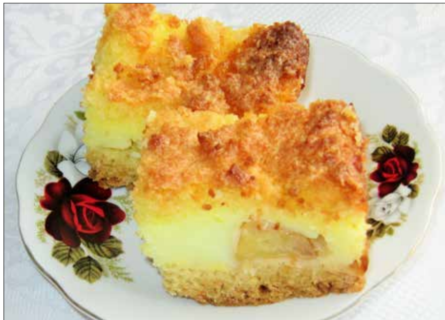
■ Fot. autorka

Mąkę przesiać, dodać cukier, proszek do pieczenia i wymieszać, a następnie posiekać z masłem, dodać jajka i zagnieść dłońmi kruche ciasto. Ciasto rozłożyć na wysmarowaną tłuszczem fo-