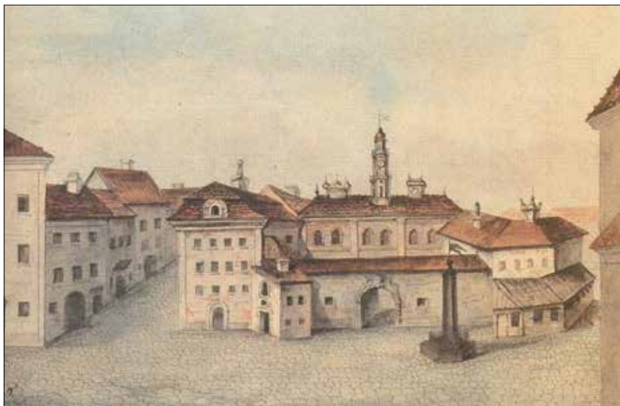
Pierwsza źródłowa wzmianka o Ratuszu, który pierwotnie był siedzibą władz miejskich pochodzi z 1432 r.