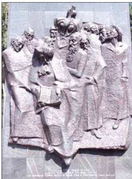
■ Historia Żydów praskich na bramie wejściowej

jest symboliczne zasypanie trumny ziemią przez najbliższych, którzy przekazują łopatkę kolejnej osobie poprzez wbicie jej w ziemię. Odmawiane są również modlitwy, takie jak: El male rachamim i Kadisz, do czego potrzebny jest minian, czyli 10 dorosłych Żydów. Kadisz powinien być odmówiony przez męskiego potomka lub najbliższego członka rodziny. Zwyczaj ceremonii pogrzebowej jest prowadzona przez rabina, natomiast rodzina i najbliżsi mogą wygłosić mowy pochwalne i pożegnalne.