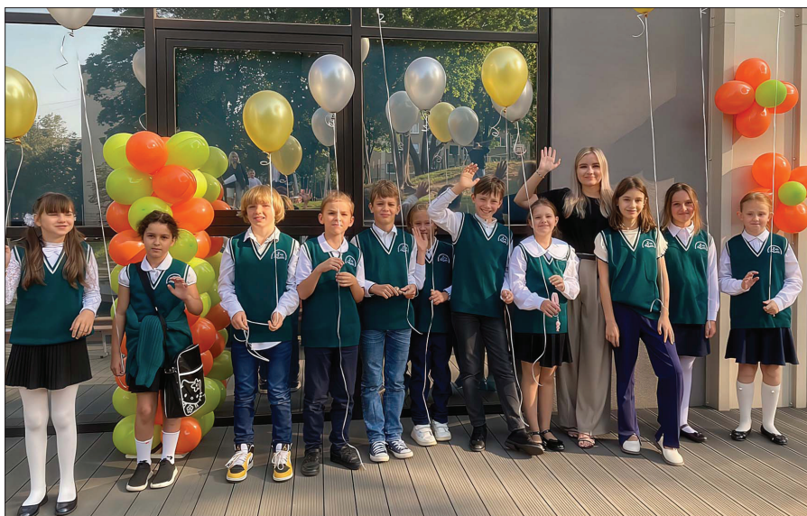
W gmachu przy ul. Šilo 15 uczą się uczniowie klas 1-4 oraz klas wychowania wczesnoszkolnego

— W tym roku startuje nauczanie łączone. Dla nas to nie jest nowością, bo taki system nauczania praktykowaliśmy wcześniej. Nie będzie już pomocnika nauczyciela, ale pojawi się stanowisko pomocnika ucznia. Są uczniowie, którzy potrzebują po-