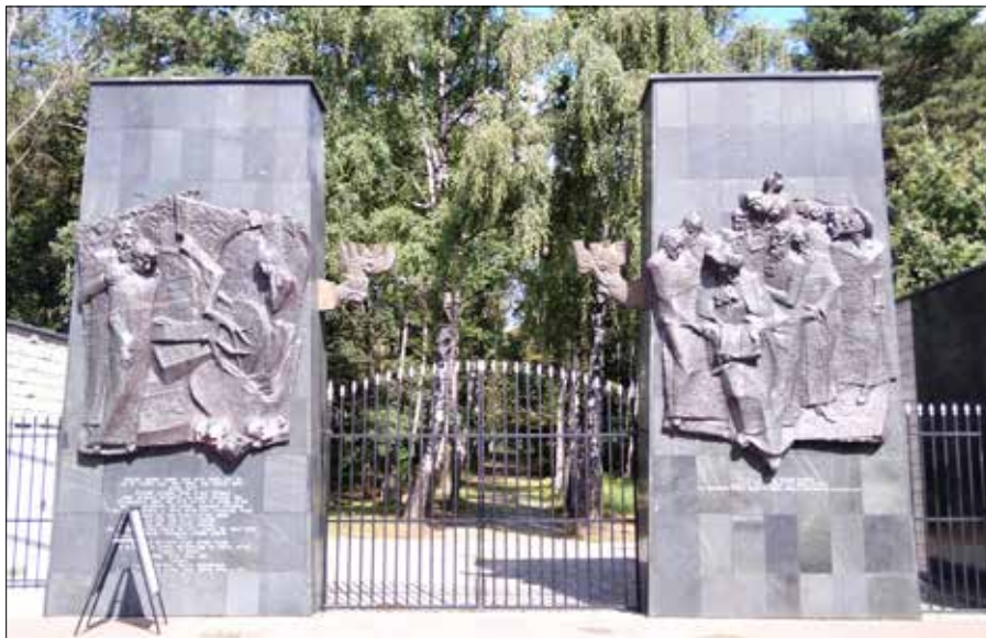
■ Cmentarz żydowski na warszawskim Bródnie. Brama wejściowa

Dziś jednak pozwala się na minimalne opóźnienie pochówku konieczne ze względu na formalności i potrzeby żałobników. Najważniejsze elementy pogrzebu to odprowadzenie zmarłego do grobu przez najbliższych, a następnie włożenie skromnej drewnianej trumny z ciałem zmarłego do wykopanego najlepiej tego samego dnia grobu. W trumnie nie umieszcza się żadnych przedmiotów, natomiast w miarę możliwości wsypuje się do niej garść ziemi z Izraela. Komora grobu jest pozioma i najczęściej orientowana stopami zmarłego w symbolicznym kierunku na Jerozolimę. Ważnym zwyczajem mającym na celu pożegnanie zmarłego i pogodzenie się z jego śmiercią