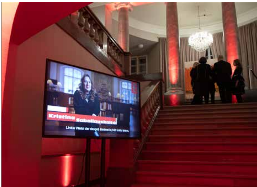
W Ratuszu odbywają się tu oficjalne uroczystości państwowe, koncerty, wystawy, konferencje, wycieczki, zawierane są śluby cywilne