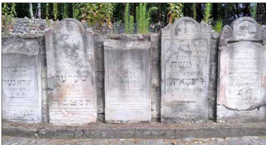
■ Uporządkowane macewy