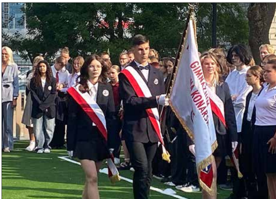
Uroczysty apel w Gimnazjum im. Szymona Konarskiego odbył się na nowym boisku