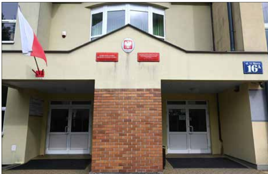
Wejście do Liceum Ogólnokształcącego z Litewskim Językiem Nauczania im. 11 Marca w Puńsku (ul. 11 Marca 16a)

Dzieci w wieku szkolnym zawsze pociągał sport. Biegały, rzucały wólczynią, pchały piłkę i uprawiały inne sporty. Okazało się jednak, że to koszykówka jest naszym sportem narodowym. W tym i zeszłym roku nasz zespół zajął pierwsze miejsce w województwie podlaskim. A w ubiegłym roku zdo-