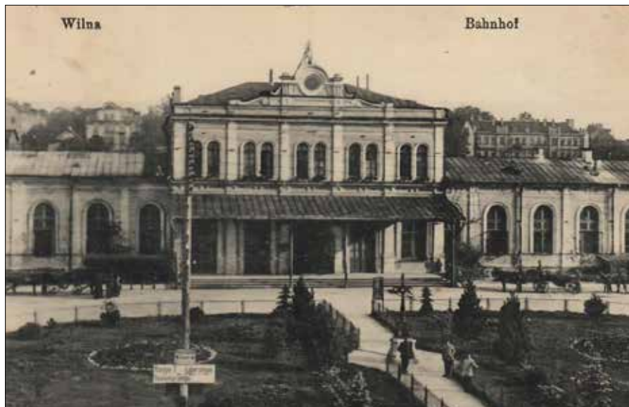
Sady Strumiłły rozciągały się aż do dworca kolejowego. Dworzec kolejowy w Wilnie w 1918 r.

Niezagospodarowany obszar położony między ulicami V. Šopeno, Šv. Stepono i Sodų zostanie uporządkowany i zazieleniony. Planuje się tu odtworzyć słynne sady Strumiłły.