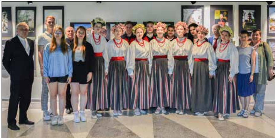
Uroczystość otwarcia wystawy rozpoczęła się występem Reprezentacyjnego Polskiego Zespołu Pieśni Tańca „Wileńszczyzna” im. Gabriela Jana Mincewicza

Wilno i Wileńszczyzna są nazywane krainą kościołów. Te najtrwalsze zabytki kryją w sobie całą paletę stylów architektonicznych, mówią o ludziach, o ich losach, pracach. Są świadkami wiary, tradycji i historii. Wystawa „Sakralne dziedzictwo Wilna i Wileńszczyzny” składa się z oryginalnych i unikatowych fotografii dokumentujących życie wileńskich i podwileńskich kościołów. Wśród zdjęć świątyń zobaczyć