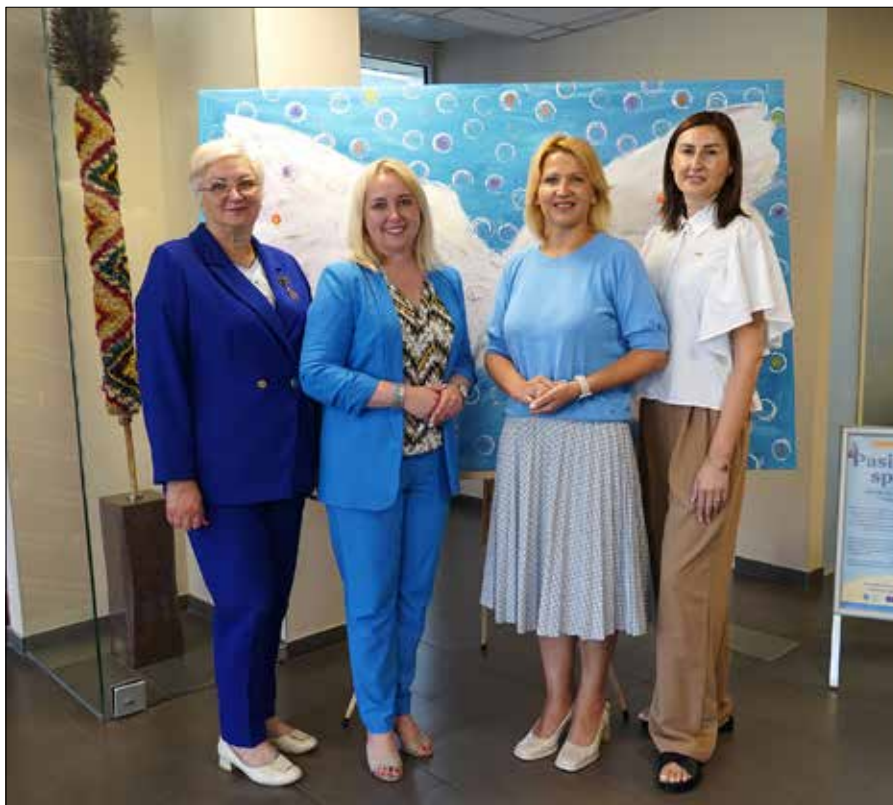
W samorządzie rejonu wileńskiego odbyła się akcja poświęcona rodzinom zastępczym.

Bezpieczne środowisko zapewnia stabilność, która pomaga nie bać się podejmować decyzji, stawiać czoła wyzwaniom życia i pomaga być gotowym na nieznane zwroty losu, ponieważ w pobliżu zawsze są ludzie, którzy w razie potrzeby podają pomocną dłoń. ■