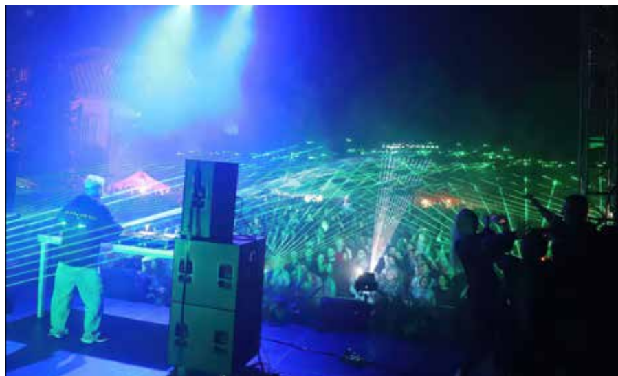
Jedną z większych atrakcji był pokaz laserowy połączony z oprawą muzyczną realizowaną przez DJ Jovaniego

Jedną z większych atrakcji, jakie przygotowało Centrum Kultury w Rudominie, był pokaz laserowy połączo-