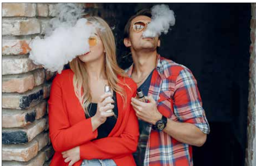
W latach 2025-2027 akcyza na płyn do e-papierosów co roku będzie rosła o 150 proc.