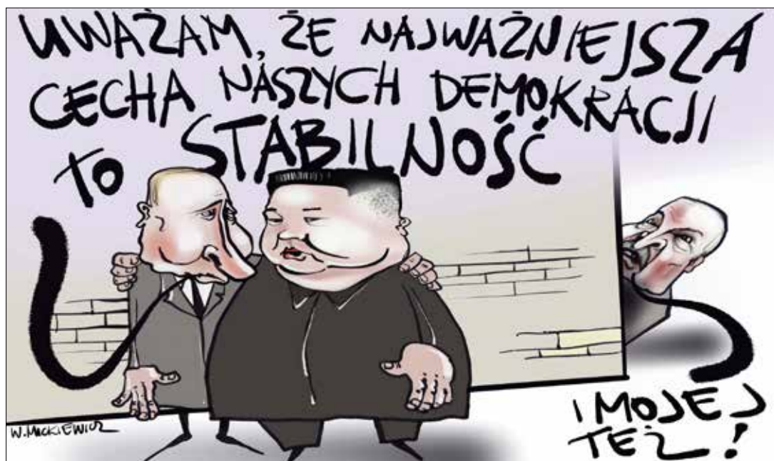
■ Rys. Władysław Mickiewicz