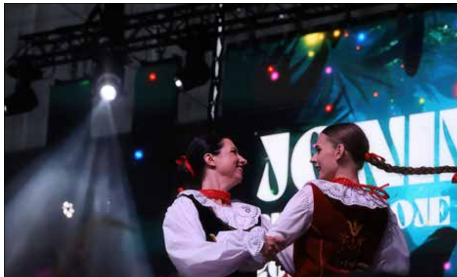
Podczas „szukania kwiatu paproci” dobry nastrój widzom zapewniały skoczne tańce ludowe

ny z oprawą muzyczną realizowaną przez znanego doskonale na Litwie DJ Jovaniego. Na najbardziej wytrzymałych czekała dyskoteka, a wspaniałą muzyczną atmosferę zapewnił zespół „Deja Vu”.