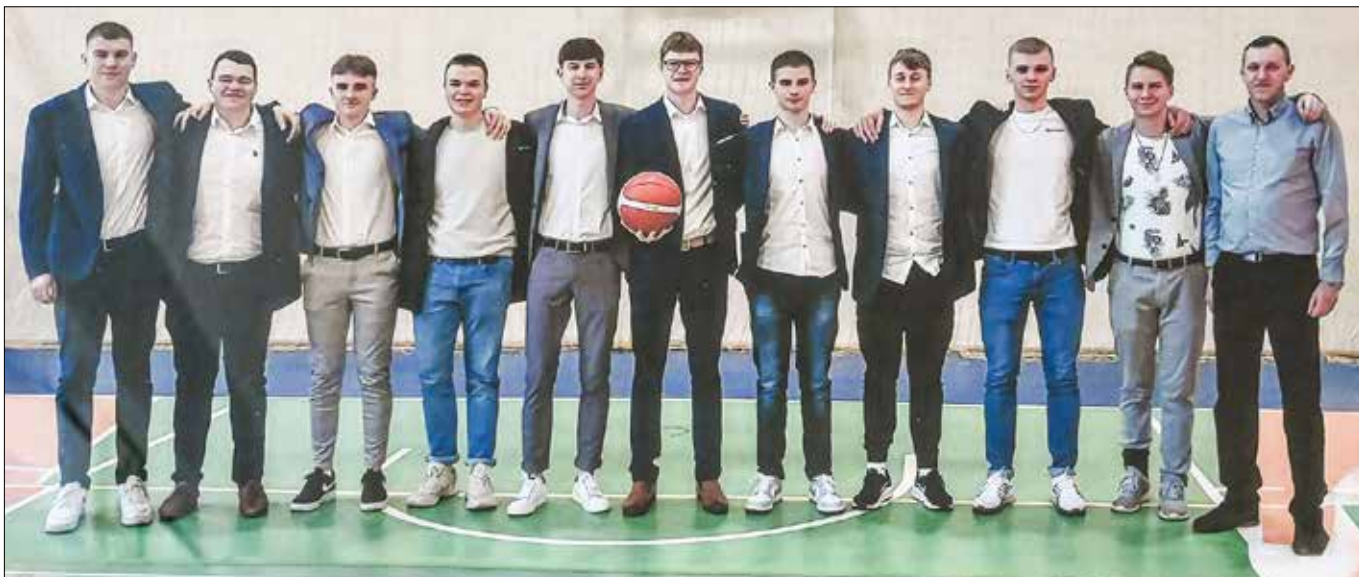
■ Drużyna koszykarska liceum (mistrzostwa 2022/2023)