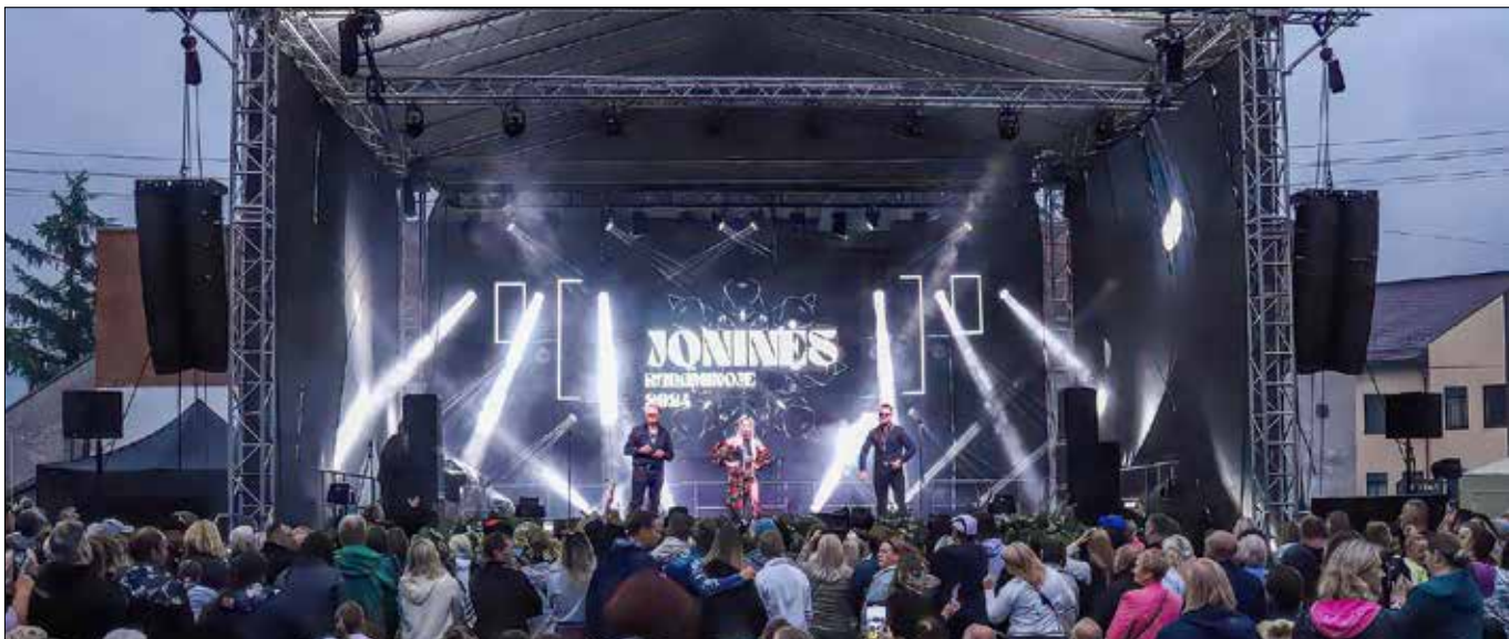
■ Szacuje się, że udział w obchodach Nocy Świętojańskiej w Rudominie mogło wziąć nawet 10 tys. osób