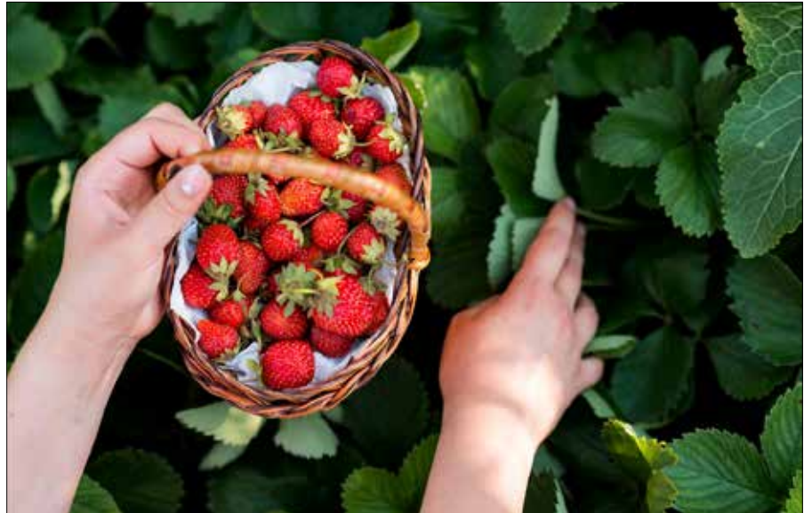
■ W drugiej połowie lipca kończymy zbioru truskawek

U maliny, po zebraniu owoców, wycinamy pędy, które już owocowały. Pędy tegoroczne warto natomiast