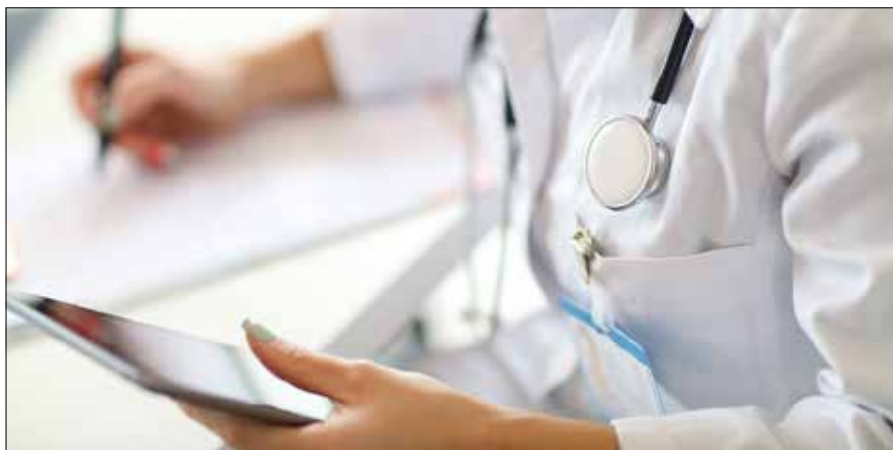
■ Ambulatorium w Mickunach uzupełniło szeregi

Strony przygotowano na podstawie informacji Samorządu Rejonu Wileńskiego