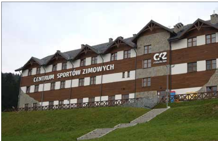
Centrum Sportów Zimowych w Ptaszkowej