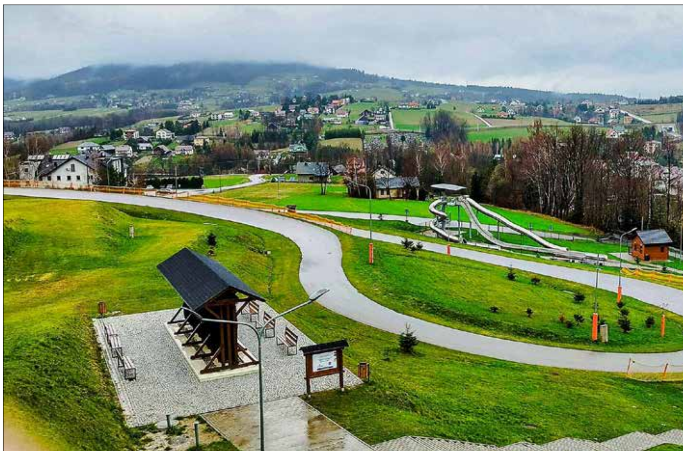
■ Na chwilę obecną ośrodek liczy 2,5 km utwardzonych i sztucznie naśnieżanych tras, które posiadają homologację FIS