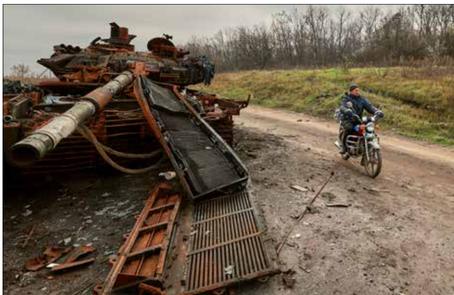
30 tys. osób miesięcznie - taka liczba ochotników i pracowników kontraktowych jest potrzebna rosyjskiemu wojsku do uzupełnienia strat w Ukrainie

I chociaż regiony średnio czterokrotnie zwiększyły jednorazowe premie dla rekrutów, a w 15 podmiotach przekraczają one 1 mln rubli (9800 euro), plan dla pracowników kontraktowych jest o ok. jedną trzecią niższy od celu. Może to popchnąć Kreml w kierunku nowej masowej mobilizacji już w tym roku.