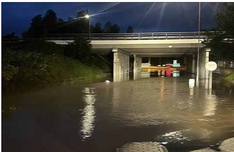
Aby zobaczyć widoki jak z zalanej Wenecji — daleko jechać nie trzeba było...

— Zgodnie z umową już przyszlą wiosną rozpoczną się prace remontowe — zapewniła nas Jolita Orentaitė. ■