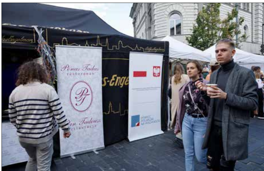
Jedną z atrakcji będzie stoisko kulinarne Domu Kultury Polskiej w Wilnie, przy którym będzie można skosztować pysznych dań, przygotowanych w restauracji „Pan Tadeusz”

Samorząd stołeczny informuje o zmianach ruchu w mieście na czas trwania festiwalu. Informację można znaleźć na stronach internetowych www.judu.lt i www.stops.lt . ■