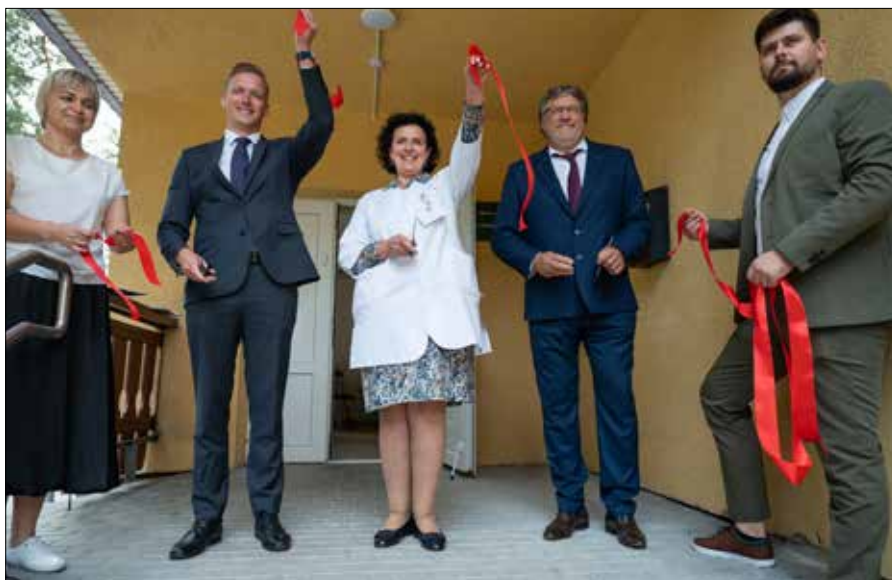
Uroczyste otwarcie odnowionego szpitala leczenia wspomagającego i pielęgnacyjnego w Czarnym Borze

Życzę siły, światła i wiary personelowi medycznemu i wszystkim,