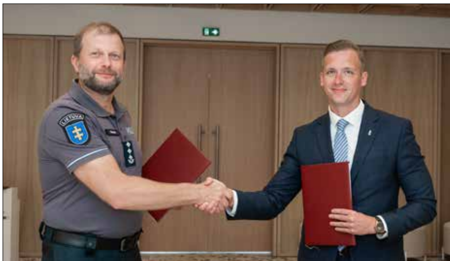
Strony zobowiązały się do współpracy na rzecz dobra mieszkańców rejonu