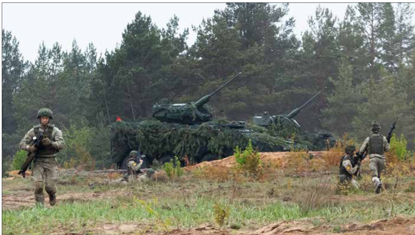
■ Zdaniem myśliwych budowa nowych poligonów może negatywnie wpłynąć na środowisko naturalne