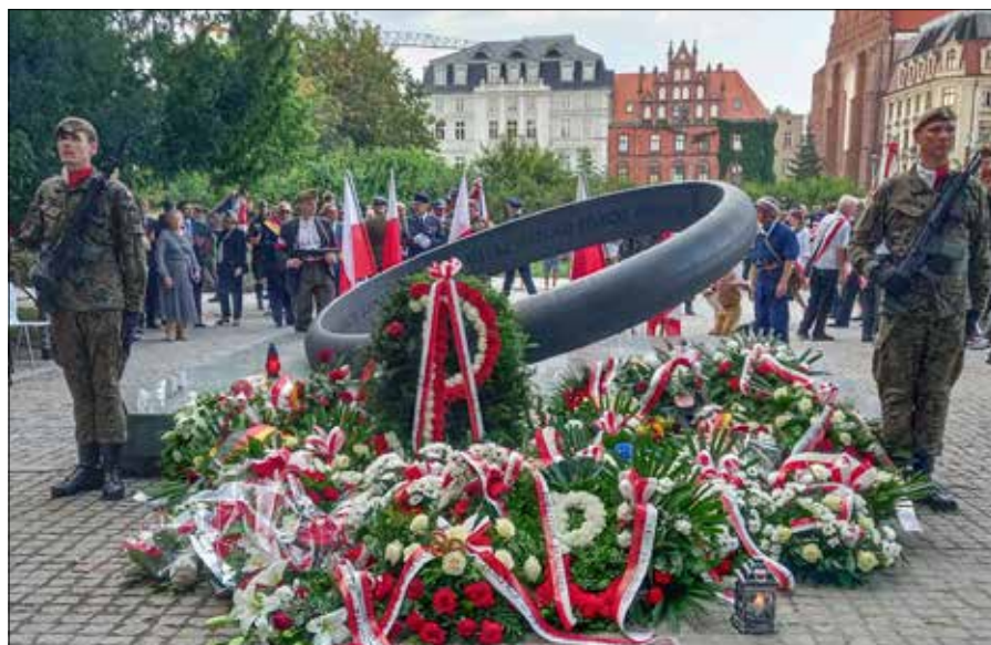
My jako ostatni składaliśmy kwiaty, róże biało-czerwone, z napisem: „01.08.1944 – Bohaterom Powstania Warszawskiego Sybiracy z Wrocławia – 01.08.2024” i złotą liczbą 80