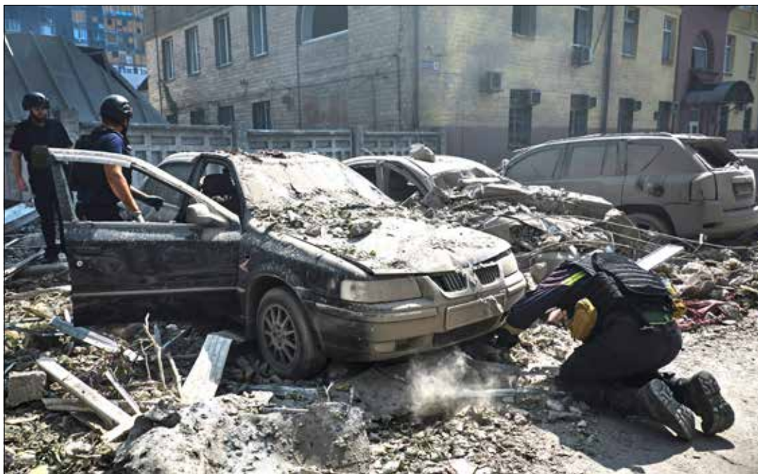
W Charkowie na skutek ataku raketowego zginęła jedna osoba, 12 zostało rannych