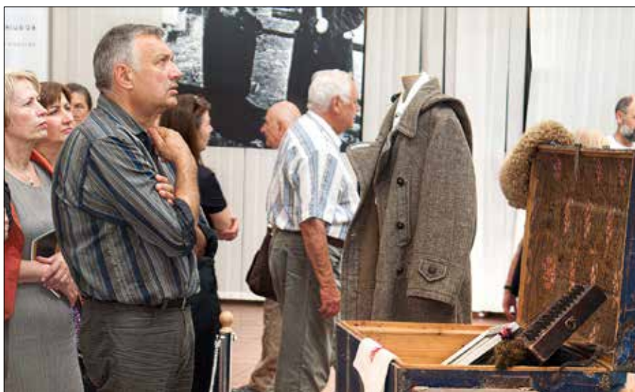
Pierwszy zjazd był bardzo sentymentalny, nawiązujący do repatriacji. Sztandarową imprezą była wystawa, która nazywała się „Co kryły walizki repatriantów?”