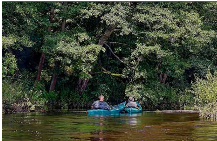
■ Wielką zaletą Mereczanki jest jej spokojny nurt