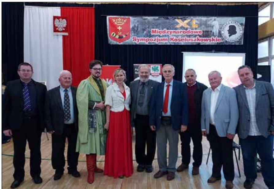
■ Międzynarodowe Sympozjum Kościuszkowskie Fot. arch. pryw. L. M. K.