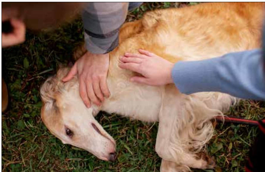
Chore zwierzęta całkowicie zmieniają zachowanie. Zwierzęta domowe, które były zawsze spokojne, stają się agresywne i odwrotnie.

— Aby uchronić się przed wścieklizną, należy przede wszystkim unikać kontaktu z dzikimi lub nieznanymi zwierzętami. W przypadku ugryzienia przez własne, domowe zwierzę ważne jest odpowiednie opatrzenie rany. Jeśli