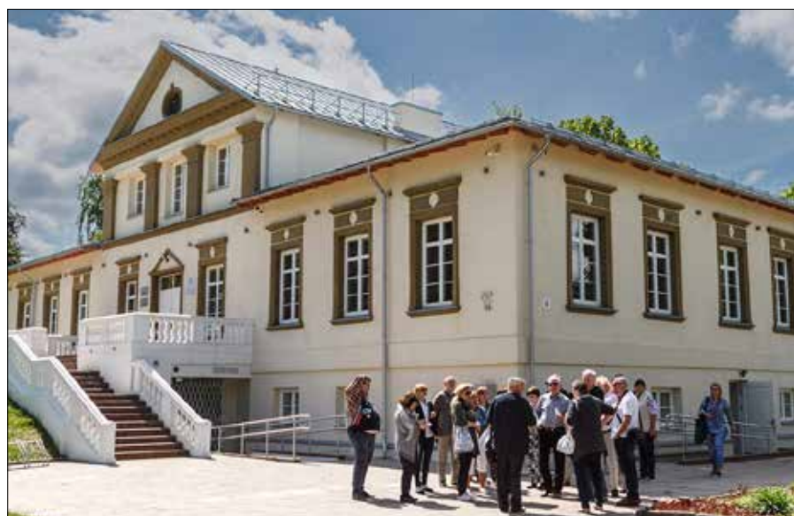
1 września w Pałacu Houwaltów w Mejszagole odbędzie się otwarcie wystawy „Infinity II” z pracami krakowskich artystów

Plany w kulturze nie dotyczą tylko sztuki malarskiej. Polski Teatr „Studio” w Wilnie, od kilku lat, organizuje na Litwie Międzynarodowy Festiwal Sztuki „Trans/Misje”.