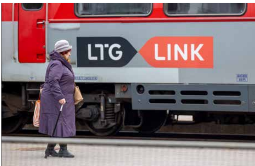
■ Każda osoba posiadająca legitymację emeryta będzie mogła kupić bilet w pociągu bez dodatkowych opłat po zamknięciu kas biletowych

Centra informacyjne LTG Link będą nadal działać na dworcach w Wilnie, Kownie, Kłajpedzie i Szawlach. Ich pracownicy będą w stanie pomóc w zakupie biletów w biletomatach i innych kwestiach związanych z podróżą pociągiem. ■