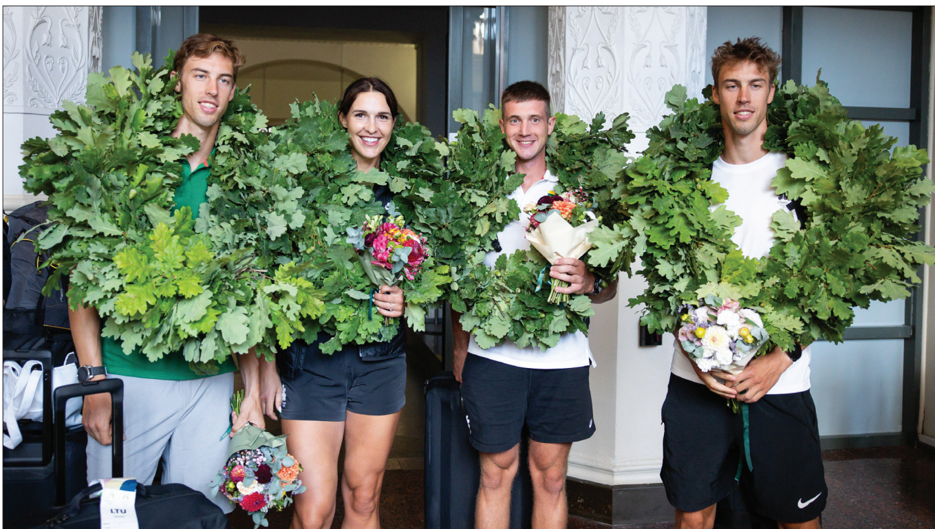
■ Zazeleniło się na wileńskim lotnisku podczas spotkania powracających z Paryża olimpijczyków