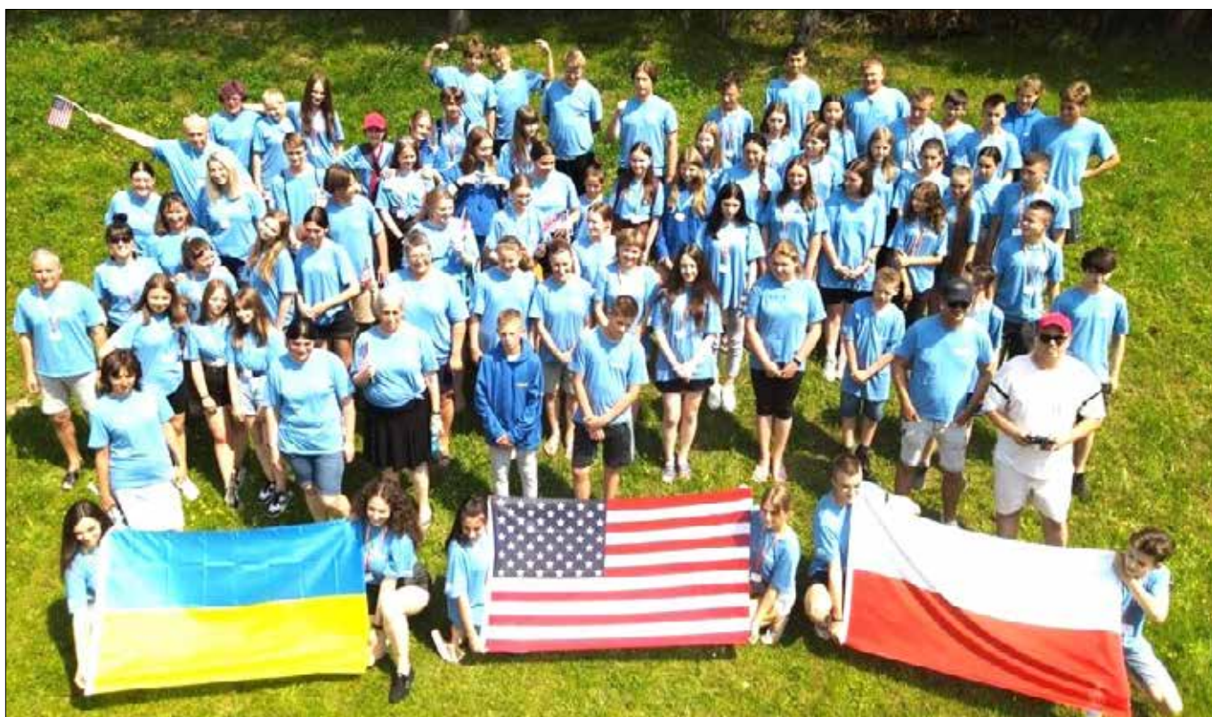
■ 3 lipca br. członkowie fundacji uczestniczyli w obchodach Święta Niepodległości USA