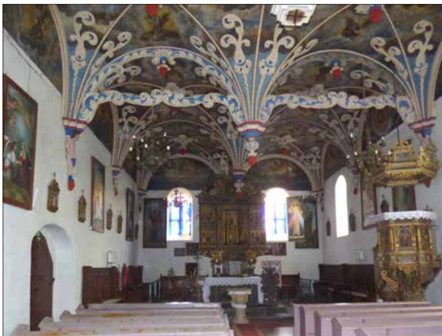
■ Sanktuarium maryjne w Brzesku (wnętrze kościoła)