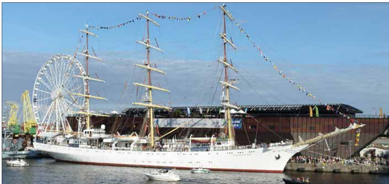
■ „Dar Młodzięży” na tle Morskiego Centrum Nauki im. prof. J. Stelmacha