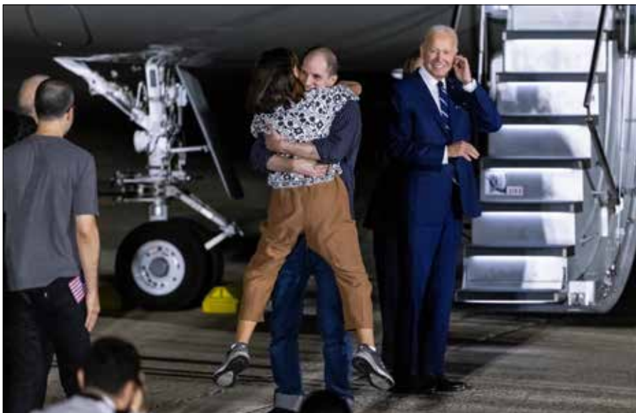
Wśród zwolnionych z rosyjskiego więzienia znalazł się między innymi amerykański dziennikarz Evan Gershkovich, który został skazany na 16 lat więzienia za szpiegostwo

Autorzy analizy podkreślili, że wymiana ma też pewne aspekty negatywne. Zwłaszcza są zastrzeżenia wśród niemieckich polityków. „Interpretuje się ją jako zachętę do zatrzymywania obywateli państw zachodnich przebywających na terenie Rosji i wymiany ich za oficerów rosyjskich służb specjalnych” — czytamy w analizie.