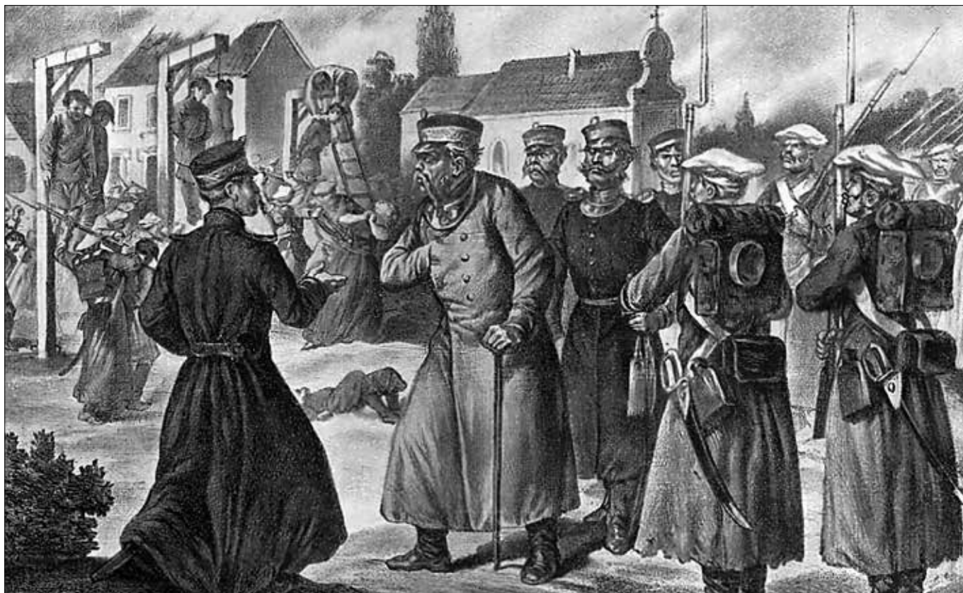
■ XIX-wieczna litografia przedstawiająca Wieszatiela