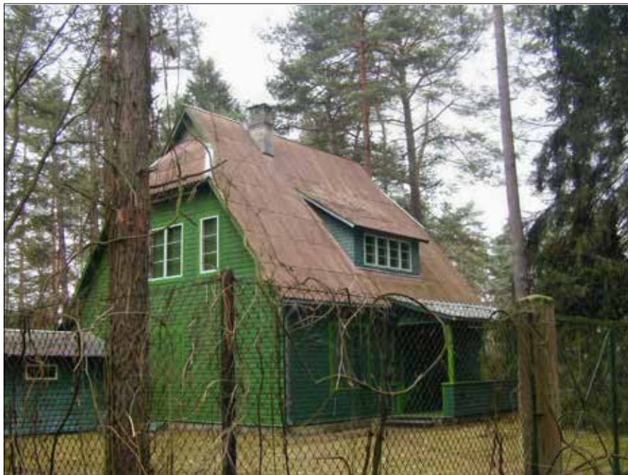
Niektóre przedwojenne domki, w których lubili wypoczywać wilnianie, zachowały się do czasów dzisiejszych