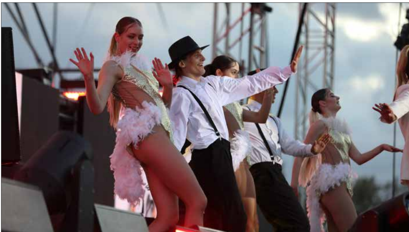
■ „Chleba i igrzysk” po kiejdańsku — czyli święto lodów w Kiejdanach