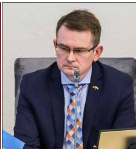
W składzie rządu zabraknie ministrów Kęstutisa Navickasa i Arūnasa Dulkysa

komisarza dla Gabrieliusa Landsbergisa, lidera konserwatystów, ministra spraw zagranicznych.