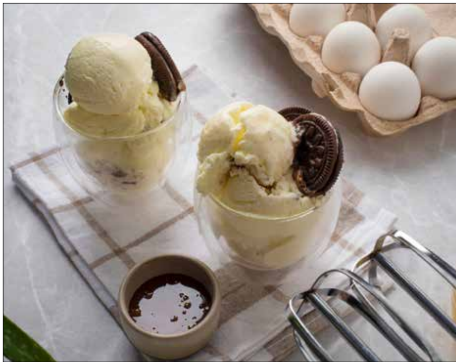
■ Fot. Freepik.com

Wodę z cukrem zagotować i ostudzić. Żółtka ubić z dodatkiem cukru na puszystą masę. Śnieżki wykonać według przepisu, tzn. ubić je mikserem na mleku. Połączyć syrop, żółtka i ubite śnieżki, delikatnie wymieszać trzepaczką do piany. Można zamrozić od razu lub podzielić i do jednej części dodać kakao, a do reszty bakalie lub zmiksowane owoce. Lody przełożyć do pojemników plastikowych i zamrozić. ■