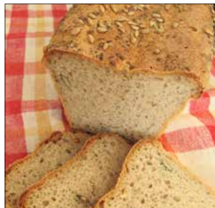
■ Fot. autorka

Ziemniaki ugotowane, zimne przetrzeć przez praszkę, zalać gorą-