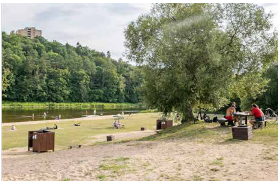
Pierwsza plaża w Wołokumpiach oznaczona jest błękitną flagą — międzynarodowym znakiem jakości

W czasie okupacji niemieckiej w domu tym pojawił się powielacz. Drukowano podziemną gazetkę „Polska walczy”. W 1944 r., w czasie nasilających się walk o Wilno, 54 uchodźców ze śródmieścia znalazło dach nad głową w domu Strużanowskich. Były to głównie osoby z małymi dziećmi, które daleko ująć nie mogły.