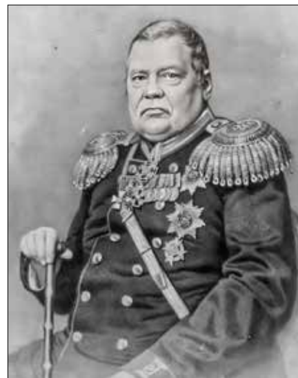
Michał Murawjow-Wieszatiel

W czasie powstania styczniowego Kołyszko dowodził oddziałem, który w szczytowym momen-