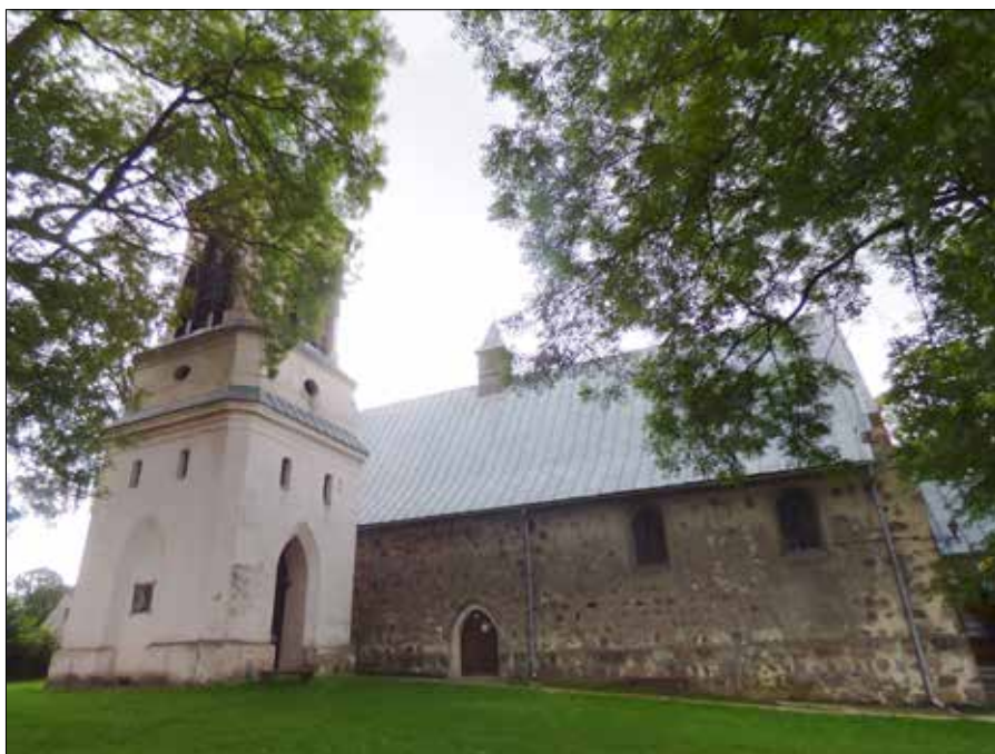
■ Sanktuarium maryjne w Brzesku na Pomorzu Zachodnim