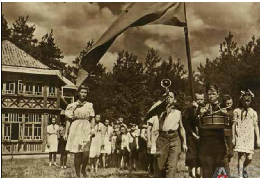
W drewnianych domkach przy ul. Valakmpiu przez wiele lat mieścił się obóz pionierski „Žiburėlis”

Werki, Zielone Jeziora, Belmont, Markucie czy Wołokumpie — to malownicze przedmieścia, gdzie przed wojną wypoczywali wilnianie.