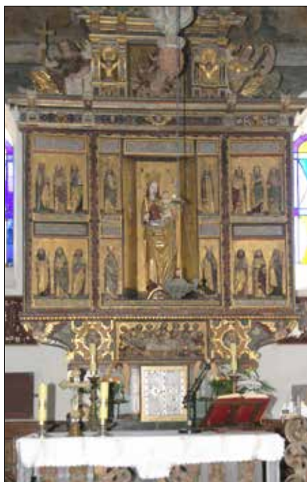
■ Ołtarz główny