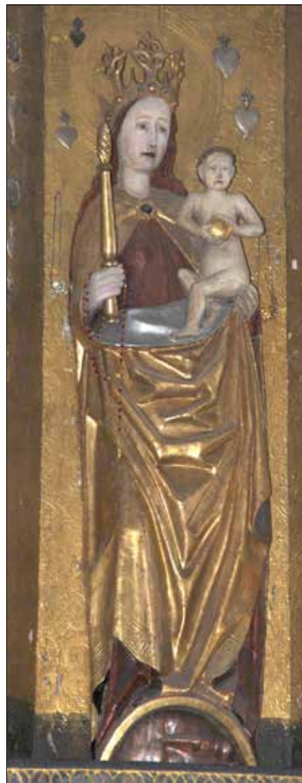
■ Słynąca łaskami figura MB Brzeskiej