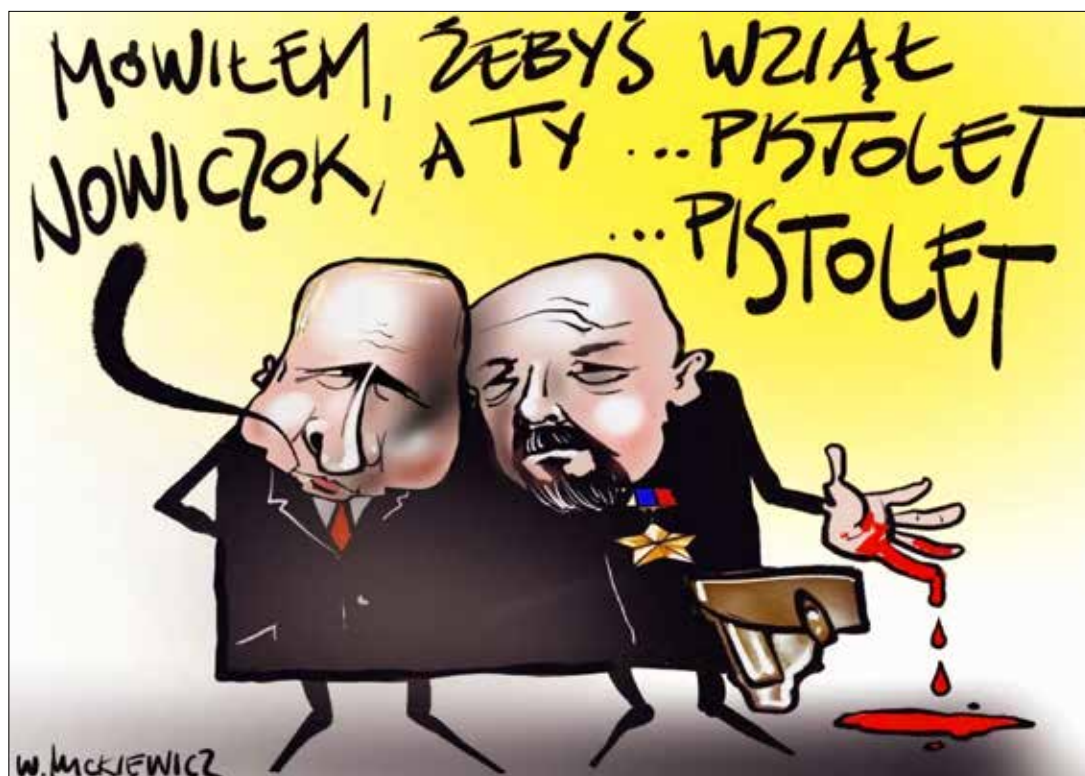
■ Rys. Władysław Mickiewicz