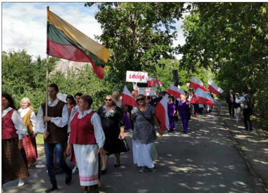
Po Mszy św. zespoły i goście festynu udali się w wielobarwnym korowodzie do parku, gdzie odbył się koncert