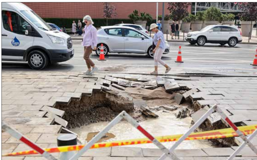
■ Po awarii wodociągu w Kownie część miasta została pozbawiona wody