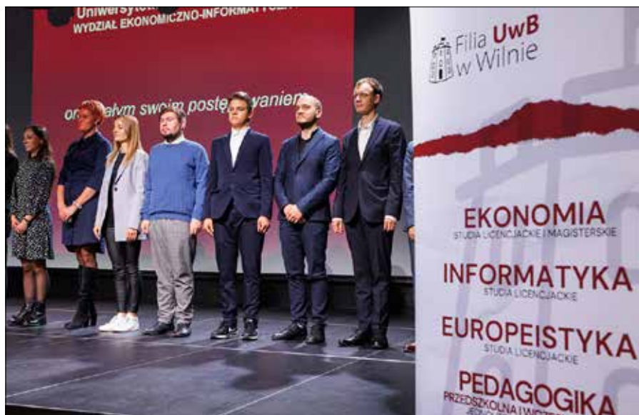
Polska uczelnia oferuje studia na czterech kierunkach: ekonomii, informatyce, europeistyce oraz pedagogice przedszkolnej i wczesnoszkolnej