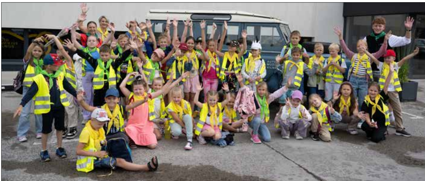
„Wakacje w mieście” trwają w najlepsze, dzieci uczestniczące w półkolonii letniej nie mogą narzekać na nudę

Półkolonie „Wakacje w mieście” trwają od 22–26 lipca, 29 lipca–2 sierpnia i 5–9 sierpnia 2024 r. Organizatorem półkolonii jest Dom Kultury Polskiej w Wilnie. Projekt dofinansowany jest przez samorząd miasta Wilna oraz Instytut Rozwoju Języka Polskiego im. świętego Maksymiliana Marii Kolbego ze środków Ministra Edukacji i Nauki. Partnerem projektu jest Fundacja „Pomoc Polakom na Wschodzie” im. Jana Olszewskiego. ■