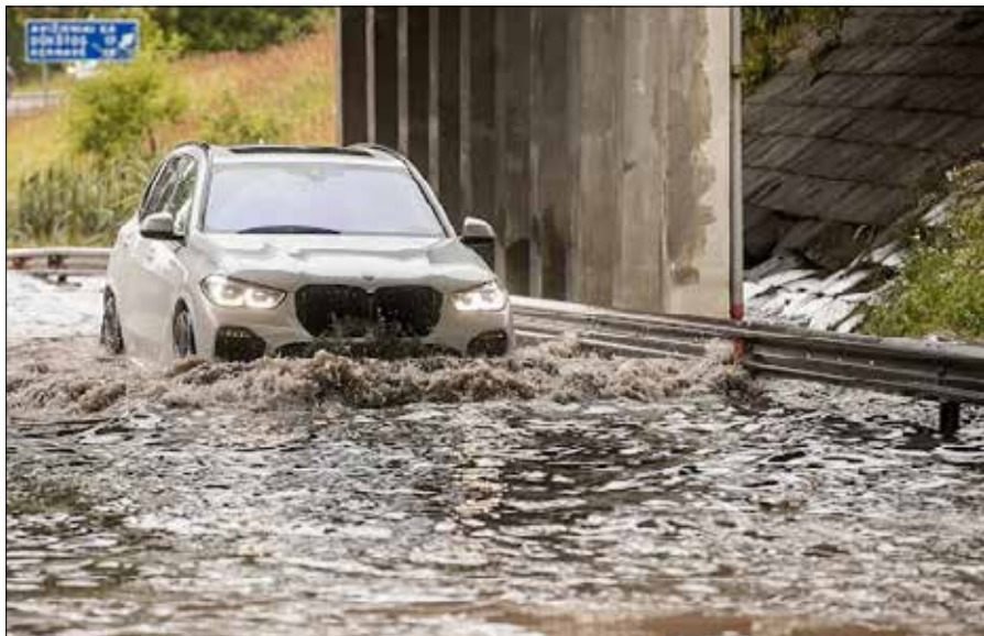
Samochody stały „po kolana” w wodzie, a przejeżdżały tylko dziupy!

wiadukt na 11 kilometrze magistrali Wilno–Uciana, po katastrofalnej ulewie, jaka niedawno przetoczyła się przez cały kraj, znów był zalany.