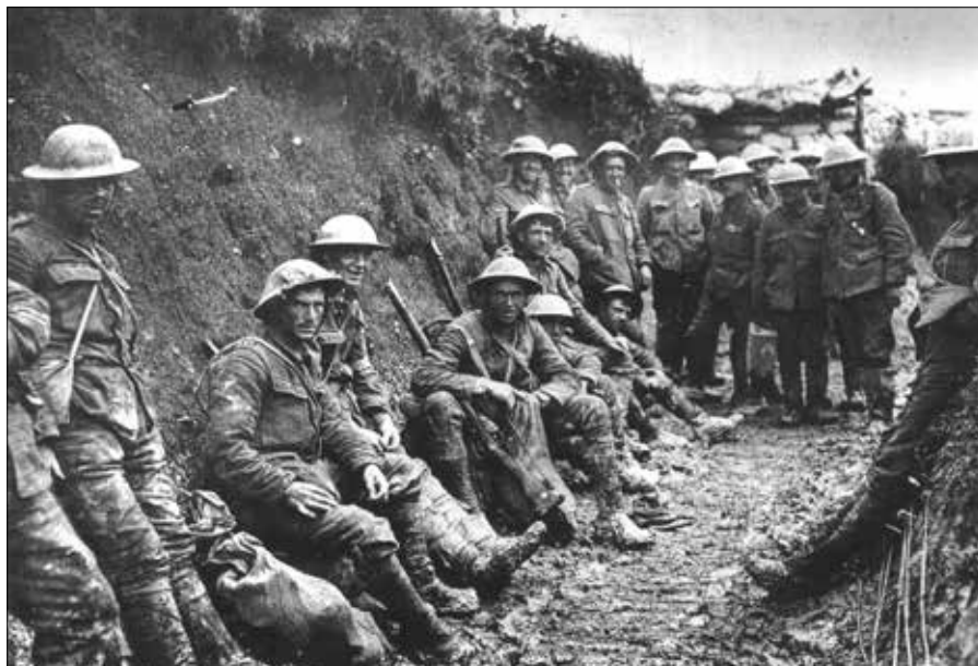
I wojna światowa pochłonęła ponad 8 mln ofiar śmiertelnych

— Kiedy rozpoczynał się konflikt, to wszystkie sztaby generalne państw uczestniczących sądziły, że wojna potrwa od dwóch do sześciu miesięcy. Bardzo szybko się okazało, że wszystkie plany wojskowe nie wypaliły, a wojna zaczęła podążać w absolutnie nieprognozowaną stronę. Na święta 1914 r. Europa znalazła się nie tylko po kolana w błocie okopów, ale również po kolana we krwi. Warto także podkreślić, że plany wojskowe z początku II wojny światowej również nie zakładały tak długiego konfliktu. Dlatego z pewnością te lekcje, z dwóch wojen, nadal są aktualne. Można to również dostrzec w okolicznościach towarzyszących toczącej się rosyjskiej inwazji w Ukrainie. Dlatego dowództwo polityczne i wojskowe państw zachodnich zachowuje pewną zachowawczość, właśnie dlatego, że ma na uwadze tragiczne skutki dwóch wojen światowych. Oczywiście teraz dochodzi jeszcze trzeci czynnik, czyli broń nuklearna. Ta broń jest również elementem powstrzymującym — mówi w rozmowie z naszym dziennikiem Algimantas Kasparavičius. ■