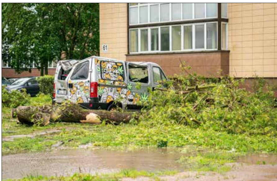
Strażacy i ratownicy interweniowali ponad 900 razy usuwając powalone drzewa i gałęzie