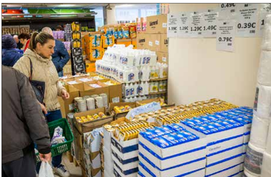
Socjaldemokrati żądają, by rząd zabrał się do regulacji cen żywności w sieciach handlowych

Opr. Aleksander Borowik na podst. inf. agencyjnych