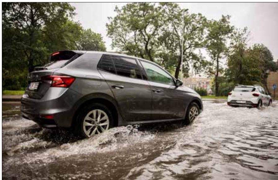
Silne burze i deszcze wyrządziły poważne szkody na terenie całego kraju