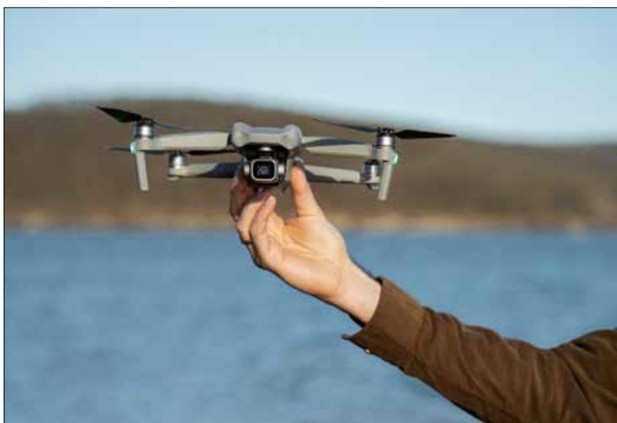
■ Kanadyjscy trenerzy nagrali dwa treningi drużyny Nowej Zelandii...

Opr. Aleksander Borowik na podst. agencji informacyjnych