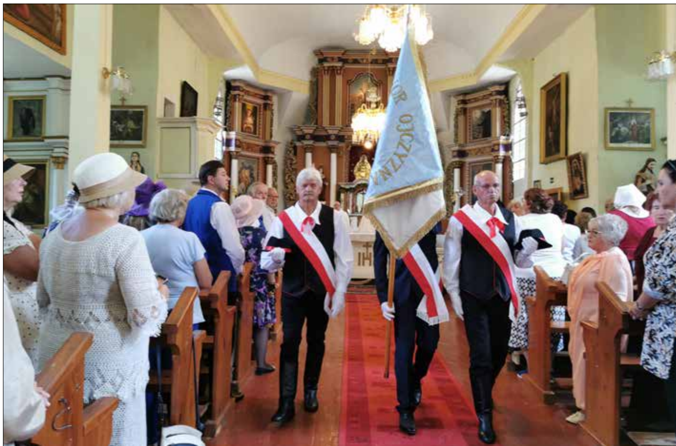
■ Świętowanie rozpoczęło w kościele św. Jana Chrzciciela uroczystym wniesieniem sztandaru Stowarzyszenia Polaków Kiejdan