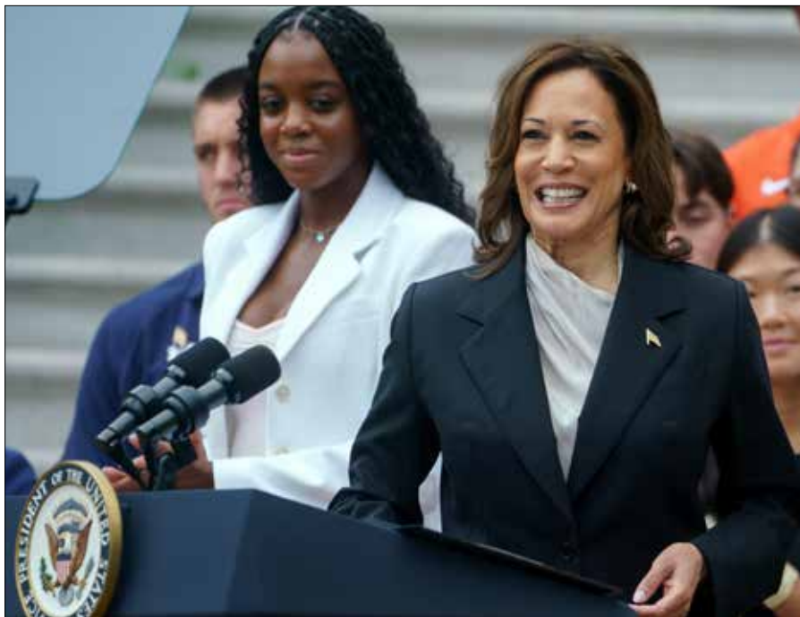
Kamala Harris dała już sygnał, że będzie wykorzystywać kontrast między jej dokonaniem jako oskarżycielki a wyrokami wydanymi na Trumpa

A były prezydent ma w zwyczaju wulgarnie i bezpardonowo atakować kobiety. Kanclerz Niemiec Angelę Merkel nazywał „suką”, o czym poinformowali przedstawiciele jego byłej