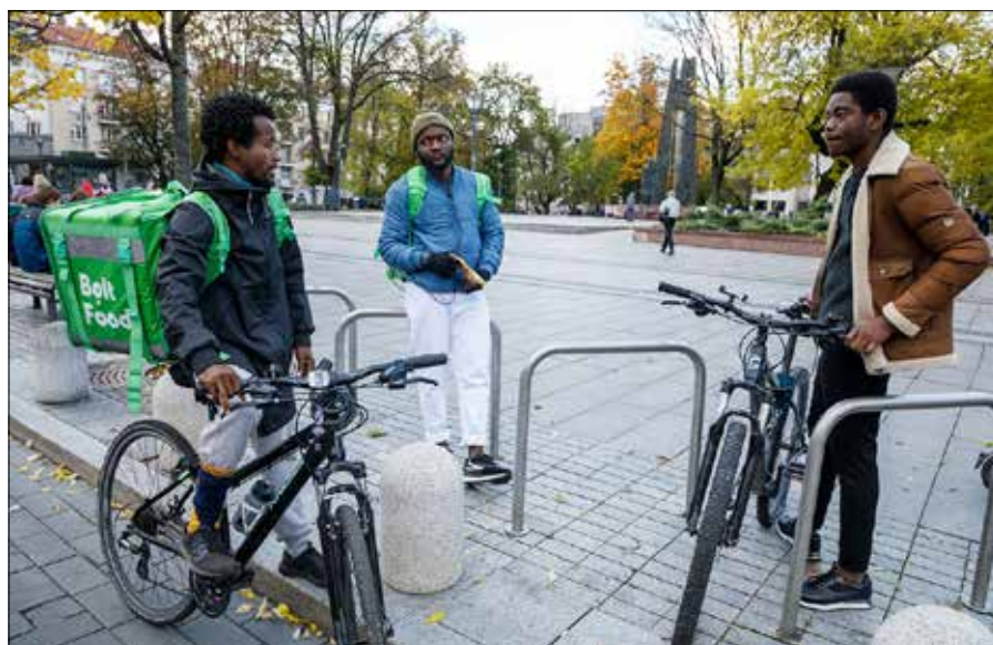
Na Litwie obecnie pracuje 1400 osób pochodzących z 40 krajów afrykańskiego kontynentu

Cudzoziemcy zazwyczaj zajmują stanowiska, których miejscowi nie wybierają ze względu na gorsze warunki pracy i niskie wynagrodzenie. Są oni również zatrudniani, ponieważ miejscowi nie posiadają niezbędnych kompetencji — na przykład rozszerzenie działalności za granicą wymaga menedżerów sprzedaży, którzy znają odpowiednie języki i są zaznajomieni z lokalnymi rynkami. Na Litwie jest wiele osób, które chcą pracować jako specjaliści ds. reklamy, sprzedaży i marketingu — do tej pracy zatrudniono tysiące obywateli państw trzecich, ponieważ znają języki państw trzecich i dobrze znają lokalne rynki. ■