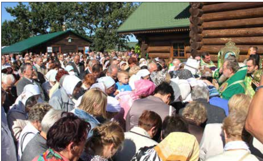
Wierni w Odrynkach (gmina Narew)