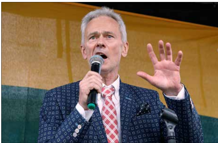
Eduardas Vaitkus zapowiedział, że będzie kandydował w okręgu sołecznicko-wileńskim

Eduardas Vaitkus, którego wynik w I turze wyborów prezydenckich wywołał medialną burzę na Litwie, będzie się starał o mandat do Sejmu z okręgu jednomandatowego sołecznicko-wileńskiego.