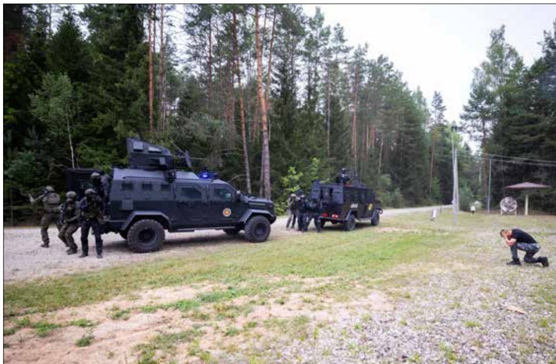
W Wołczunach w rej. wileńskim odbyła się prezentacja Połączonych sił specjalnych litewskiego Ministerstwa Spraw Wewnętrznych