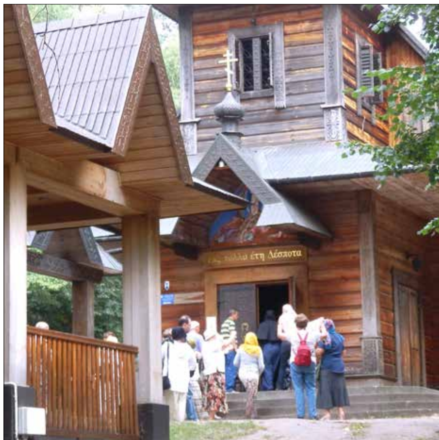
■ Cerkiew Przemienienia Pańskiego na św. Górze Grabarce