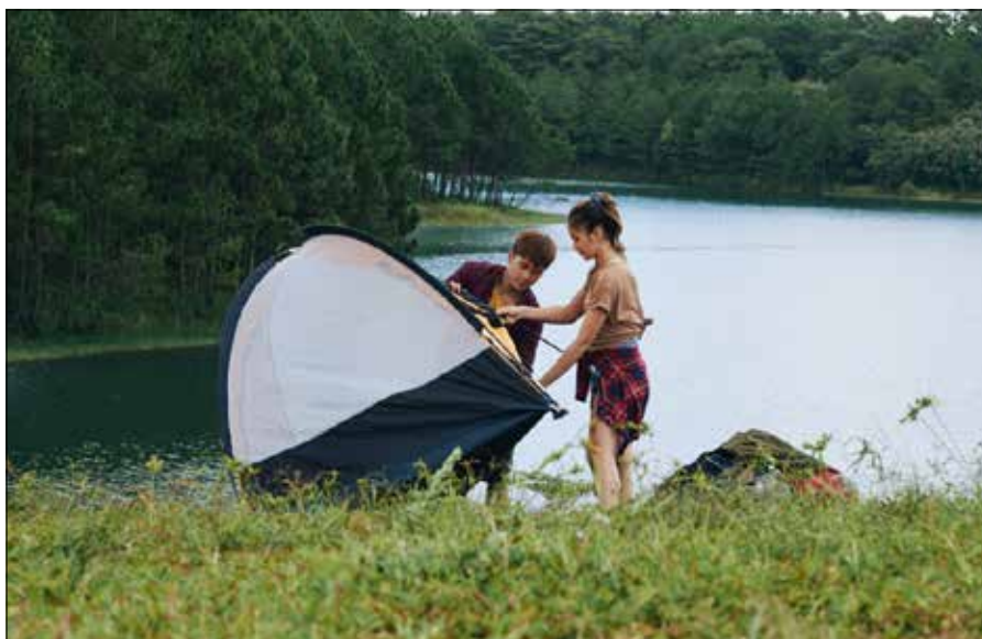
Nie wolno nocować czy rozbijać namiot na dziko, w dowolnie wybranym miejscu