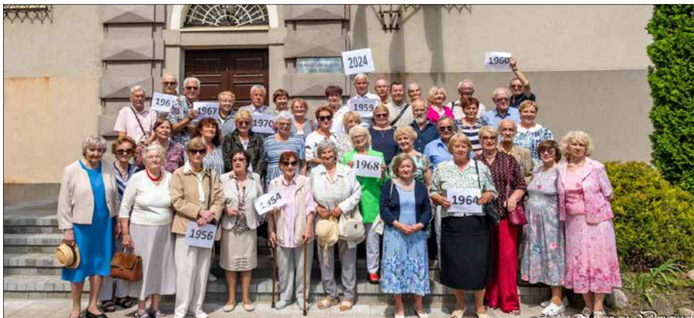
■ Tradycyjnie na początku spotkania — wspólne zdjęcie