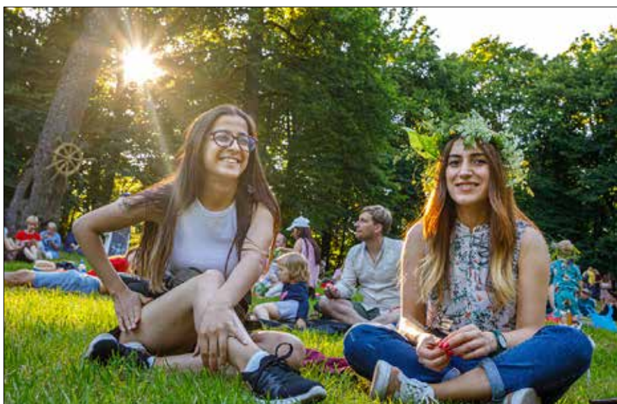
Wianki z kwiatów są jednym z symboli obchodów nocy świętojańskiej

Już wkrótce wianki po rzekach popłyną, zapłoną ogniska i wielu uda się do lasów, by szukać kwiatu paproci.