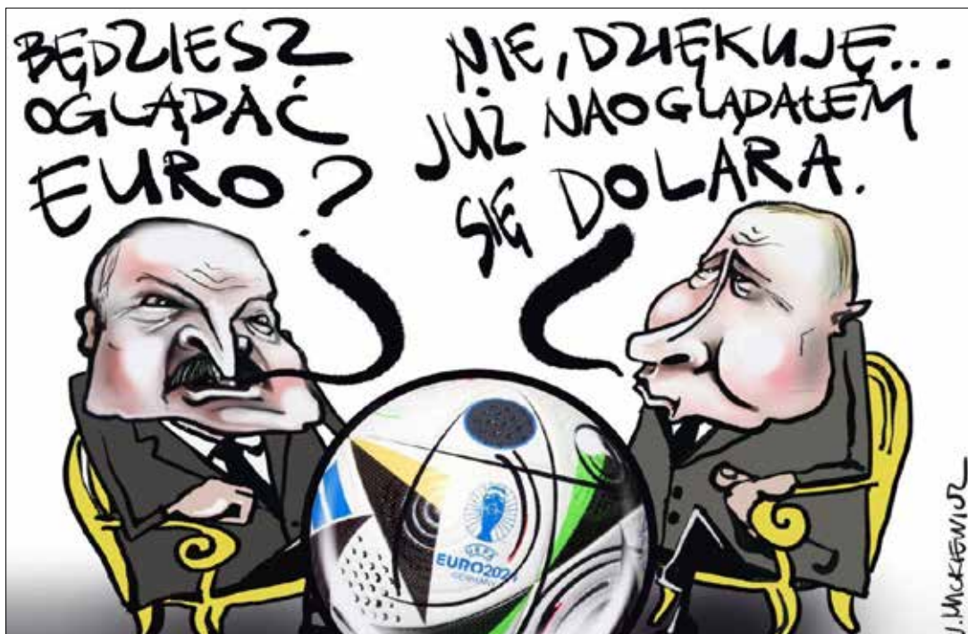
■ Rys. Władysław Mickiewicz