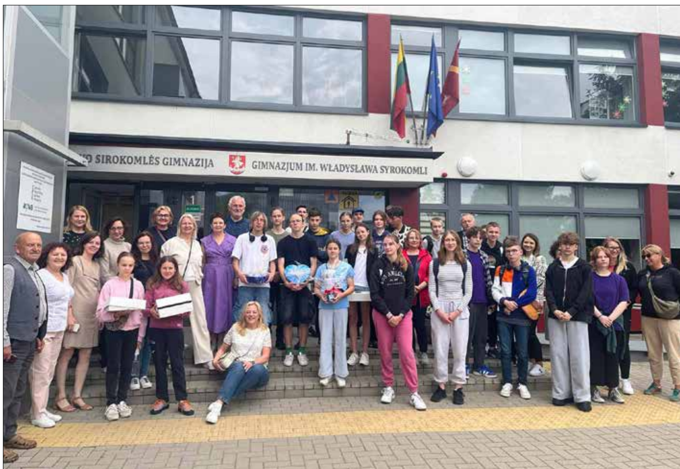
■ Goście z Poznania w podwórku Gimnazjum im. Władysława Syrokomli w Wilnie

Inf. Gimnazjum im. Władysława Syrokomli w Wilnie