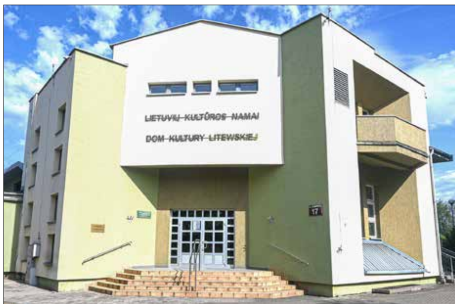
■ Dom Kultury Litewskiej w Puńsku