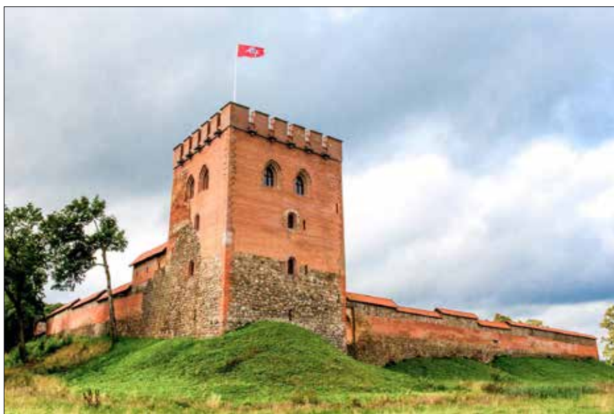
■ Zamek w Miednikach