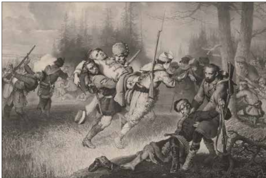
■ Śmierć Ludwika Narbutta w Dubiczach