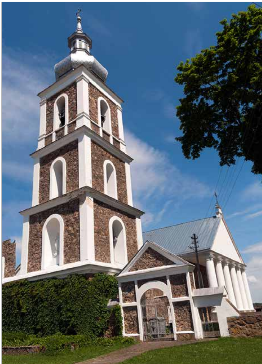
Organizatorzy festiwalu serdecznie zapraszają do wspólnego odkrywania ziemi ejszyskiej i sołecznickiej

Projekt został dofinansowany ze środków Kancelarii Prezesa Rady Ministrów w ramach zadania publicznego dotyczącego pomocy Polonii i Polakom za granicą 2024 za pośrednictwem Fundacji „Pomoc Polakom na Wschodzie” im. Jana Olszewskiego.