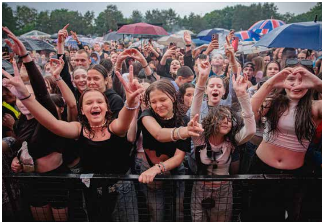
■ W sobotę 25 maja Kowno hucznie obchodziło swoje 616. urodziny