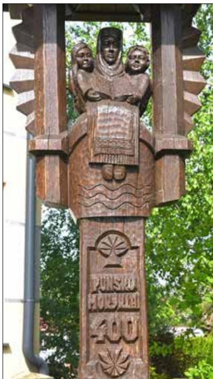
Pomnik upamiętniający 400. rocznicę powstania pierwszej szkoły w Puńsku wzniesiony w roku 2000

W szkole takich dodatkowych zajęć nie prowadzimy. Wszystko, co się dotyczy podtrzymania języka czy kultury litewskiej, odbywa się na lekcjach. Natomiast bardzo szeroki zakres takich zajęć prowadzi Litewski Dom Kultury. Nasza młodzież ma już tyle zajęć, że wprowadzanie dodatkowych lekcji, prócz zajęć sportowych, byłoby nieuzasadnione.