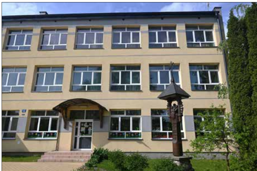
Szkoła podstawowa w Puńsku oraz pomnik upamiętniający 400. rocznicę jej powstania