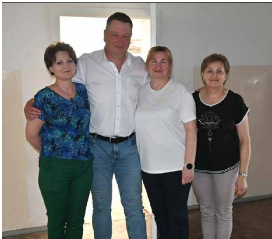
■ „W naszym 37-osobowym zespole jest aż 31 kobiet” – mówi dyrektor szkoły