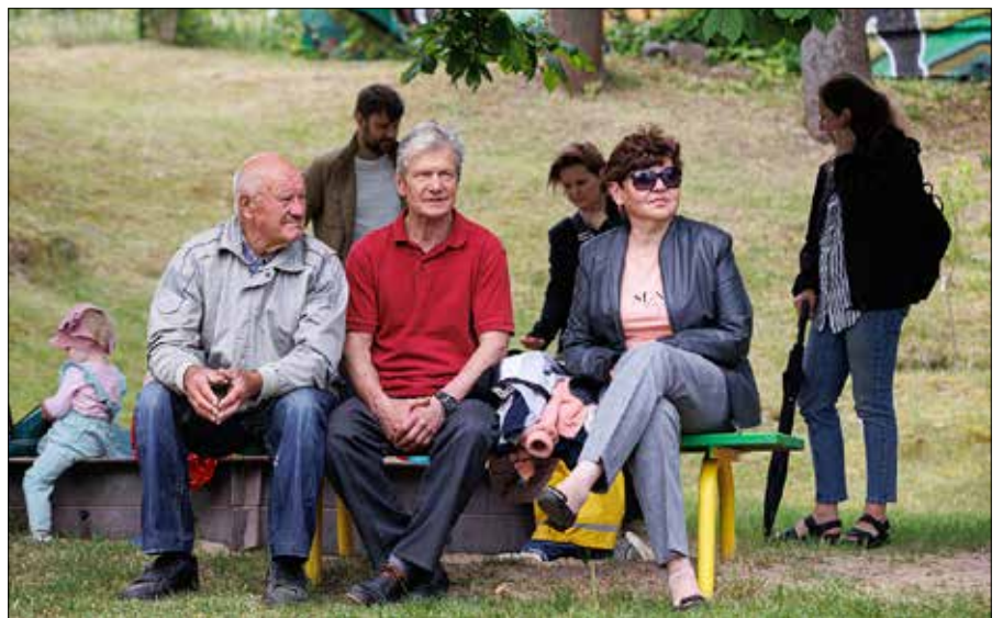
W 2026 r. wiek emerytalny dla kobiet i mężczyzn wyrówna się i wyniesie 65 lat