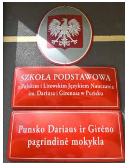
Tablice informacyjne z nazwą szkoły w językach polskim i litewskim

Nadal jednak uczymy języka rosyjskiego. Uważam, że w naszych rejonach warto znać ten język. Język rosyjski jest nauczany od klasy VII przez dwa lata, dwie godziny ty-