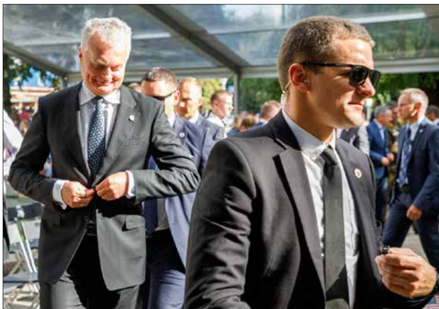
Obecnie tylko prezydent Gitanas Nausėda jest stale chroniony przez Służbę Ochrony Kierownictwa Litwy