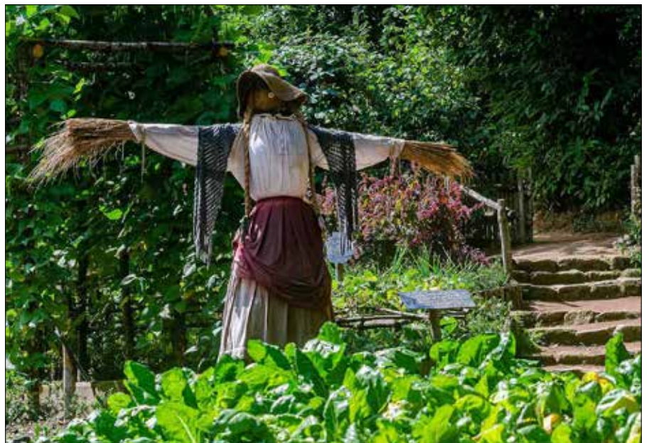
■ Szerokie pole do popisu fantazji — strach na wróble