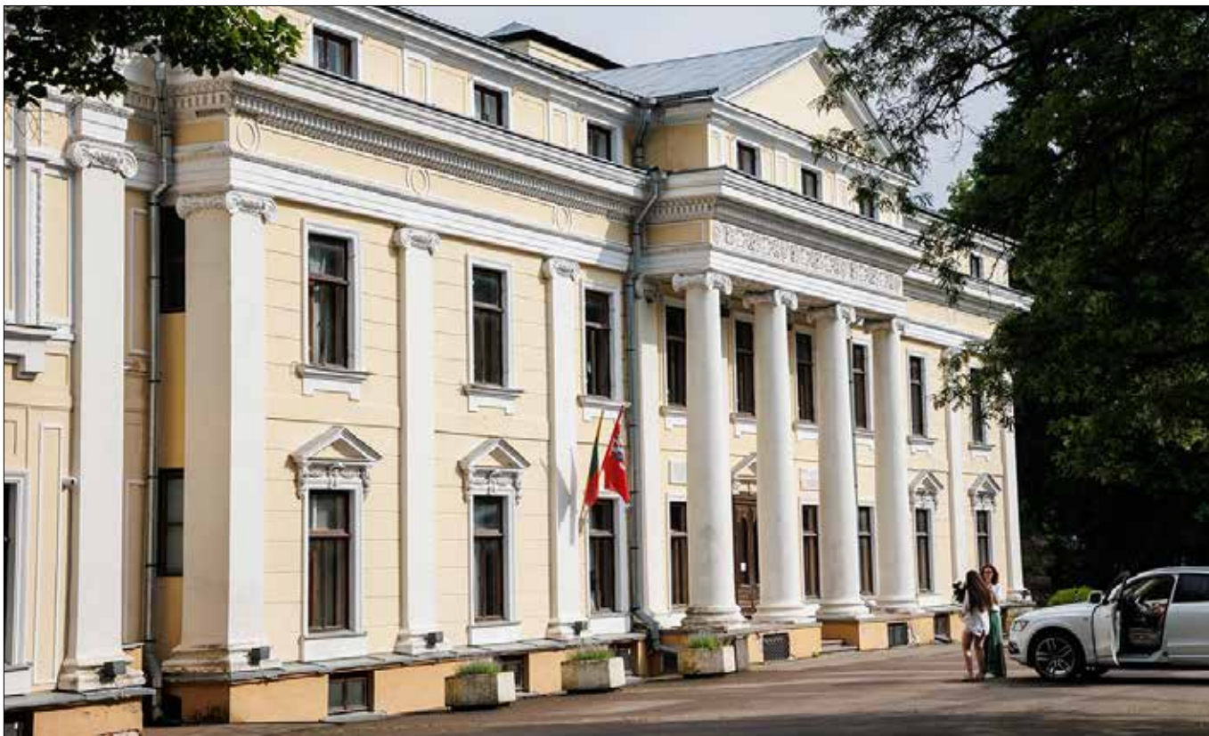
■ Do 1794 r. Werki należały do biskupów wileńskich