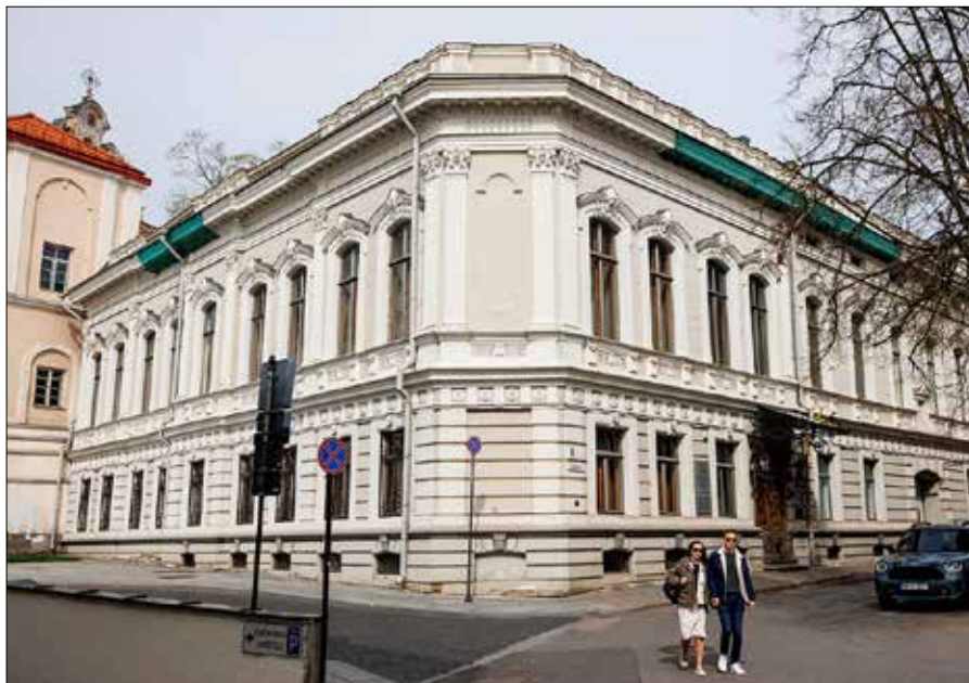
■ Po drugiej wojnie światowej władze przekazały pałac Związkowi Pisarzy Litewskich

Obok pałacu mieści się nieczynny od wielu dziesięcioleci kościół pw. św. Jerzego. Pierwszy kościół w tym miejscu w 1506 r. wznosił wojewoda wileński Mikołaj Radziwiłł na pamiątkę zwycięstwa nad Tataarami pod Kleckiem. W XVIII w. po