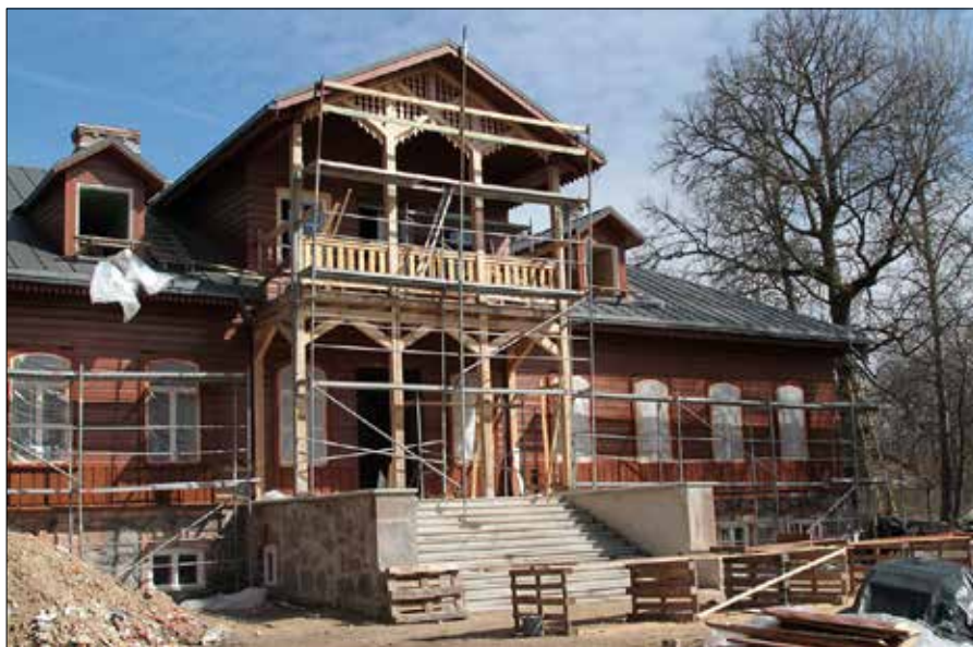
■ W 2015 r. Samorząd Rejonu Sołecznickiego podjął się renowacji dworku, odwzorowując oryginalne elementy zdobnicze