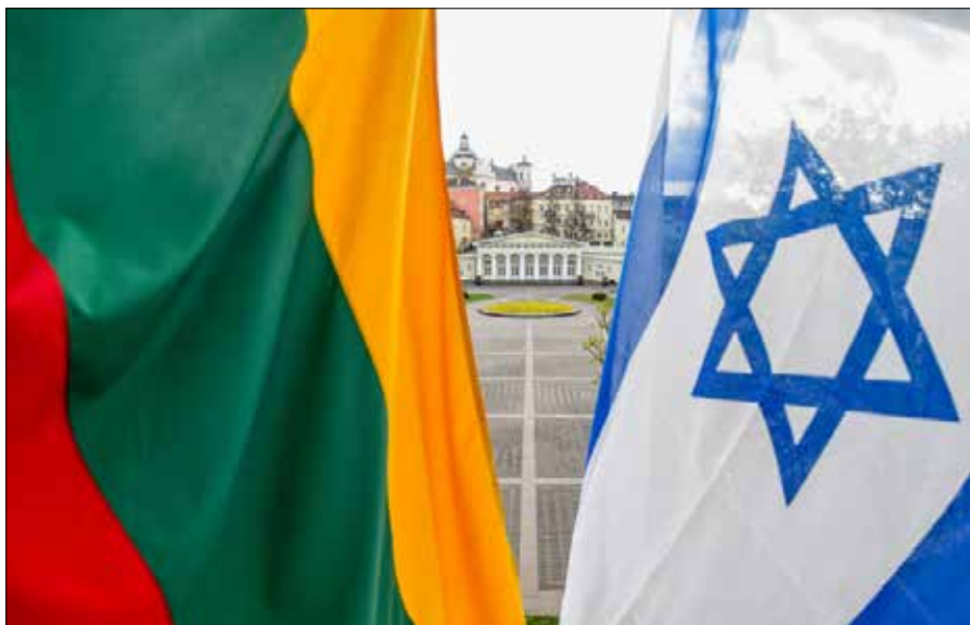
Litwa potępiła atak Iranu przeciwko Izraelowi

Tymczasem strona irańska nazwała atak sukcesem. Mieszkańcy Iranu popierają atak przeciwko Izraelowi. Prezydent kraju Ebrahim Raisi wydał oświadczenie, w którym napisał, że atak został przeprowadzony w ramach odwetu. Dodał, że w ciągu ostatnich sześciu miesięcy, a szczególnie w ostatnich tygodniach, jego kraj użył wszelkich narzędzi, aby zwró-