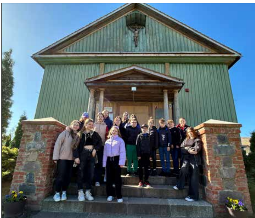
W ramach wycieczki, w Powiewiórce młodzież odwiedziła jeden z najstarszych na Litwie kościołów