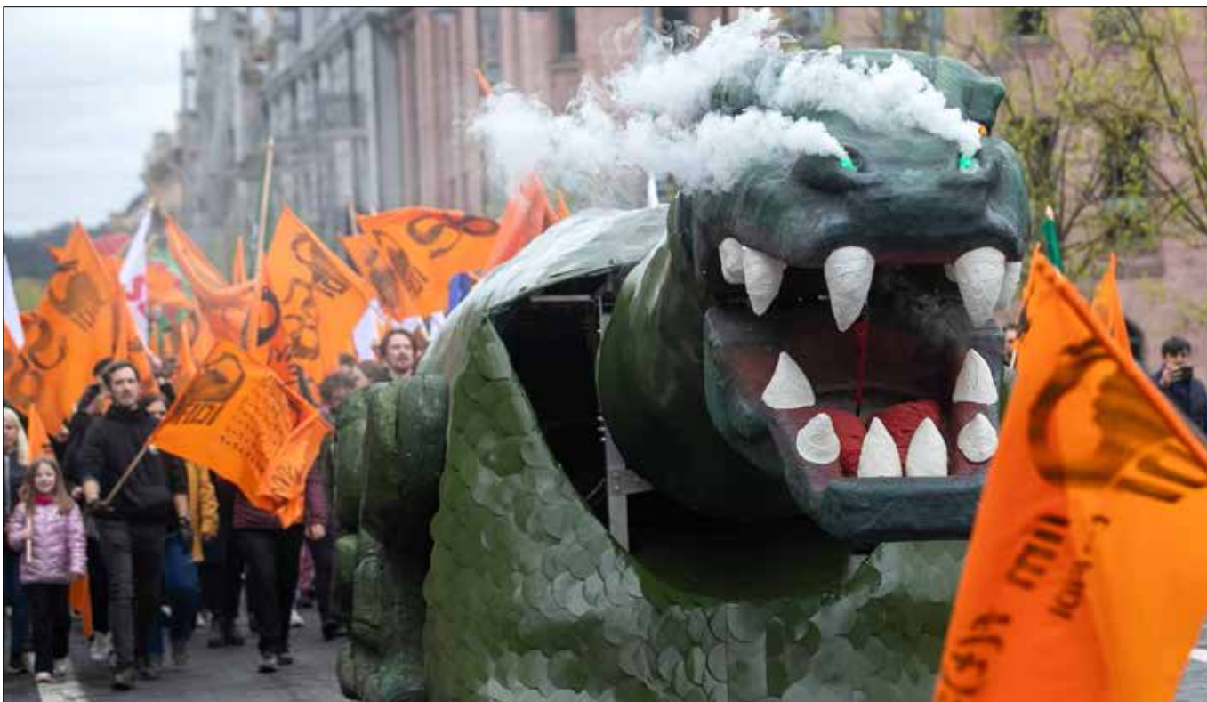
■ Pochód z okazji Dnia Fizyków (FiDi) w Wilnie