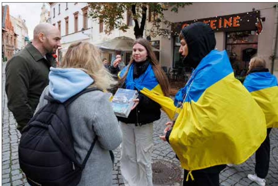
■ Zbiórka darów na rzecz wsparcia Ukrainy odbędzie się 16, 17 i 18 kwietnia