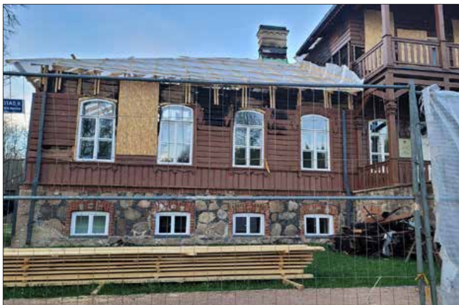
■ Największe straty pożar wyrządził w lewym skrzydle