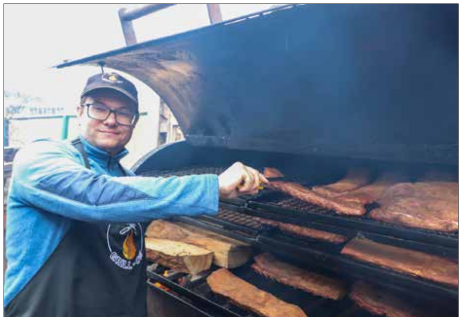
■ Megagrillowanie na Święcie Kłajpedy!

Wieprzowina jest najpopularniejszym mięsem na grilla czy szaszłyki. Na naszych rusztach króluje karkówka, szynka oraz schab. Na wieprzowe steki idealnie nadaje się schab środkowy, polędwiczka oraz plastry mięsa od szynki.