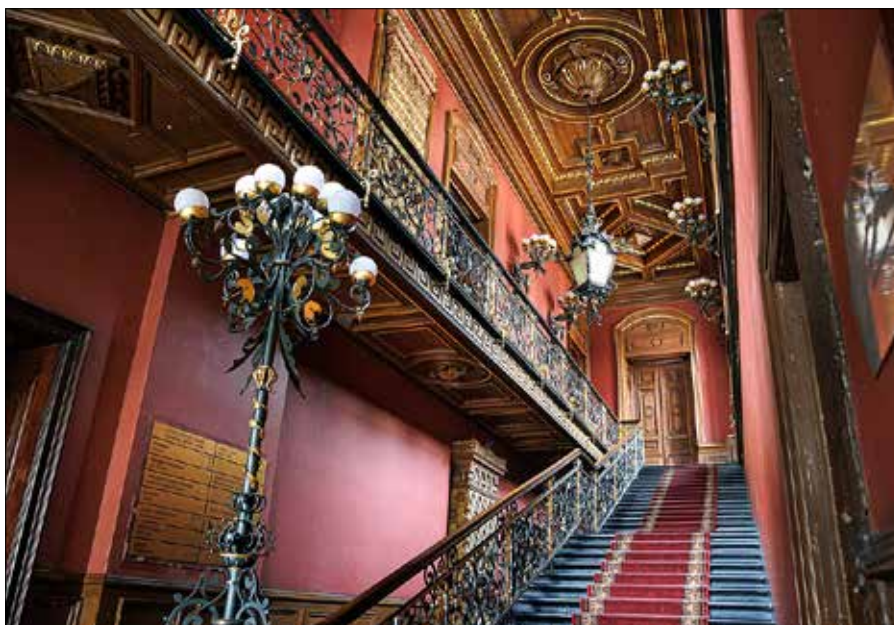
■ Hr. Ignacy Korwin-Milewski wyposażył pałac w marmury i rzeźby