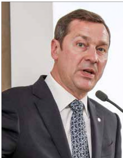
■ Artūras Zuokas

W listopadzie ub. roku Rada „Wolności i Sprawiedliwości” zaproponowała wyniesienie kandydatury Paulauskasa na prezydenta, ale ten ogłosił w tym tygodniu, że nie zamierza kandydować i zasugerował, aby partia poparła kandydaturę prawnika Ignasa Vėgėlė.