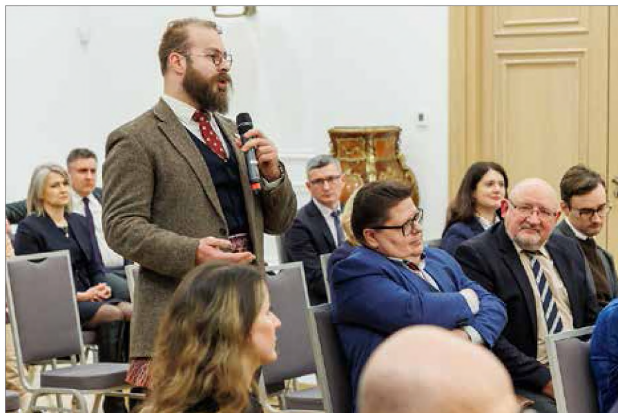
Podczas spotkania zostały poruszone kwestie nazwisk, nazw toponimicznych, polskich mediów, okręgów wyborczych oraz edukacji w języku polskim