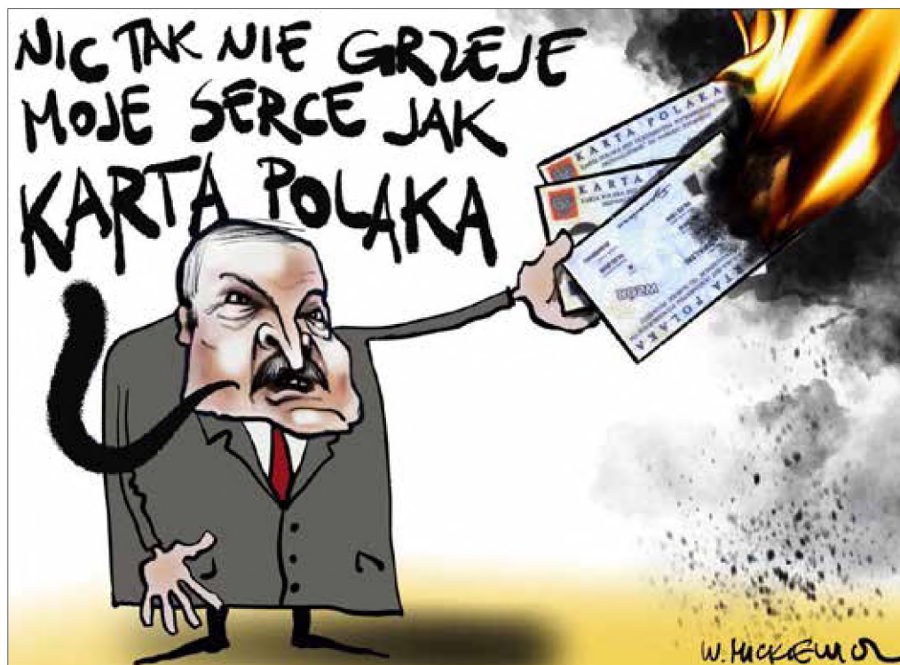
■ Rys. Władysław Mickiewicz