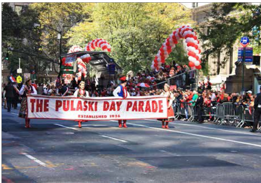
■ Parada Pułaskiego w Nowym Jorku