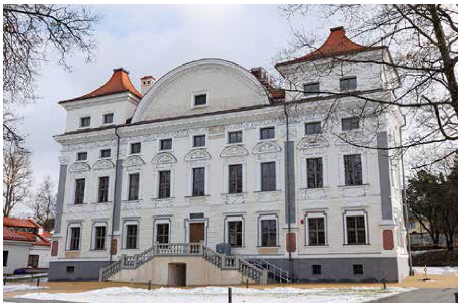
■ Koszty renowacji pałacu Sapiehów wyniosły blisko 12 mln euro

Większy materiał o odnowionym pałacu Sapiehów zostanie opublikowany w najbliższym wydaniu magazynowym „Kuriera Wileńskiego”. ■