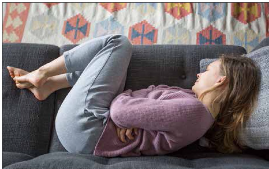
Wrzodzące zapalenie jelita dotyczy najczęściej osób około trzydziestki