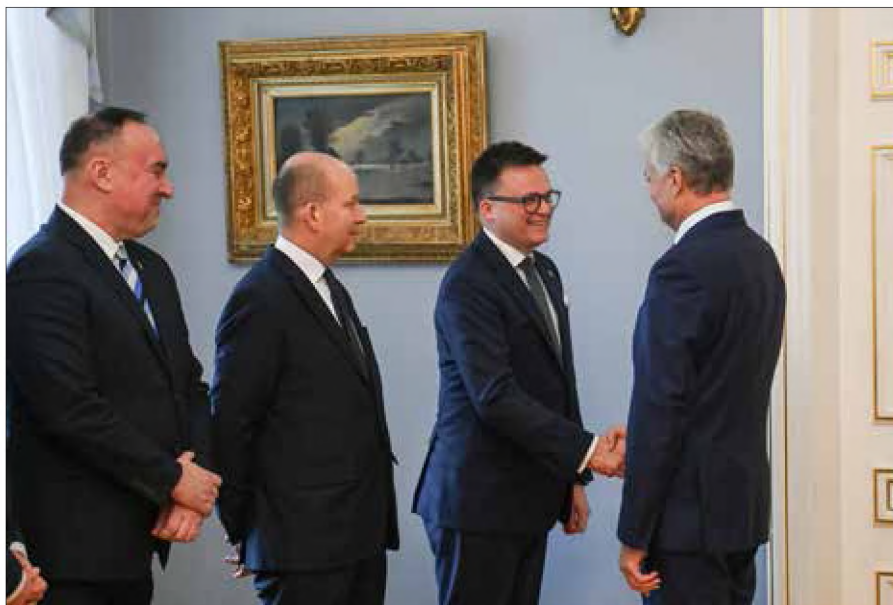
W trakcie spotkania marszałka Sejmu RP z prezydentem Litwy zostały poruszone tematy dotyczące bezpieczeństwa

Dzisiaj (6 lutego) Hołownia będzie miał wykład na Uniwersytecie Wileńskim pt. „Czego obywa-