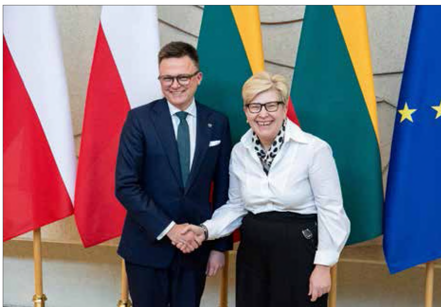
W trakcie wizyty na Litwie Szymon Hołownia spotkał się również z premierem Ingridą Šimonytė