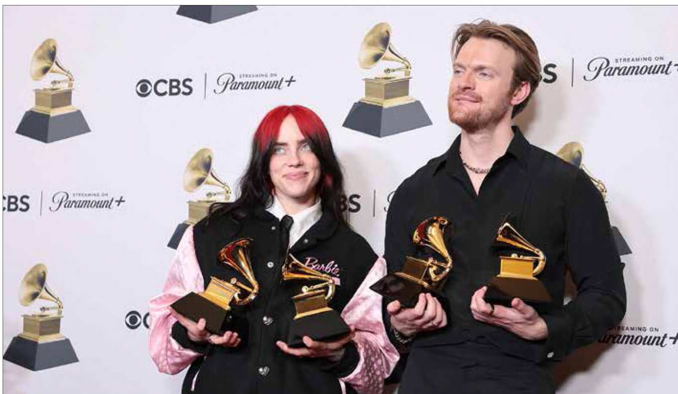
■ Na Grammy, w kategorii Najlepsza piosenka oryginalna zwyciężyło rodzeństwo O'Connellów, czyli Billie Eilish i Finneas