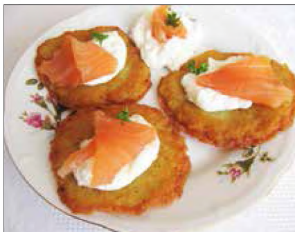
■ Fot. autorka