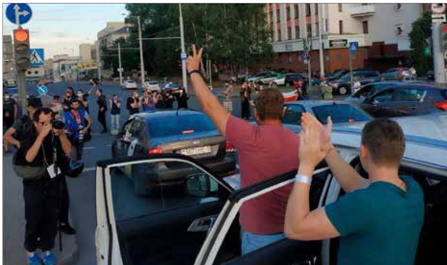
Wściekłość narodu wybuchła po ogłoszeniu wyników wyborów. Rano jednak protestujących było mniej, przybywało po godzinach pracy

Zbrojne ramię Białorusi skończyło swoją podróż dzień później, w Warszawie. Dowódcy wrócili na front. Biorąc pod uwagę aktywną postawę kalinowców, co daje najsilniejszy mandat do wypowiedzania się o przyszłości narodu, krytyczne uwagi wywołały dyskusję w publiczności, która trwała jeszcze po zakończeniu spotkania. ■