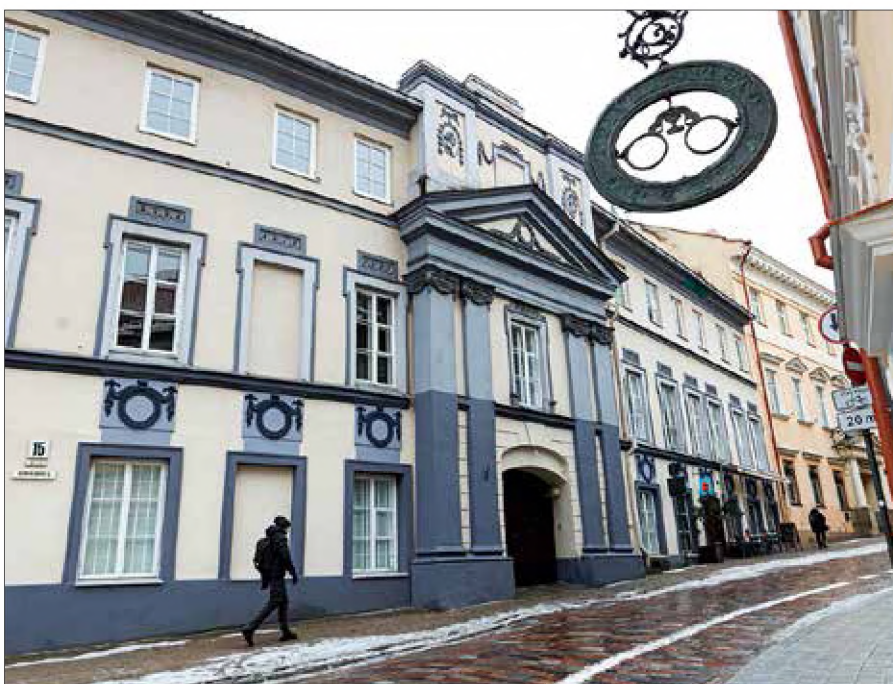
■ Pałac Goreckich mieścił się przy ul. Dominikańskiej w budynku pod nr 15