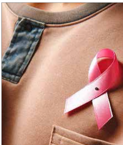
■ Fot. opr. cyfr. A.K.

Natomiast choroba Leśniowskiego-Crohna może dotyczyć wszystkich odcinków przewodu pokarmowego, najczęściej jednak lokalizuje się w końcowym odcinku jelita cienkiego i w jelicie grubym, a prócz błony śluzowej zapalenie obejmuje głębiej położone ściany przewodu pokarmowego: błonę podśluzową, mięśniową. Choroba ta może mieć charakter drażący, penetrujący i częściej doprowadza do powikłań, częściej też wymaga leczenia operacyjnego.