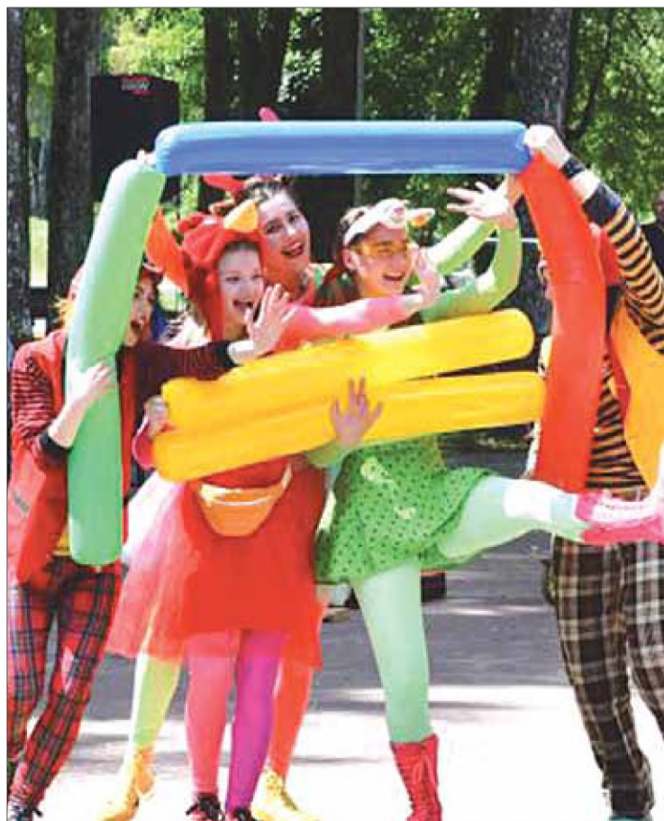
Stronę przygotował Andrzej Kolosowski