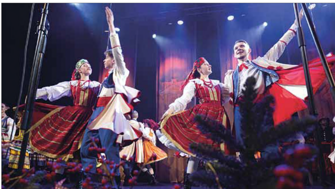
„Wilia” przedstawiła licznie zebranych widzom folklor różnych regionów Polski, polskie tańce narodowe, jak też pieśni i tańce Wileńszczyzny

ZPL – sztandarowej polskiej organizacji na Litwie: „Dziękuję w imieniu ZPL i wszystkich tu obecnych. Dziękuję także za tę jed-