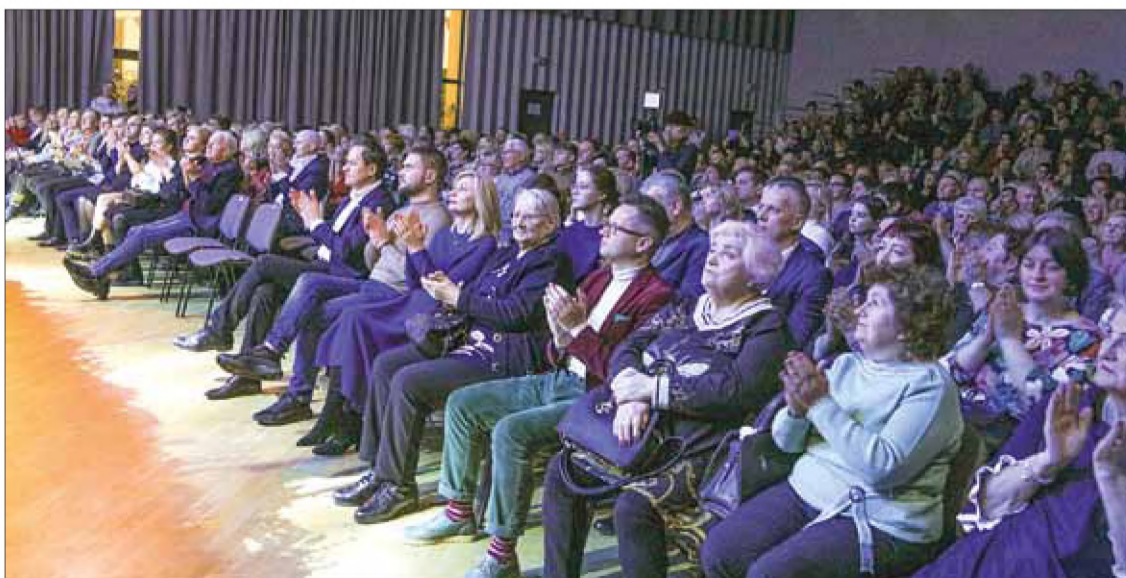
30 grudnia, koncert noworoczny „Wilno-miasto nad Wilią”, który odbył się w dwóch odsłonach o godz. 13.00 i 17.00 w Domu Kultury Polskiej w Wilnie cieszył się ogromnym zainteresowaniem widzów