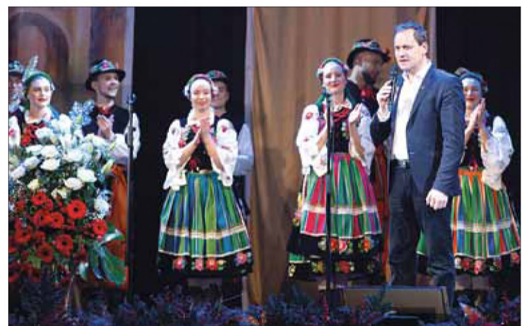
Koszem kwiatów zespół „Wilia” uhonorował prezes ZPL, poseł do PE Waldemar Tomaszewski, który podziękował „wiliowcom” za wspaniały koncert noworoczny, również za to, że są aktywnymi członkami ZPL – sztandarowej polskiej organizacji na Litwie