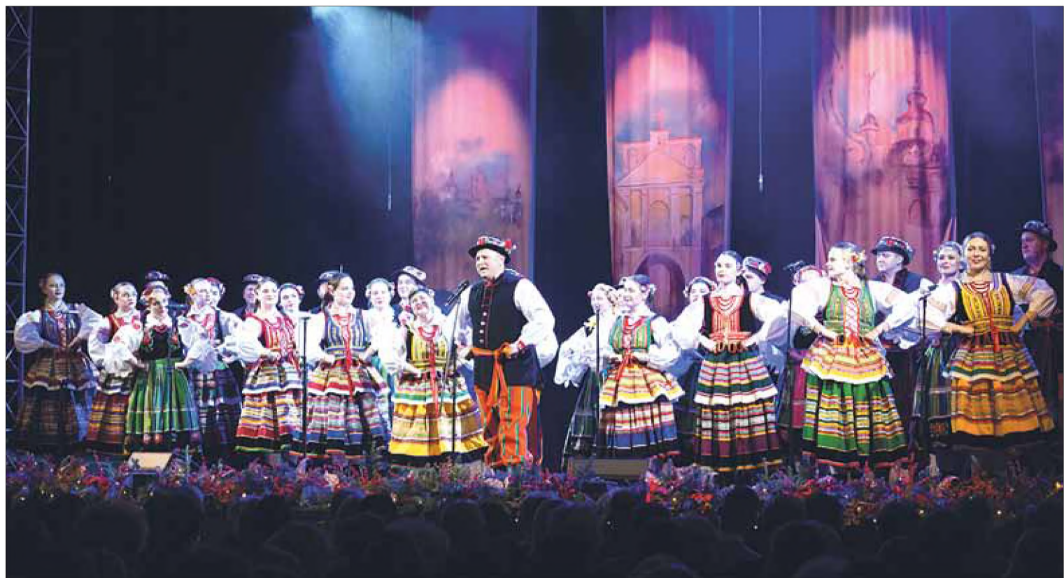
Tradycyjny noworoczny koncert Polskiego Zespołu Artystycznego Pieśni i Tańca „Wilia” został poświęcony 700-leciu miasta Wilna, zespół zaprosił na „spacer po dzisiejszym mieście, ale także powrót do dawnego Wilna”

Koncert rozpoczął się polonezem wileńskim, który został wykonany „ze szczególnym uczuciem i wzruszeniem”, gdyż przed miesiącem polonez został wpisany na listę dziedzictwa narodowego UNESCO. „To ogromna