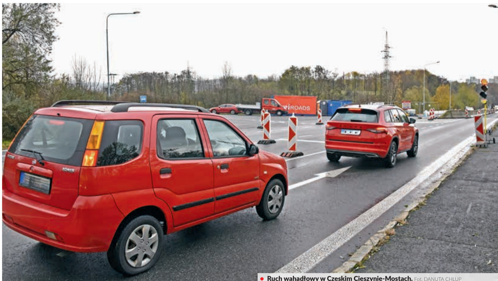
• Ruch wahadłowy w Czeskim Cieszynie-Mostach.