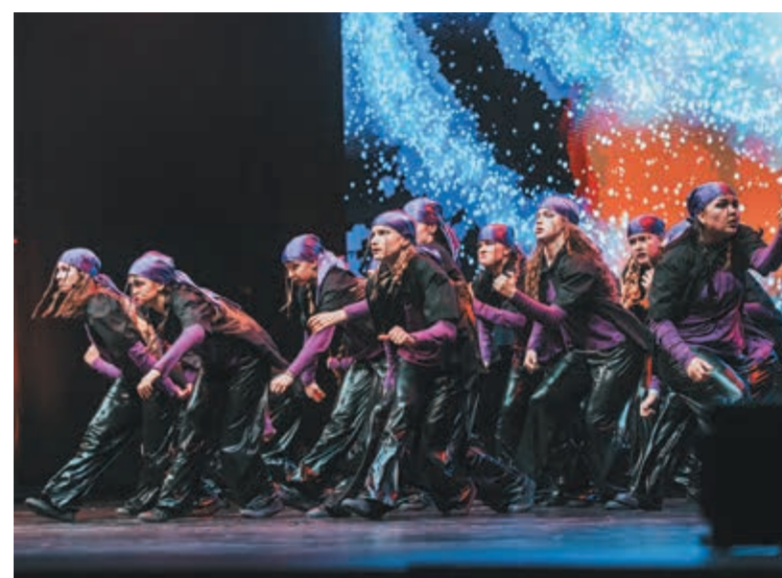
• Funky Beat i ich „Czarna dziura”.

bez kreatywności nie da się obejść. Tu liczy się również osobowość choreografa i tancerzy, którzy pomagają mi łączyć naukę w gimnazjum z tańcem.