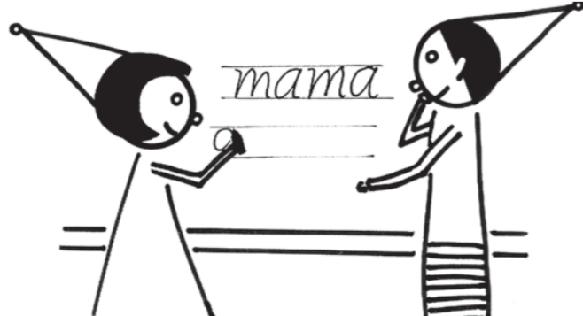
RYŚ: WIKADYSZAWY OWICZARZY

– I co, dostanę jedynkę? – Ludmiłka – nauczycielka pokręciła głową. – Dopiero wtedy, gdy twoje literki będą wyglądały tak, jak te w zeszytach ćwiczeń dla pierwszej klasy. – Podsunęła mu publikację pod nos. – Twoje bazygroty na jedynkę nie zasluguja. – Głosik niechętnie wykonał zadanie. A potem szybko zaproponował: – Teraz przyniesiemy się na lekcję geografii na drugim stopniu. Dla odmiany ja będę nauczycielem. Będziemy uczyli się o bardzo odległych krajach, Australii albo Nowej Zelandii. I to będzie nareszcie ciekawa lekcja. (dc)