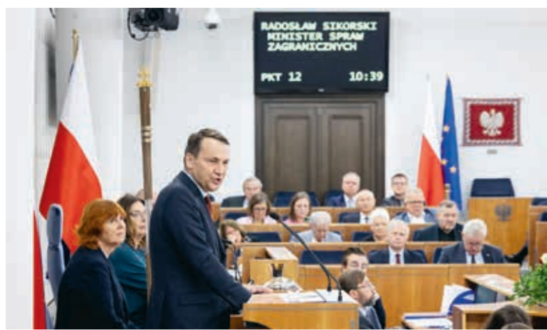
Radosław Sikorski.

Zaznaczył, że w 2024 roku z tej sumy kwotami po 160 milionów złotych dysponowały MEN i MSZ, choć w przypadku MSZ ponad 40 proc. środków jest przeznaczona na finansowanie polskich mediów nadających dla zagranicy. Wyliczył, że 85 mln zł trafiło do dyspozycji MSWiA, po 60 mln zł do KPRM i resortu nauki, a 10 milionów – do