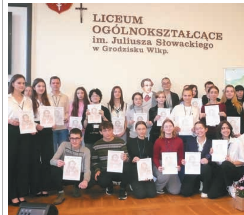
• Uczestnicy Złotu w Grodzisku Wielkopolskim.