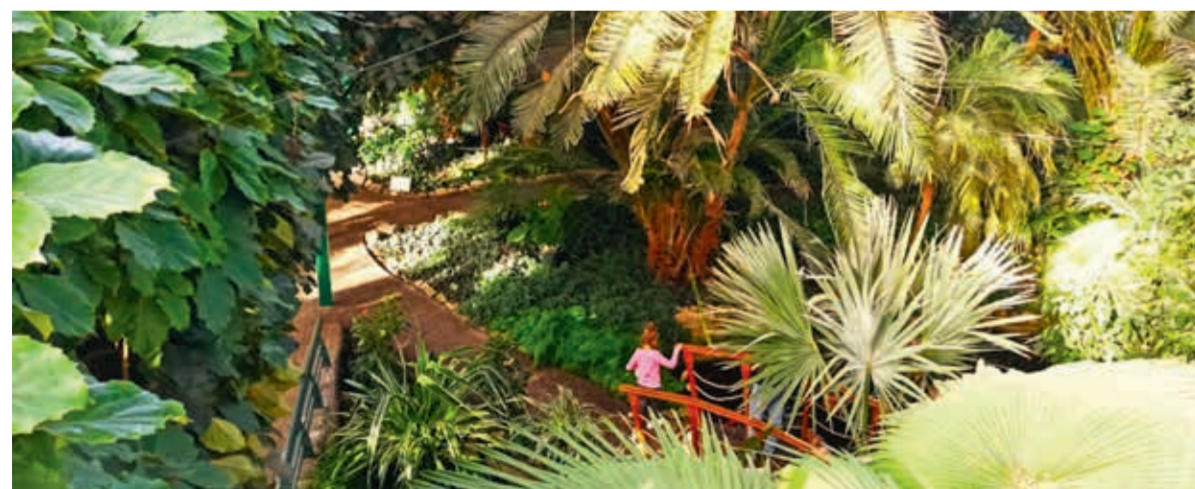
• Swoje klimaty znajdują tu m.in. miłośnicy egzotycznej flory.

Mamy dla Was propozycję na ciekawe spędzenie jesieni i zimy w... tropikalnych klimatach w Gliwicach. W tamtejszym Parku im. Chopina stoi Gliwicka Palmiarnia, jedna z najnowocześniejszych w Europie Środkowej, oferująca wiele frapujących przeżyć dla młodych i starszych podróżników.