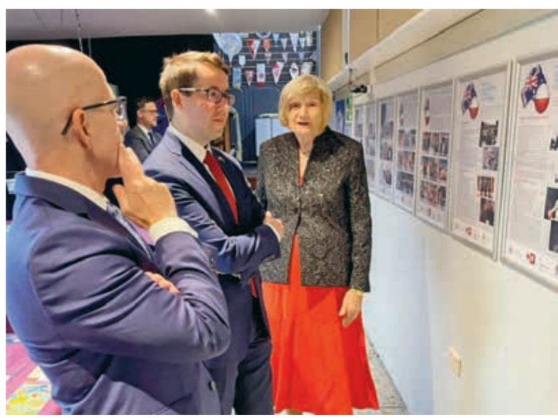
Fragment wystawy w Sydney.

Wystawa składa się z 17 planz przedstawiających zdobycie pierwszych medalu dla Polski w Paryżu (pr. rozr.) 23.10 Panorama 23.45 Dziennik regionów.