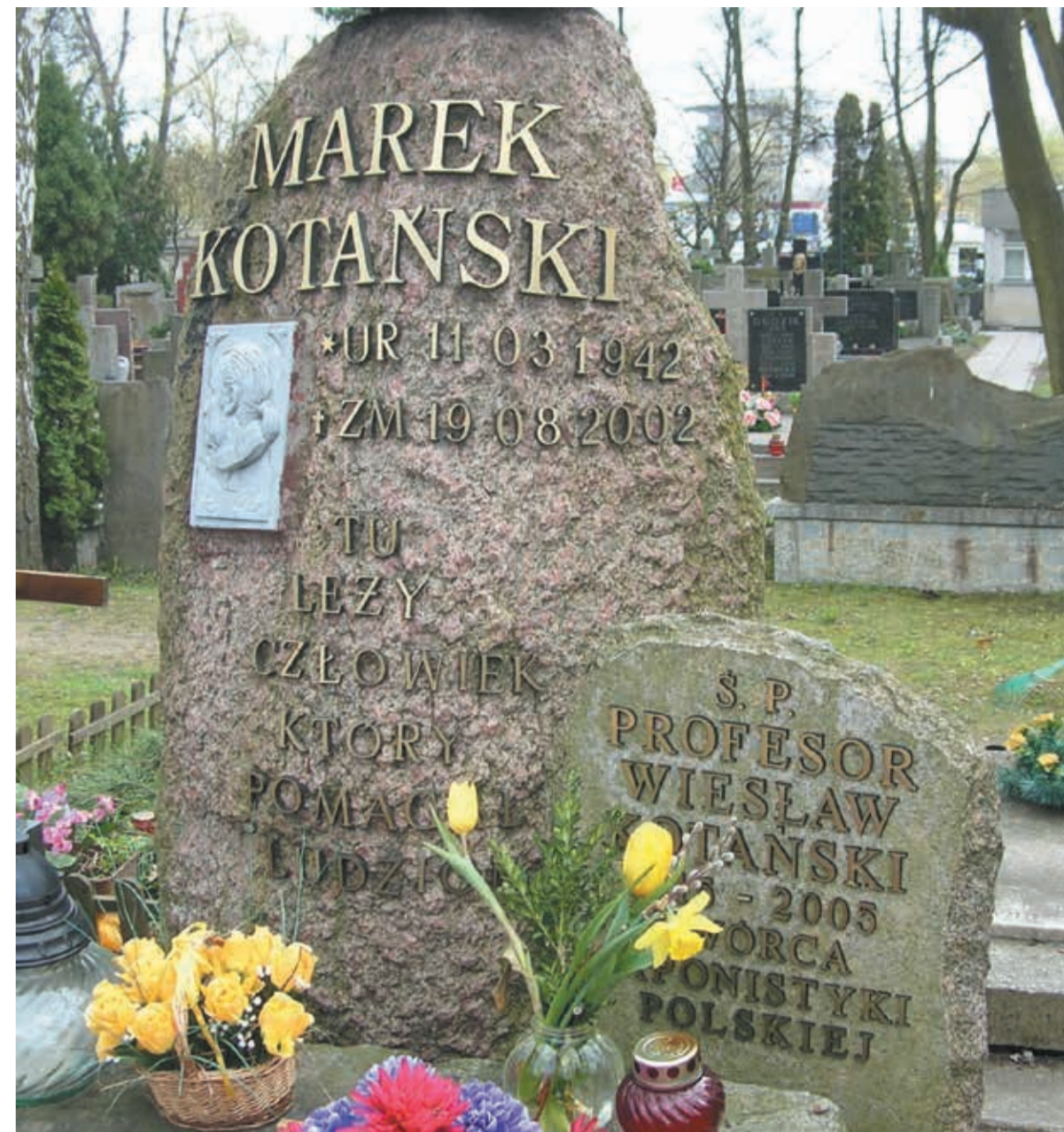
• Grób Marka Kotańskiego na Powązkach Wojskowych w Warszawie. Znajdziemy na nim epitafium: „Tu leży człowiek, który pomagał ludziom”.

– Pisarka Wanda Chotomska, która na początku lat 50. zaczęła