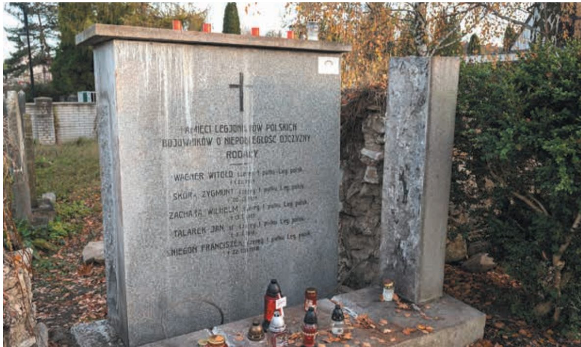
● Pomnik Legionistów w Jabłonkowie czeka na sfinalizowanie remontu.