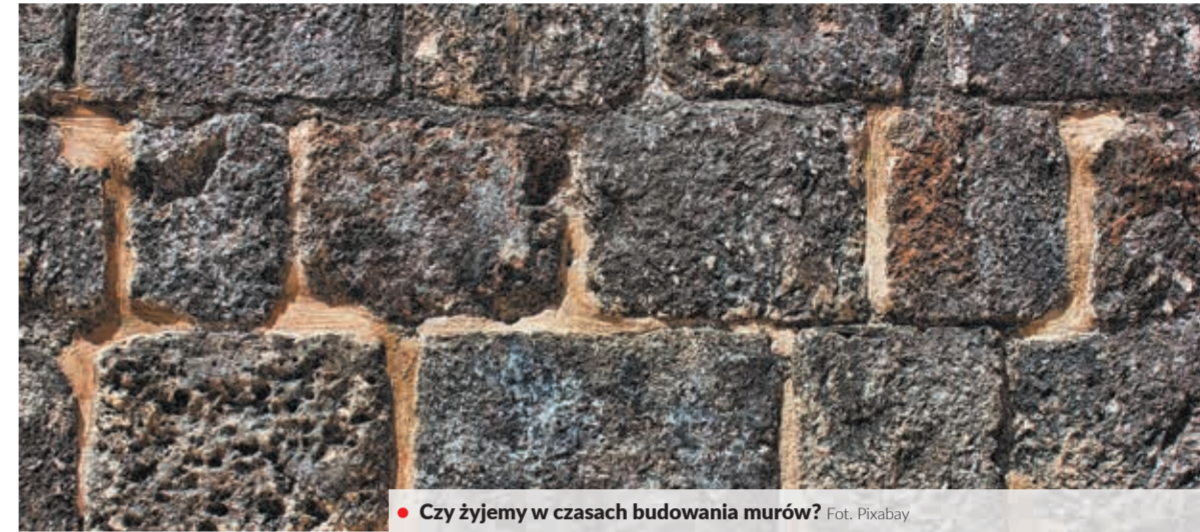
● Czy żyjemy w czasach budowania murów?

W gruncie rzeczy najnowsza historia Europy opisuje burzenie „muru berlińskiego” – symbolu izolacji