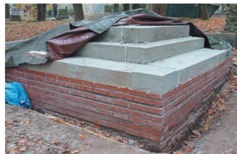
• Miejsce pochówku polskich górników już niebawem zyska godny wygląd. (kdm)

Pomnik z tablicą, na której znajdują się 34 nazwiska polskich górników, ofiar wypadku z 1895 roku w kopalni Hohenegger, jest frag-