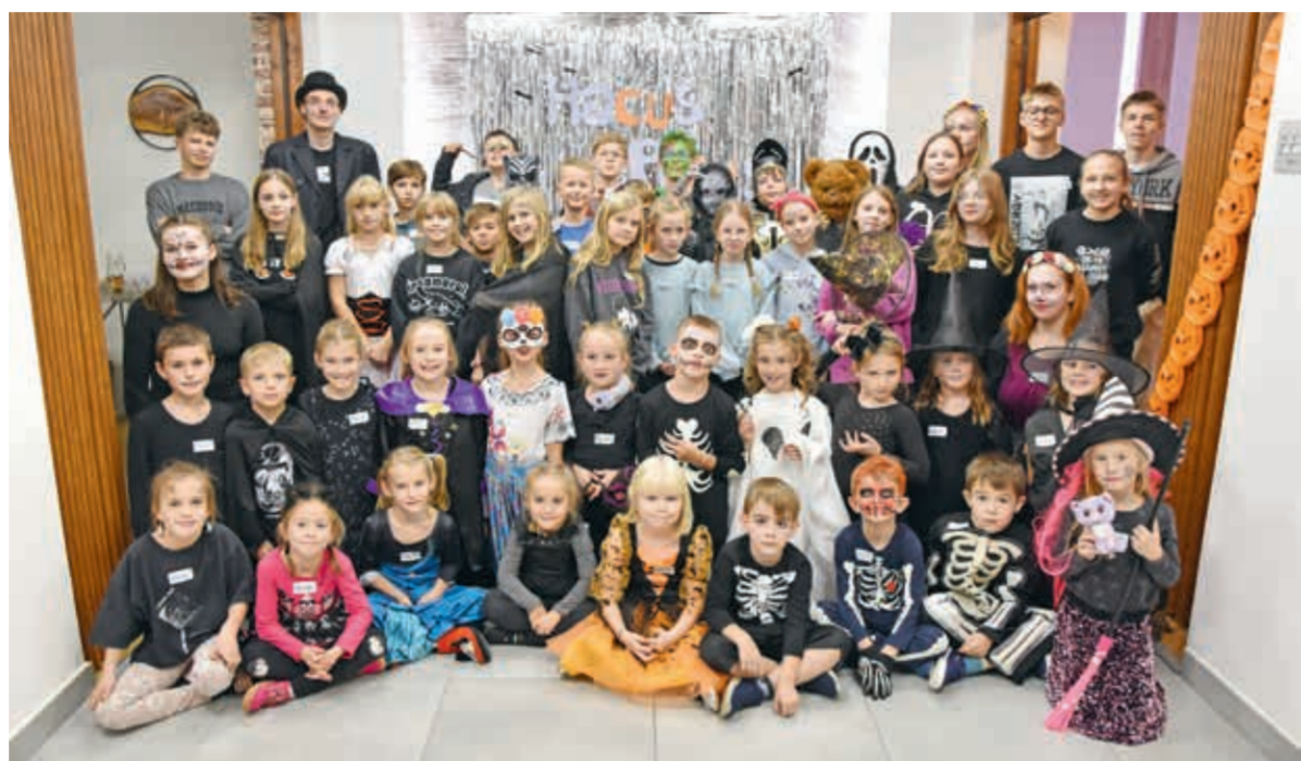
• Dzieci miały wielką frajdę już z samego faktu, że mogły przebrać się w halloweenowe stroje. A potem zaczęła się zabawa z czytaniem.

Dom PZKO w Lesznej Dolnej z soboty na niedzielę stał się „strasznym” miejscem. Wszystko za sprawą ósmej edycji „Z książką pod poduszką”, która tym razem została zorganizowana w halloweenowym klimacie. Dzieci efektywnie przebrane za czarodziejki, rycerzy, szkielety, duchy i inne postaci, spędziły wieczór i noc na ciekawych zajęciach, których przewodnim motywem było czytanie książek w języku polskim.