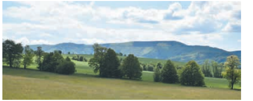
W Wielopolu nie brakuje pięknych widoków na Beskidy.

W ielopole zostało wyróżnione w ogólnopolskiej rundzie konkursu Wieś Roku. Podczas gali w Senacie RC w Pradze otrzymało pomarańczową wstęgę za wzorową współpracę z podmiotem rolniczym. Patronem nagrody jest Ministerstwo Rolnictwa RC. Wielopole rozciąga się na obszarze 300 hektarów i ma 295 mieszkańców. – Sadzimy w gminie aleje i pasy zieleni, które obniżają erozję ziemi spowodowaną przez wiatr i wodę. Zagajniki i poletka są przyjazne dla zwierząt. Miejscowi myśliwi trosz-